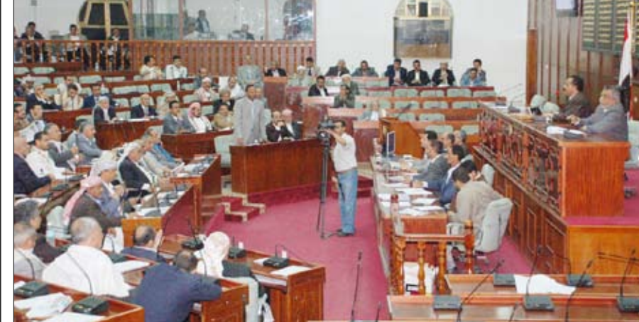
مجلس النواب في جلسته أمس برئاسة الراعي

صنعاء / سيا : أقر مجلس النواب في جلسته أمس برئاسة رئيس المجلس يحيى علي الراعي، توجيه توصيات للحكومة بشأن المعتقلين على ذمة الأحداث في عدد من محافظات الجمهورية وذلك بناء على مناقشته لمذكرة عدد من أعضاء المجلس المبنية على شكاوى أسر عدد من المعتقلين. وتضمنت التوصيات إعادة المعتقلين على ذمة الأحداث في عدد من محافظات الجمهورية الذين تم نقلهم إلى صنعاء من محافظاتهم، وإحالة من ثبتت إبانهم إلى القضاء وإطلاق سراح من لم تثبت إبانهم من المعتقلين. كما أقر المجلس توجيه عدد من التوصيات إلى الحكومة بناء على مناقشته لتقرير اللجنة الخاصة المكلفة