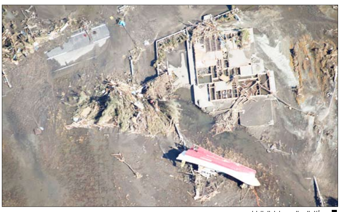
من آثار المد البحري لزلزال اليابان

واشنطن (كاثيونيكا/كتيو) / 14 أكتوبر / رويترز، فر الآلاف من منازلهم على طول ساحل كاليفورنيا يوم أمس مع بدء وصول موجات مد عاتية أثارها الزلزال الهائل في اليابان إلى الساحل الغربي للولايات المتحدة بعد مرورها بهواي. لكن الموجات العاتية فقدت على ما يبدو قدرا كبيرا من قوتها بعدما قطعت آلاف الكيلومترات عبر المحيط الهادي إلى أمريكا الشمالية وفقا لتقارير أولية من مسؤولين في الولايات المتحدة والمكسيك وكندا. وقال مسؤولون في سلسلة جزر هاواي ان ارتفاع الموجات هناك لم يكن أعلى من الطبيعي. وكانت الموجات عند سواحل كاليفورنيا أكبر من المعتاد لكن لم تتعرض أي بلدة لاضرار حقيقية سوى بلدة كريست سيتي قرب حدود كاليفورنيا مع أوريغون وبلدة سانتا كروز على بعد 115 كيلومترا جنوبي سان فرانسيسكو. وقال مسؤولون بإدارة الطوارئ ان نحو 35 سفينة وأغلب أرصفة الميناء تضررت في كريست سيتي حيث ارتفعت الموجات إلى أعلى من مترين في حين تعرضت سانتا كروز لاضرار تكلف نحو مليوني دولار لحقت بالأرصفة والسفن.