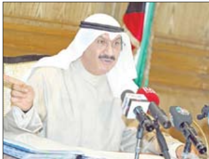
الشيخ سالم عبد العزيز الصباح

المرتفعة. وتعززت الكويت تشكيل اتحاد نقدي مع كل من السعودية وقطر والبحرين. واستبعد المحافظ رفع الضمان الحكومي على الودائع البنكية في وقت قريب. وقال الشيخ سالم "سيتم النظر في رفع هذا الضمان بانتهاء الظروف التي أدت إليه وفي اعتقادي أن الوقت ليس مناسباً الآن للحديث عن مثل هذا الإجراء". وأوضح أن القانون الصادر في 2008 بشأن الضمان الحكومي للودائع لدى البنوك المحلية في دولة الكويت والذي صدر بعد أزمة بنك الخليج الكويتي هدف بالأساس "إلى دعم الثقة في الجهاز المصرفي وحماية الوضع التنافسي للبنوك المحلية".