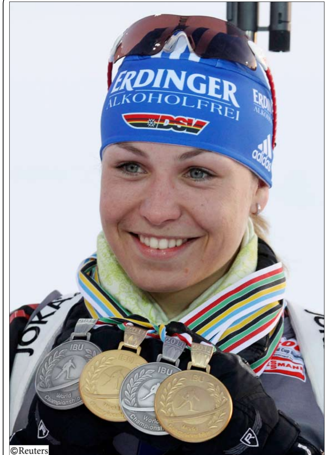
الألمانية ماغداлина نيونر خلال حفل توزيع الجوائز أمس لسباق السيدات في بطولة العالم لسباق بياثلون للترنلج في كاتني مينسك بروسيا .