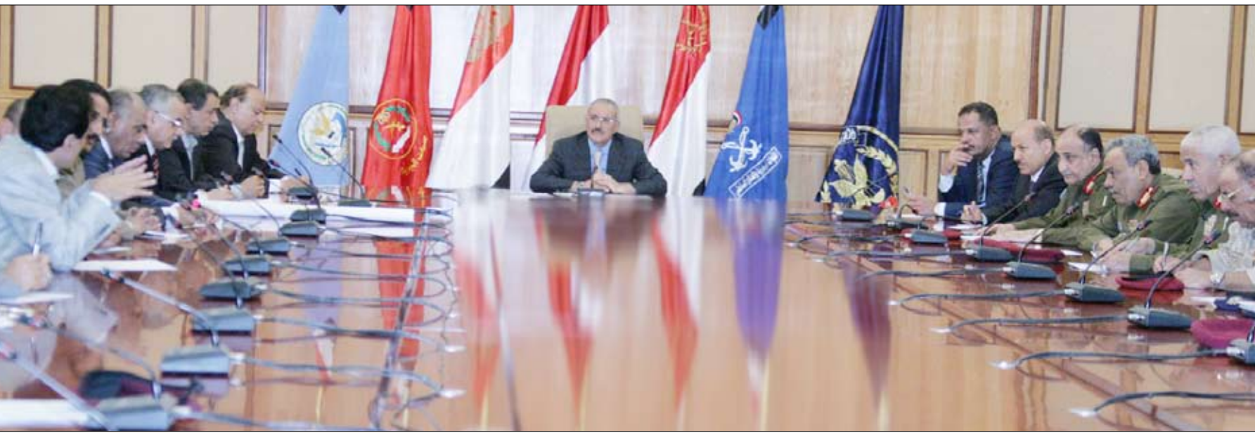
رئيس الجمهورية لدى اجتماعه بعدد من قيادات الدولة واللجنة الأمنية العليا أمس

صنعاء / سيا : رأس فخامة الأخ علي عبدالله صالح رئيس الجمهورية أمس اجتماعاً لعدد من قيادات الدولة واللجنة الأمنية العليا، تم الوقوف فيه أمام التطورات الجارية في الساحة الوطنية ومنها ما جرى منذ مساء أمس الأول من العناصر المثيرة للفضي والشغب من اعتداءات ومضايقات للمواطنين. واستمع الاجتماع إلى تقرير من وزير الداخلية أوضح أن مجاميع من العناصر الفوضوية التابعة لأحزاب اللقاء المشترك منذ عصر يوم أمس الأول قامت بنصب خيام بالقوة أمام منازل المواطنين ومحللاتهم التجارية في أحياء الكويت والرقاص والزراعة والجامعة، ومحاصرة المواطنين والحيلولة دون ممارسة الأنشطة التجارية واليومية في محللاتهم ومنازلهم فوجهوا نداءات استغاثة وتقدموا ببلاغات إلى وزارة الداخلية حول ما يتعرضون له من حصار لمنازلهم ومحللاتهم التجارية ومضايقات شديدة لعائلاتهم، وحاولوا منع تلك العناصر من نصب الخيام أمام منازلهم ومحللاتهم التجارية والشوارع المؤدية لها. وأدى ذلك إلى حدوث اشتباكات وأعمال شغب بين المواطنين من سكان تلك الأحياء، ونتج عن ذلك إصابة 161 من أفراد الأمن بإصابات مختلفة، بالإضافة إلى إصابة عدد من المواطنين والمعتصمين. وتناقش الاجتماع العديد من القضايا المتصلة بالجوانب الأمنية، والحفاظ على الأمن والاستقرار والسكينة العامة والسلام الاجتماعي. وحث الجميع على التعاون من أجل الحفاظ على أمن الوطن والمواطنين ولما فيه المصلحة العامة. كما ناقش الاجتماع عدداً من الموضوعات والقضايا المدرجة في جدول أعماله.