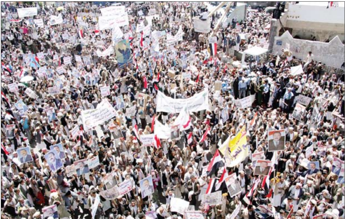
جانب من المهرجان الحاشد في ميدان التحرير أمس

الاحتقان السياسي وتجنّب الوطن الفتنة وصون مكتسباته ووحدته وسلّمه الاجتماعي . كما ردد المشاركون هتافات تندد بتنصل أحزاب اللقاء المشترك من الحوار وانقلابها على كافة الاتفاقيات السياسية التي تم توقيعها معها ورفضها الحوار كهدماً حول القضايا التي تهم الوطن وتعزز الديمقراطية والحرية فيه.