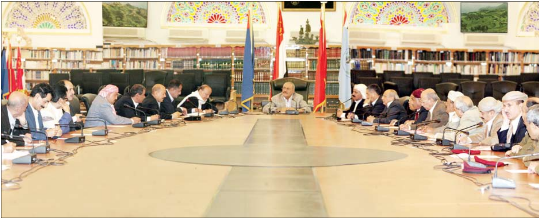
رئيس الجمهورية لدى ترؤسه اجتماع مجلس الدفاع الوطني أمس

صنعاء / سبأ: رأس فخامة الأخ الرئيس علي عبدالله صالح رئيس الجمهورية - القائد الأعلى للقوات المسلحة اجتماعاً لمجلس الدفاع الوطني مساء أمس بحضور عدد من قيادات الدولة.