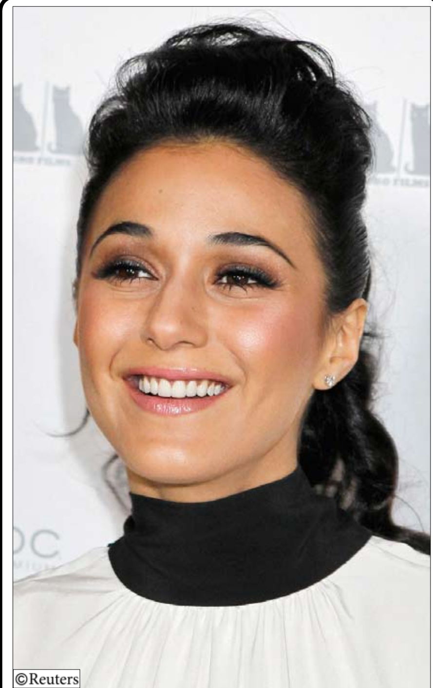
الممثلة الكندية إيمانويل كريك أثناء حضورها أمس للعرض الأول للفيلم الروائي (فتاة تسير إلى الكازينو) في هيوبيود بكاليفورنيا. ومن المقرر أن يعرض الفيلم الروائي على اليوتيوب عبر الإنترنت في 11 مارس 2011.

عقد بمحافظة عدن اجتماع موسع برئاسة عبدالله منصور بن سقا مدير عام مكتب التعليم الفني والتدريب المهني وبحضور عبداللطيف شرف الدين مدير المعايير والجودة وضم المعاهد الأهلية الخاصة بالمحافظة. وناقش الاجتماع المشاكل التي تواجه الشباب ودور المعاهد في حل هذه المشاكل في ضوء تنفيذ البرنامج التدريبي الخاص بالمقدم من المعاهد الأهلية والخاصة الذي تقدر كلفته بـ 460 مليون ريال لتمكين 22300 شاب وشابة من الالتحاق بسوق العمل. وياتي عقد الاجتماع في إطار اهتمام الدولة بتفعيل دور الشباب في المجتمع للنهوض بالعلمية التنموية من خلال مجلة من المعالجات والإجراءات الكفيلة بدعم جهود التنمية المجتمعية الفاعلة ومواجهة البطالة والتخفيف منها إلى أبعد حد ممكن ودعم مشاركة الشباب في مجال التعليم الفني والمهني الذي يمكنهم من الحصول على فرص عمل مناسبة.