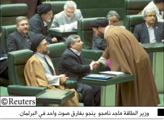
وزير الطاقة ماجد نامجو ينجو بفارق صوت واحد في البرلمان.

والغاز ذات الأهمية الحيوية والتي تقع تحت اختصاص وزارة النفط. وقال علي لاريجاني رئيس البرلمان بعد تصويت النواب «الأعضاء المشاركون في التصويت 209 بينهم 101 مؤيد لعزل الوزير و102 ضد عزله. عدد الأعضاء الممتنعين عن التصويت ستة. بالتالي فإن الأعضاء لم يصوتوا لصالح الاقالة وسيظل الوزير نامجو يواصل عمله. ولطالما أشار الرئيس المتشدد غضب أعضاء البرلمان الذي يهيمن عليه المحافظون أيضا والذين يتهمونه بالبطء في إحالة الميزانيات الوطنية إلى النواب والقشيل في صرف الأموال المخصصة لمشروعات مثل توسعة مترو طهران.