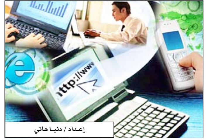
إعداد / دنيا هاني

بكين /متابعات، توفي رجل في الصين بعدما أمضى ثلاثة أيام متتالية يلعب أمام شاشة كمبيوتر في مقهى إنترنت في بكين دون نوم ومكتفياً بطعام قليل. وقد دخل الرجل الثلاثيني في غيبوبة خلال الأسبوع الحالي عندما كان في المقهى وتعدّر إنعاشه في العيادة الطبية التي نقل إليها على ما ذكرت صحيفة (بيجين تايمز). وهذه المسألة تعكس ظاهرة إدمان الألعاب الإلكترونية التي يعاني منها 33 مليون مراهق صيني على ما أفاد باحثون أوردت أراءهم الصحف.