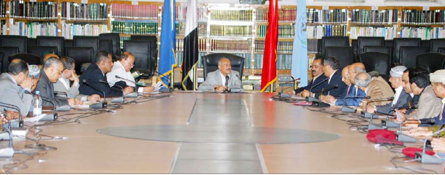
رئيس الجمهورية يترأس اجتماع قيادات الدولة السياسية والعسكرية والأمنية أمس