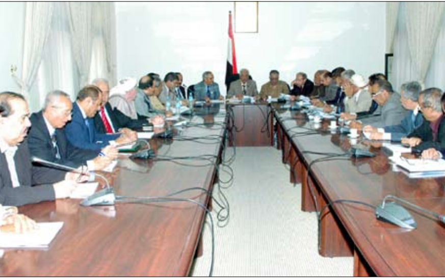
من اجتماع اللجنة الرئيسية لمجلس الشورى برئاسة البار