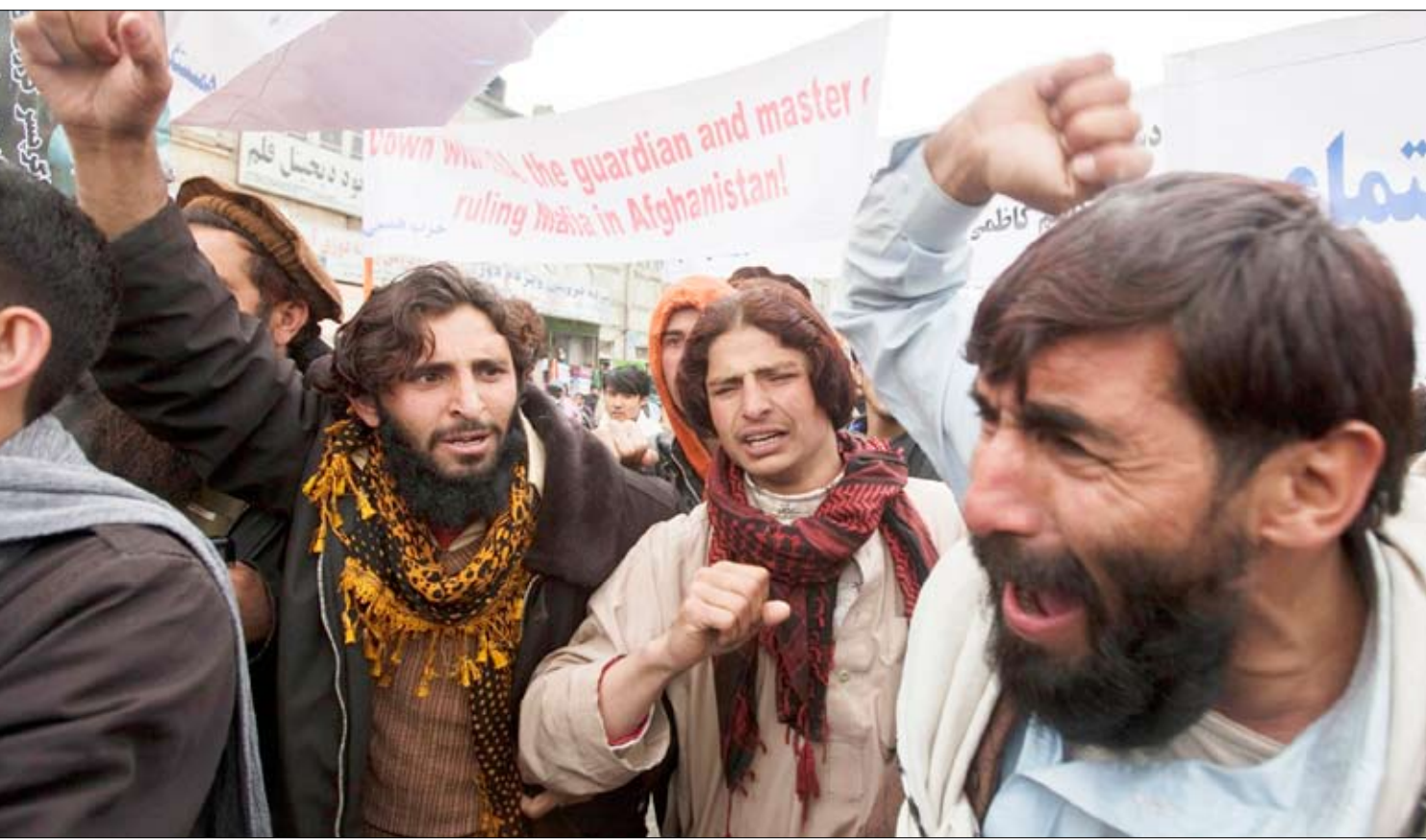
أفغان يرددون شعارات خلال احتجاج في كابول يوم أمس

كابول / 14 أكتوبر / حامد شاليزي وجوناثون بورش: قال الرئيس الأفغاني حامد كرزاي لقائد القوات الأمريكية وقوات حلف شمال الأطلسي في أفغانستان الجنرال ديفيد بتريوس أمس أن اعتذاره عن غارة جوية قتلت تسعة أطفال الأسبوع الماضي «ليس كافياً». وذكر القصر الرئاسي الأفغاني في بيان أن كرزاي أوضح في اجتماع مع مستشاريه الأمنيين حضره بتريوس أن سقوط ضحايا مدنيين على يد القوات الأجنبية «لم يعد مقبولاً» لدى الحكومة الأفغانية أو الشعب الأفغاني. وتوتر العلاقات بين الولايات المتحدة وأفغانستان». ونقل البيان عن كرزاي قوله «شعب أفغانستان سلم تلك الحوادث المرعبة وتلك الاعتذارات أو الإذابات لن تدواي جرحه». وقبل ساعات من صدور بيان كرزاي هتف مئات من المحتجين الأفغان «الموت لأمريكا» في العاصمة الأفغانية ضد سلسلة حوادث مقتل المدنيين الأخيرة ما يدل على تعاطف المشاعر المناهضة للغرب في صدور المواطنين الأفغان.