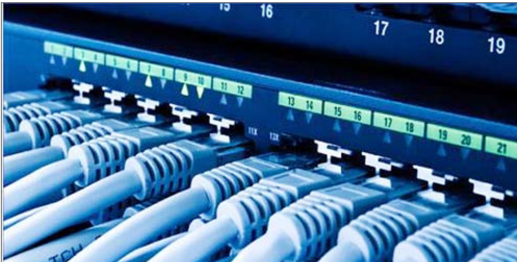
سعاء / متابعات،

خطاً هاتفياً في العام الذي سبقه. وأفاد تقرير إحصائي صادر عن المؤسسة العامة للاتصالات السلكية واللاسلكية أن الساعات الهاتفية المجهزة في عموم محافظات الجمهورية وصلت حتى نهاية العام الماضي إلى مليون و 353 ألفاً و 847 خطاً هاتفياً، بزيادة 17 ألفاً و 23 خطاً هاتفياً عن المقابل من العام الماضي 2009م.