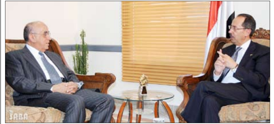
الأرجحي خلال لقائه رئيس مجلس إدارة الصندوق العربي أمس