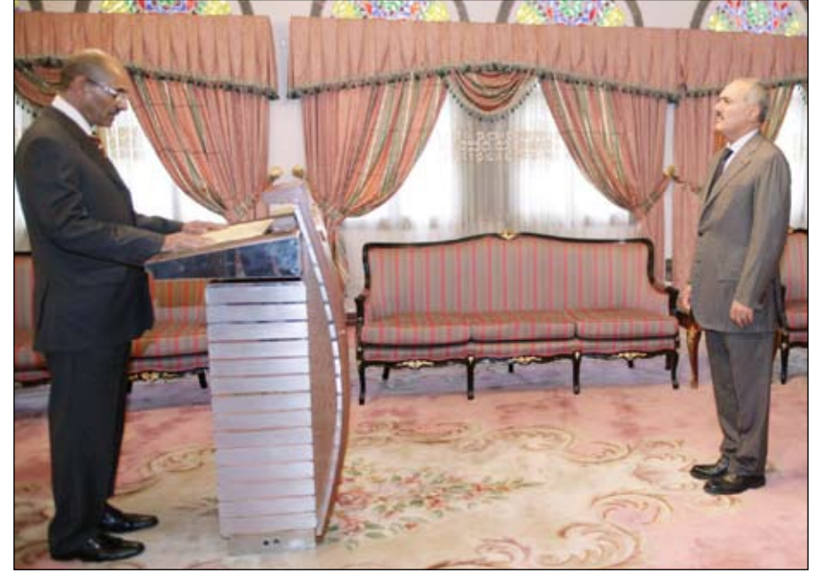
صباح / سبأ، على عبدالله صالح رئيس الجمهورية أحمد عبدالله المجيدي بمناسبة تعيينه محافظاً لمحافظة لحج. أدى اليمين الدستورية أمس أمام فخامة الأخ الرئيس

صباح / سبأ، واصل مجلس النواب عقد جلسات أعماله لفترة انعقاده الثالثة للدورة الثانية من دور الانعقاد السنوي الثامن برئاسة رئيس المجلس يحيى علي الراعي. واستمع المجلس إلى تقرير خاص بحادثة مقتل المواطن مراد محمد علي عوض الوصابي واصابة عدد آخر من المواطنين في منطقة حدة بأمانة العاصمة مقدم من وزارة الداخلية. وتناول التقرير - الذي قرأه وكيل وزارة الداخلية العميد عبد الرحمن البروي - الإجراءات المتخذة من قبل الأجهزة الأمنية المختصة عقب الحادث، وتوج تقرير وزارة الداخلية حول هذا الحادث وبعد من الاستنتاجات. وفي ضوء ذلك قدم أعضاء المجلس عدداً من الآراء والملاحظات بصدد الإجراءات التي اتخذتها الأجهزة المعنية في وزارة الداخلية باتجاه التحري والتحقيق في هذه القضية. مؤكداً