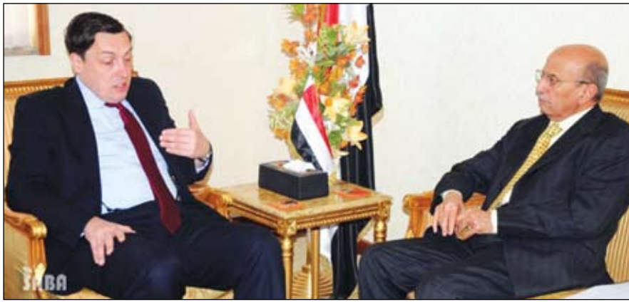
.. ويلتقي السفير البريطاني

التقى وزير الخارجية الدكتور أبو بكر القربي أمس سفير الولايات المتحدة الأمريكية بصنعاء جيرالد فيرستاتين.