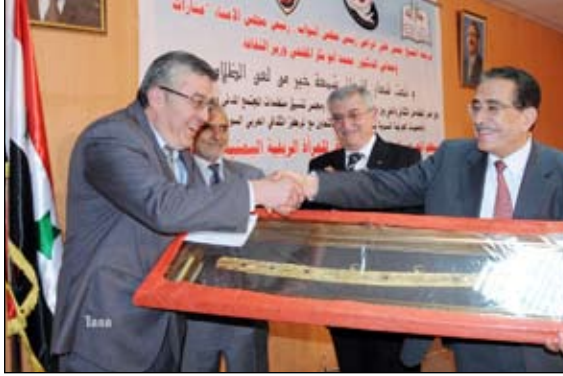
وزیر الثقافة والسفير السوري يكرمان المشاركين في المعرض والداعمين والمساهمين في إنجاحه.

ولفت الوزير المفلي الى ضرورة الاهتمام بالموروث الحرفي وتكاتف جهود الجميع بما يلبي إحياء الموروث الحرفي ، مبيّناً أن وزارة الثقافة وبناء على توجيهات رئيس الوزراء قامت بشراء منتجات المعرض بجمع مليوني ريال في إطار تشجيع الجمعيات العاملة في هذا القطاع. من جانبه أشاد سفير الجمهورية العربية السورية بصنعاء عبد الغفور صابوني بما تضمنه المعرض من مشغولات يدوية جسدت إبداع المرأة الريفية التي تعد جزءاً من الهوية الثقافية. وأشار إلى ما يمتلكه اليمن من موروث تراثي وحضاري ضارب في أعماق التاريخ، لافتاً إلى أهمية دعم ورعاية هذا القطاع بما يكفل استمراره في ظل السوق التجارية المفتوحة. بدوره أوضح رئيس مجلس إدارة مؤسسة الغزل والنسيج محمد حاجب الجهود المبذولة لإعادة المؤسسة الى دورها الريادي