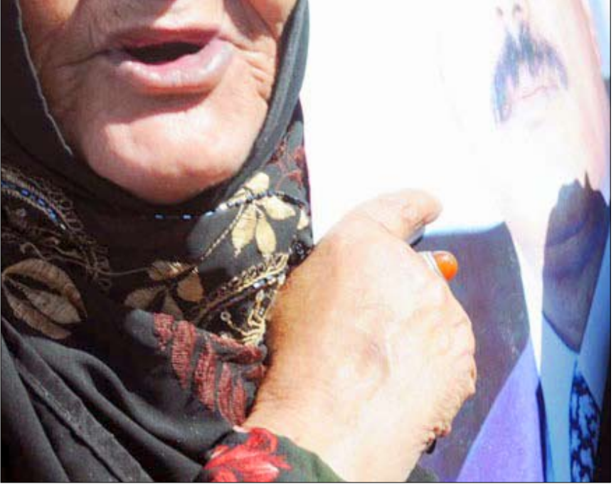
مسنة تحمل صورة الرئيس في المسيرة الحاشدة لتأييد مسيرة رئيس الجمهورية لمواصلة الحوار أمس في عمران