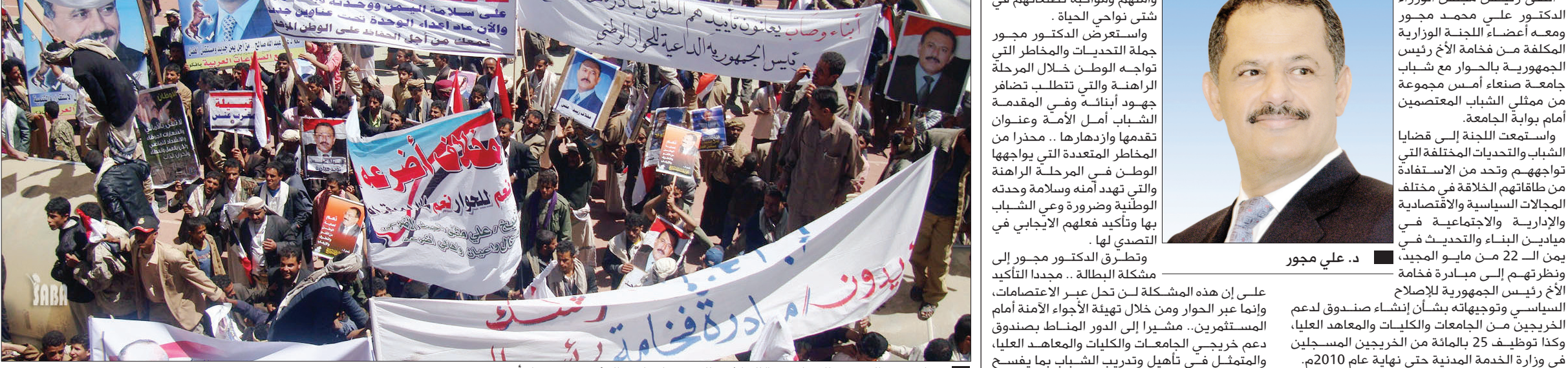
جانب من المسيرة الجماهيرية الحاشدة المؤيدة لمبادرة الرئيس في ذمار أمس

صنعاء / سيا : شارك في مسيرة حاشدة شارك فيها عشرات وميغعة عنس ومغرب عنس، للتعبير عن التأييد لمبادرة