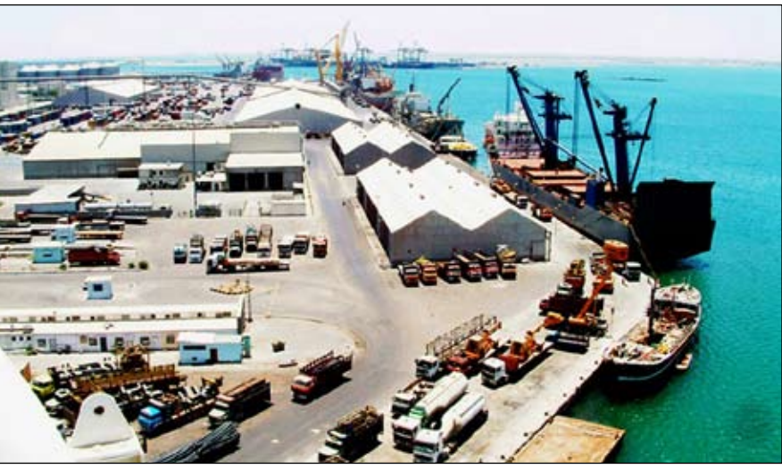
■ ميناء المعلان

إعدن/ سبا: تم أمس بإرصفة ميناء عدن إفراغ 28 ألف طن من مادة القمح الأسترالي أفرغتها إحدى السفن التجارية الليبيرية. وأفادت إحصائية للشناط الملاحي اليومي لميناء عدن أنه أفرغت بإرصفة المعلان 27 ألفاً و(300 طن من الحديد والأسمنت منها 24 ألفاً و(300 طن من الحديد و(300 و(600 طن من الأسمنت الخاص بالمشاريع الإستثمارية والتنموية. كما أفرغت السفينة كونا مارجا السنغافورية 900 حاوية بضائع و(واردات متنوعة وأقلت 27 حاوية صادرات من القطن اليمني إلى إيطاليا.