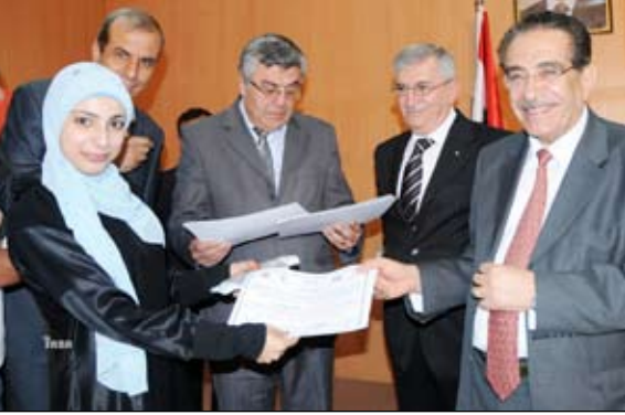
وزير الثقافة والسفير السوري يكرمان المشاركين في المعرض والداعمين والمساهمين في إنجاحه.