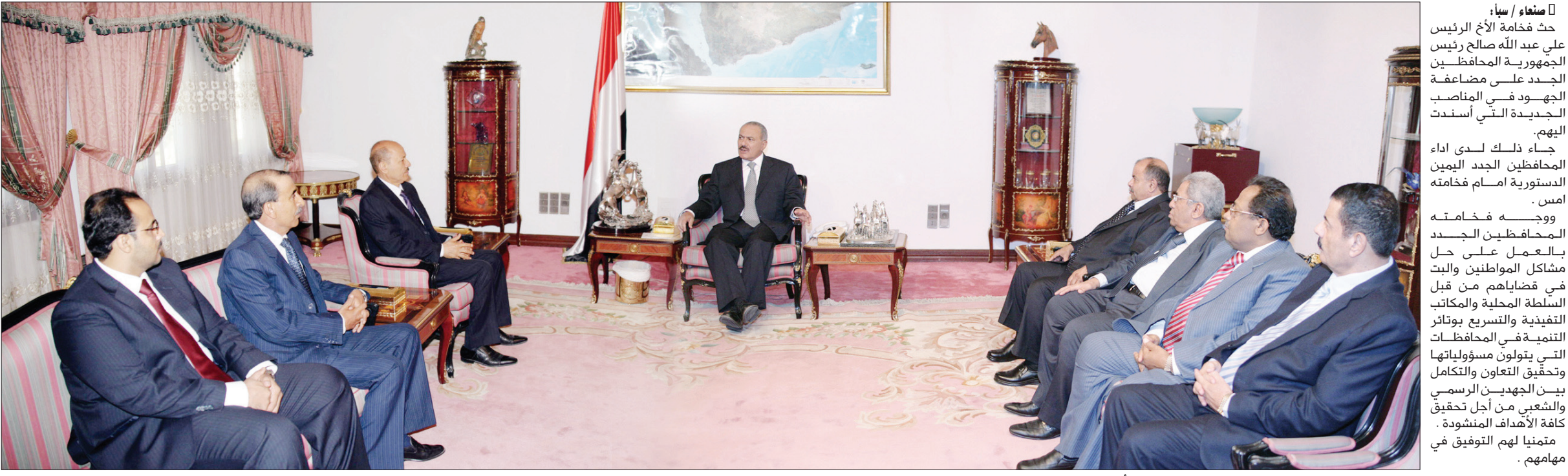
التفاصيل ص 3 ■ رئيس الجمهورية لدى لقائه المحافظين الجدد أمس

صنعاء / سيا : حث فخامة الأخ الرئيس علي عبد الله صالح رئيس الجمهورية المحافظين الجدد على مضاعفة الجهود في المناصب الجديدة التي أسندت إليهم. جاء ذلك لدى أداء المحافظين الجدد فخامته امس.