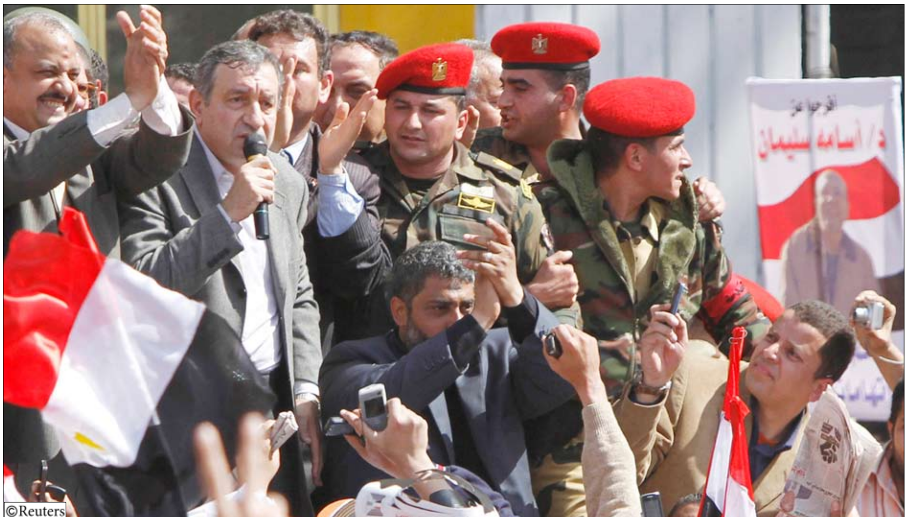
رئيس الوزراء المصري المكلف عصام شرف مع جماهير حاشدة في ميدان التحرير يوم أمس الجمعة