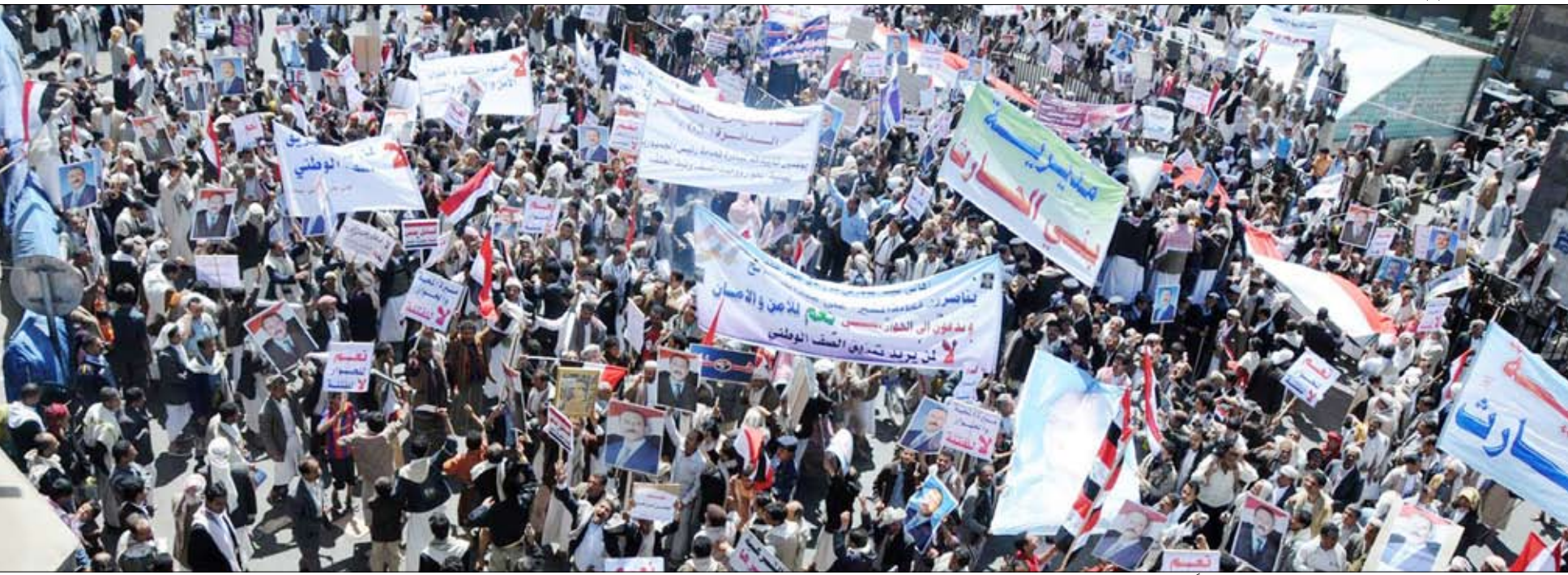
جموع من المواطنين محتشدة في ميدان التحرير تأييداً لمبادرة الرئيس

شهدت ساحة ميدان التحرير والشوارع والأحياء المحيطة بها عقب صلاة الجمعة أمس مهرجاناً جماهيرياً حاشداً، شارك فيه مئات الآلاف من المواطنين الذين توافدوا من مختلف مديريات أمانة العاصمة ومحافظة صنعاء للتعبير عن تأييدهم ومباركتهم لمبادرة فخامة الأخ الرئيس علي عبدالله صالح رئيس الجمهورية المدعومة من رجال الدين وتأييدهم لدعوة فخامته مواصلة الحوار للتهيئة للحوار الوطني الشامل ورفضهم القاطع لأعمال الفوضى والعنف والتخريب والتأكيد على ضرورة تعزيز الإصطلاف الوطني للحفاظ على الأمن والاستقرار والسكينة العامة وحماية الثوابت الوطنية. ورفع المشاركون في المهرجان العلم الوطني وصور فخامة الأخ رئيس الجمهورية وشعارات تقول " نعم للأمن والاستقرار والتنمية"، "لا للفوضى والتخريب"، "لا لصناعات الأزمات ومثري الفتن"، "لا لمثري المناطقية والطائفية"، بالروح بالدم تنفيذك يا يمن". وحمل المشاركون في المهرجان لافتات كتب عليها عبارات تستنكر بشدة الدعوات الساعية إلى السير بالوطن نحو الفوضى والعنف والفتن والخروج عن الإجماع وشق الصف الوطني.. مؤكداً ضرورة تكاتف كافة الجهود في سبيل إنجاح الحوار الوطني الشامل بما يكفل بلورة معالجات مختلف القضايا الوطنية في ظل الثوابت الوطنية وبما يجنب الوطن مخاطر الانزلاق إلى ويلات الصراع والفتن.