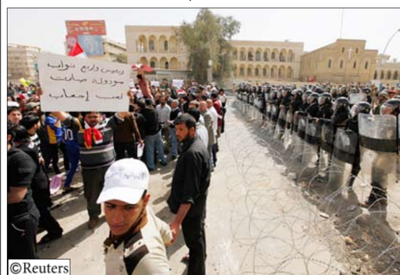
تظاهر الألو في أنحاء البلاد ضد الفساد وسوء الخدمات الأساسية

يزال العامة العراقيون غير راضين إلى حد كبير عن نظام سياسي ترك شخصيات تتمتع بقواعد سلطة طائفية وعرقية مترسخة في مناصبها وفشل حتى الآن في استعادة الخدمات الأساسية.