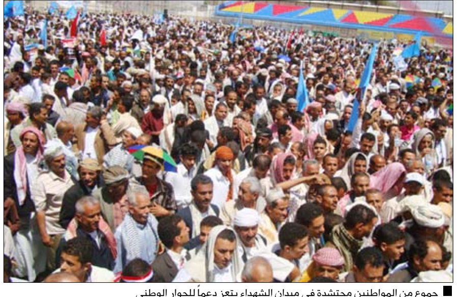
جموع من المواطنين محتشدة في ميدان الشهداء بتعز دعماً للحوار الوطني

تعز / جهة / سيا شهد ميدان الشهداء بتعز بعد صلاة الجمعة أمس تظاهرة جماهيرية حاشدة دعماً للحوار الوطني والاستقرار، ورفضاً للفوضى والعبث بأمن واستقرار الوطن. ودعت جميع القوى السياسية إلى تغليب المصلحة العليا للوطن والعودة للحوار، تعزيزاً للإخاء والمحبة والسلام وتجنب الوبتات والفتن والصراعات. وحملت المشوهد لافتات دعت إلى الحفاظ على الوحدة الوطنية والكتسبات الوطنية العظيمة. وقد أدى المحتشدون صلاة الجمعة في ميدان الشهداء، حيث دعا خطيب الجمعة عبد الرحمن الرميمة إلى ضرورة احتكام الجميع إلى شرع الله تعالى ثم