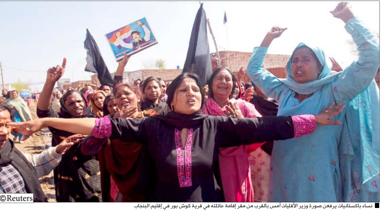
نساء باكستانيات يرفعن صورة وزير الأقليات أمس بالقرب من مقر إقامة عائلته في قرية كوش بور في إقليم البنجاب

إسلام اباد / 14 أكتوبر / رويترز: قالت صحف يوم أمس إن باكستان تتجه نحو الفوضى والعنف نتيجة موجة متزايدة من التطرف وذلك بعد يوم من اغتيال مقاتلي طالبان للوزير المسيحي الوحيد في الحكومة الباكستانية. ومن شأن اغتيال وزير الاقليات شهباز باتي في وضع النهار بالعاصمة اسلام اباد الاربعة الماضي زعزعة استقرار البلاد أكثر حيث يواجه الساسة العلمانيون معوقات نتيجة تصاعد