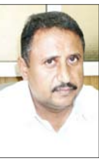
م. قائد راشد أنعم

بالجهات المختصة مراعاة الظروف المعيشية لعمال وعاملات النظافة باعتبارهم فئة معدومة وبحاجة إلى توفير السكن اللائق لتعزيز استقرارهم المعيشي والنفسي من خلال العمل على تسهيل واستكمال إجراءات حصولهم على أرض سكنية آسوة بالعمالين في مختلف قطاعات الدولة . وقال ختام تصريحه ناشد راشد المواطنين بإبداء الحرص والتعاون مع عمال النظافة لتجنب المشاكل البيئية والصحية التي تضر بالمجتمع، داعياً المشغلين في مجال النظافة إلى العودة لمزاولة المهام المنوطة بهم بما يحقق الفائدة المرجوة.