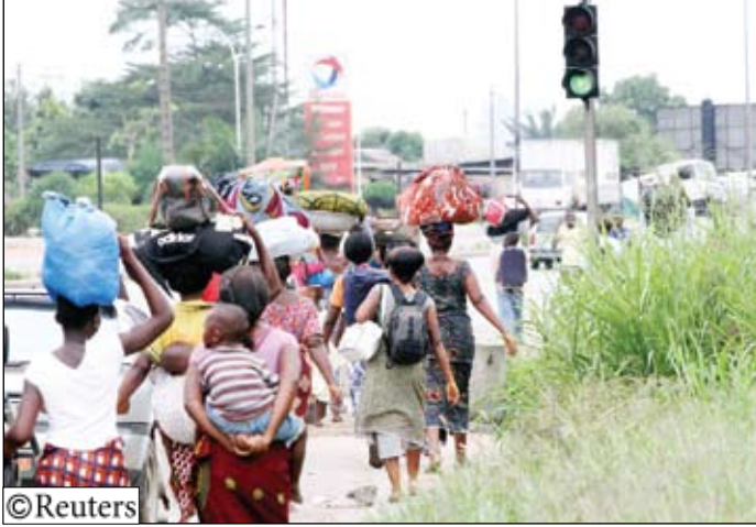
نساء واطفال فروا من منطقة أبيي المتنازع عليها في السودان يوم أمس الخميس