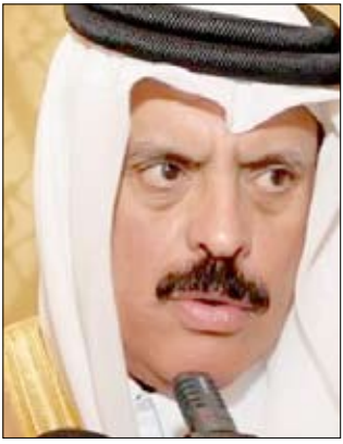
عبد الرحمن العطية

التعاون والتنسيق القائم بين دول مجلس التعاون قطع شوطا لا بأس به حتى الآن. وأكد أن دول المجلس تعد من أكبر 20 اقتصادا عالميا ولها أهميتها ليس في مجال الطاقة فحسب بل كوجهة للاستثمار المجزي. وحول المبادرات والأششطة التي يقدمها مجلس التعاون لتوفير فرص استثمار ناجحة للمواطن الخليجي بين العطية أن دول المجلس تبنت خططا طموحة لاستثمار عوائد النفط في مشاريع تعود بالرفاه للمواطن وتؤسس لاقتصاد قوي للفترة المقبلة وهناك أنواع عدة من المشاريع التي يجري التخطيط لها وتشكل فرصا استثمارية ناجحة لصغار وكبار المستثمرين على حد سواء.