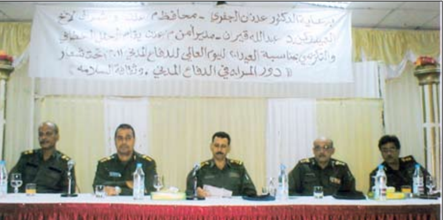
من الحفل التكريمي للدفاع المدني

والخاصة ومنظمات المجتمع المدني والدعم الذي تقدمه جهاز الدفاع المدني من أجل إنجاح فعالياته . وفي ختام الحفل تم توزيع الشهادات التقديرية والكرامية للمبشرين في الدفاع المدني والمراقق والشخصيات التي تسهم في إنجاح فعاليات الدفاع المدني.