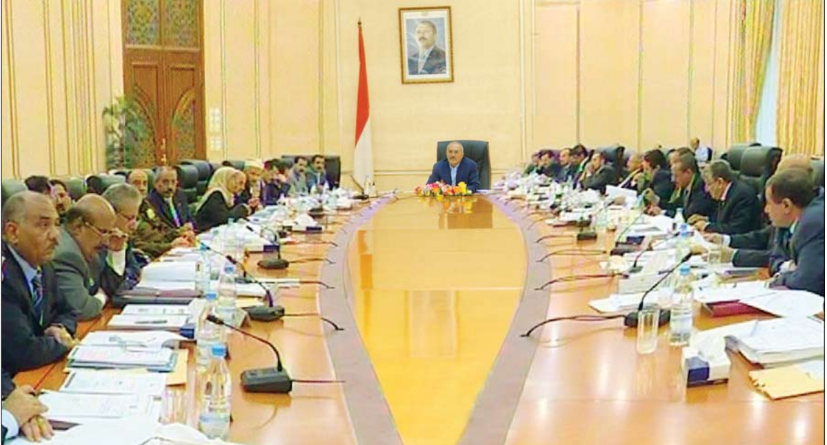
الرئيس أثناء ترؤسه جانباً من اجتماع مجلس الوزراء أمس