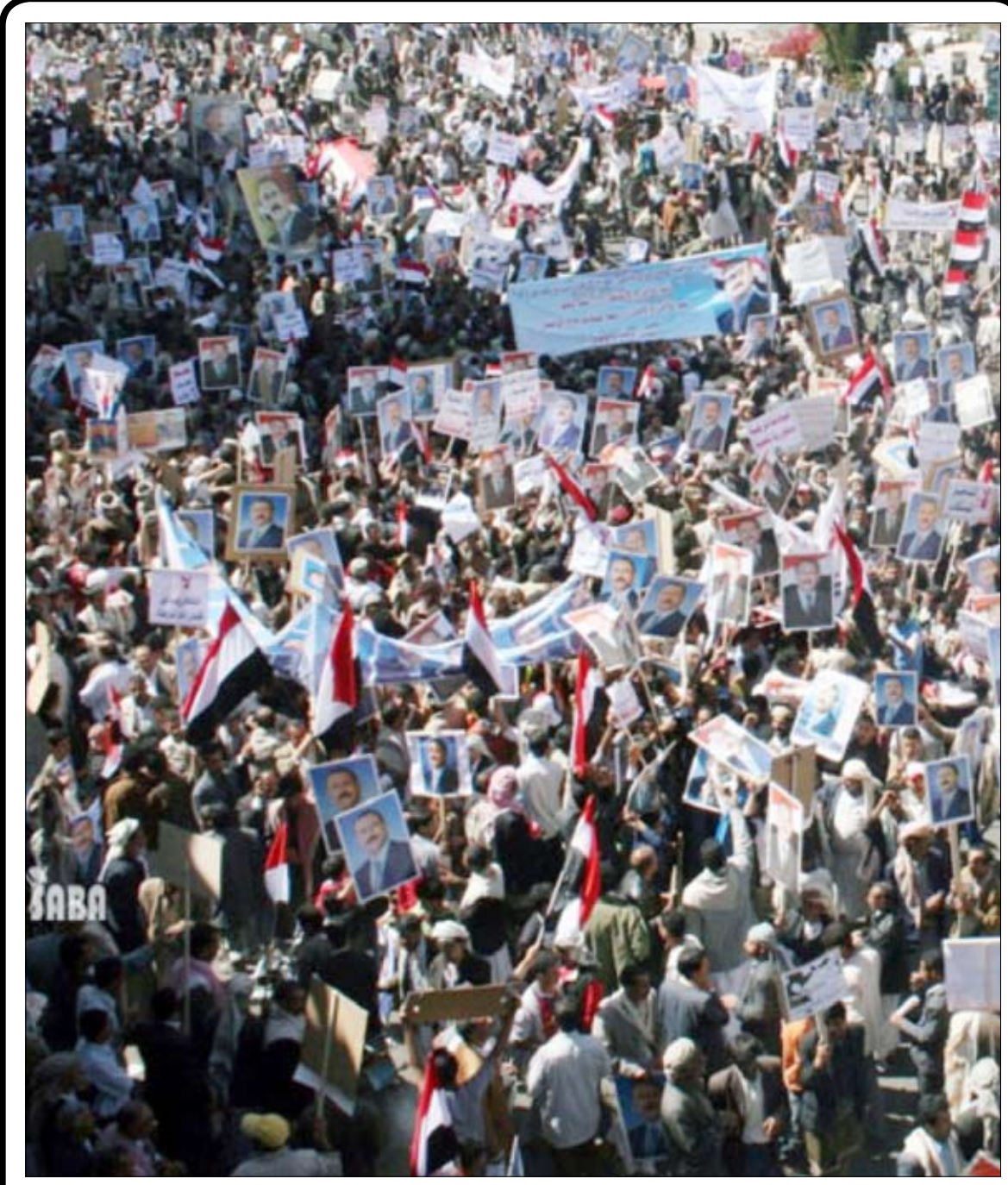
جانب من المشاركين في المهرجان الجماهيري بميدان التحرير أمس تأييداً لمبادرة رئيس الجمهورية