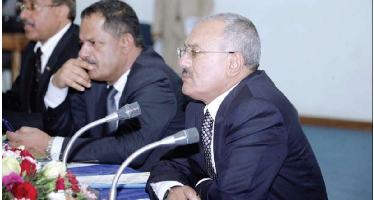
رئيس الجمهورية لدى لقائه أعضاء هيئة التدريس والطلاب والموظفين في جامعة صنعاء أمس

بالجوانب الاقتصادية والمشاريع الخاصة بالشباب واستغلال قدراتهم وتوفير فرص العمل لهم، وكذا ما تبصم بالخطوات التي سيتم اتخاذها لبدء الحوار مع الشباب من قبل اللجنة التي وجه فخامة الأخ الرئيس