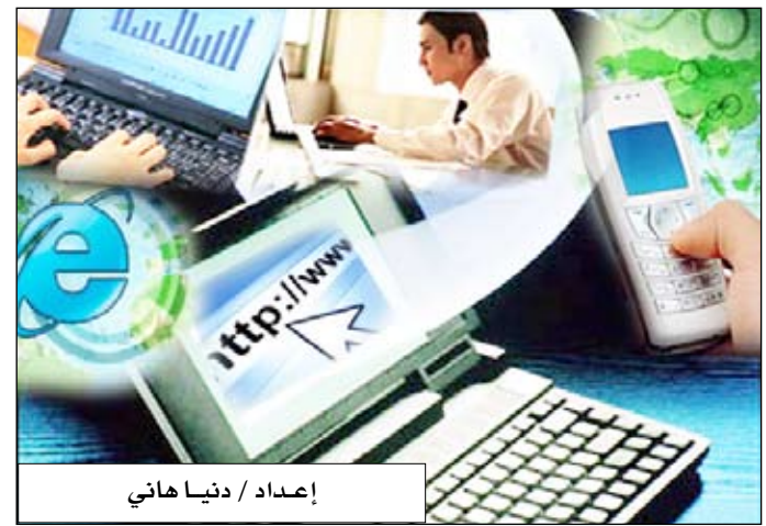
إعداد / دنيا هاني

ونقلت رويترز عن الدراسة قولها: إن الجريمة الرقمية أصبحت مشكلة متنامية ومشرقة على نطاق واسع، مشيرة إلى أن المحاولات الرامية إلى التعامل معها تواجه العقاب نتيجة الغياب الحقيقي للفهم والنظرة الثاقبة. وأوضحت الدراسة التي حملت اسم (تكلفة الجريمة الإلكترونية) أن الحكومة البريطانية خسرت نحو 2.2 مليار جنيه إسترليني وبلغت الخسائر بالنسبة للمواطنين البريطانيين نحو 3.1 مليار