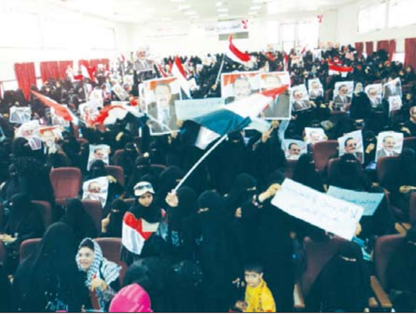
من فعاليات المهرجان النسائي الحاشد في إب الأسبوع الماضي

إب / سبأ، شهدت محافظة إب مساء مهرجاناً جماهيرياً حاشداً للنساء المحافظه نظمه القطاعات الجماهير النسوية وطلقت بالعديد من شوارع المدينة وهي تحمل لافتات تدعو إلى الأمن والاستقرار وللجوء إلى الحوار. وفي نهاية المسيرة صدر الأحراب إلى تبني قضايا المرأة بمصداقية وترك الاستغلال الحزبي والتوظيف الخاطن لقضاياها.