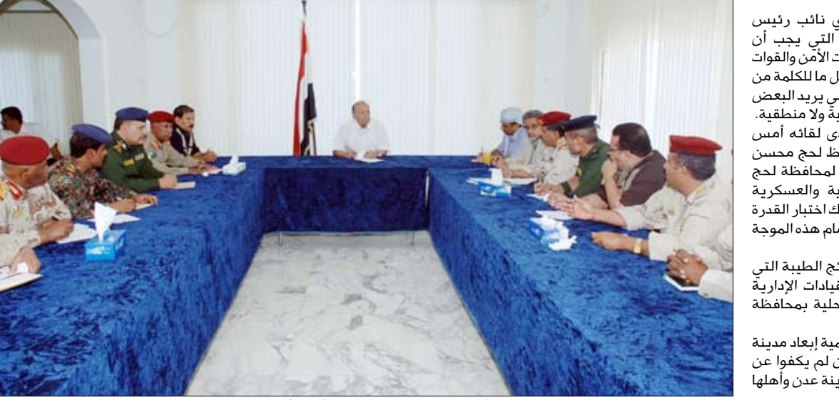
نائب الرئيس لدى لقائه محافظي لحج وأبين والقيادات العسكرية والأمنية أمس