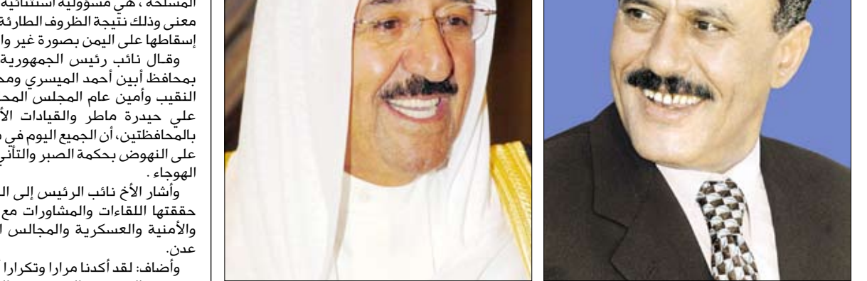
بعث فخامة الأخ الرئيس علي عبدالله صالح رئيس الجمهورية بترقية تهنئة أمس إلى صاحب السمو الشيخ صباح الأحمد الجابر الصباح أمير دولة الكويت بمناسبة احتفالات الشعب الكويتي الشقيق بالعيد الوطني.