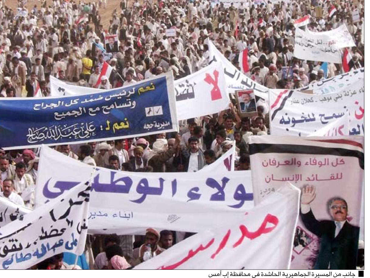
جانب من المسيرة الجماهيرية الحاشدة في محافظة إب أمس

عبدالله صالح رئيس الجمهورية الذي دعا إلى الحوار الوطني انطلاقاً من حرص فخامته على المصلحة الوطنية وترسيخ التجربة الديمقراطية التعددية التي ارسى مداميكها في الوطن. وأصدر المشاركون في المسيرة الجماهيرية باب بياناً باسم الشعب أكد تأييد مبادرة رئيس الجمهورية التي أعلنتها