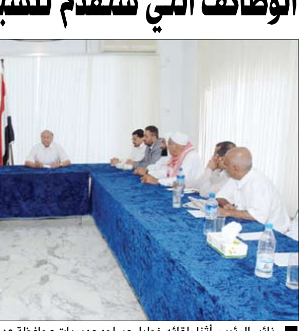
نائب الرئيس أثناء لقائه خطباء مساجد مديريات محافظة عدن أمس