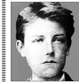
الشاعر الفرنسي آرثر رامبو

لقد تم العثور عليها! ماذا الأبدية. إنها البحر المتزج بالشمس. يا روجي الأزلية، عائني أميتك إنك تتحررين من الناس المؤيدين، من الحماسات المشتركة!