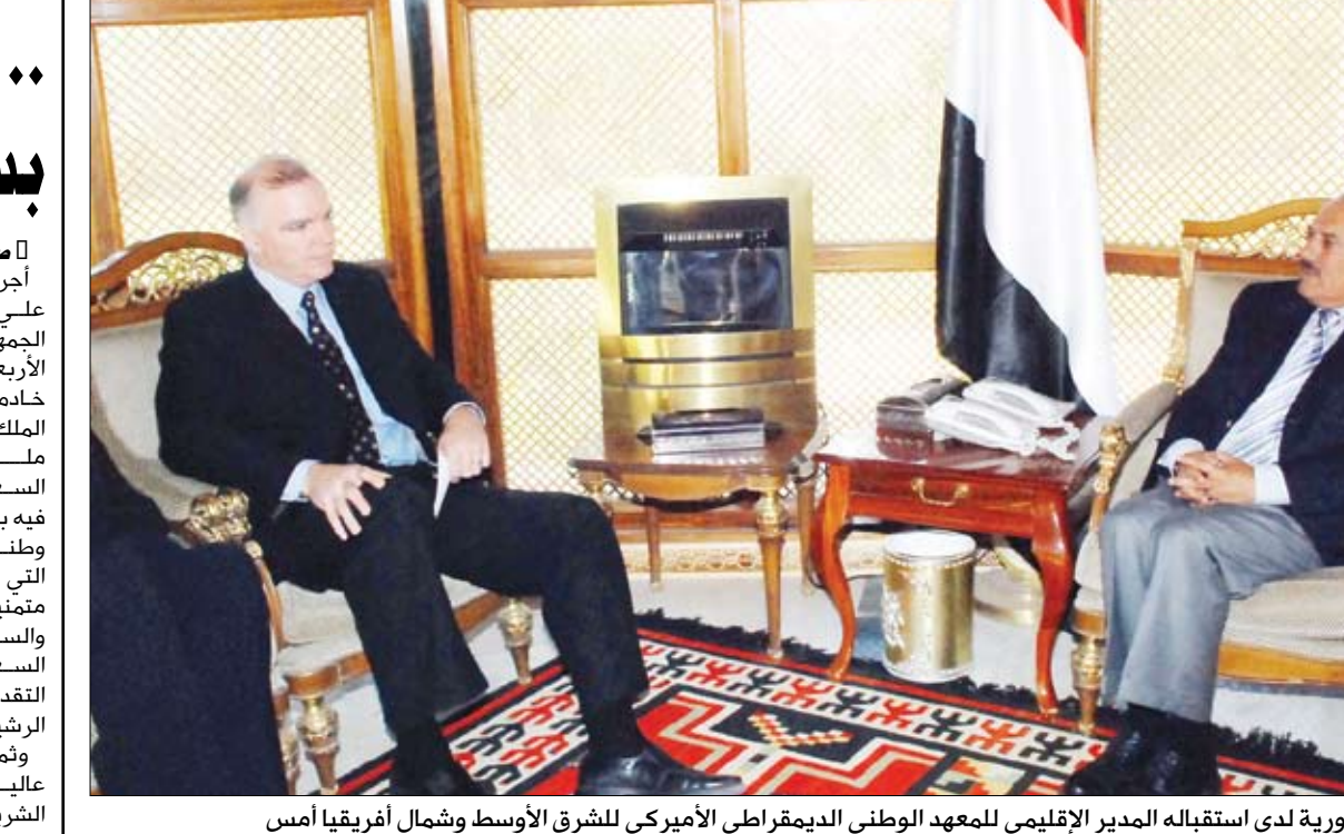
رئيس الجمهورية لدى استقباله المدير الإقليمي للمعهد الوطني الديمقراطي الأمريكي للشرق الأوسط وشمال أفريقيا أمس

صنعاء / سيا: استقبل فخامة الأخ الرئيس علي عبدالله صالح رئيس الجمهورية أمس المدير الإقليمي للمعهد الوطني الديمقراطي الأمريكي للشرق الأوسط وشمال أفريقيا ليس كامل. واطلع الأخ الرئيس على الجهود التي يقوم بها المعهد بدوره في دعم مسيرة الديمقراطية في اليمن . كما جرى الحديث حول الأوضاع الراهنة في المنطقة. وقد تطرق فخامة الأخ الرئيس إلى التجربة الديمقراطية في اليمن.. مؤكداً مجدداً تمسكه بالديمقراطية التعددية خيار حضاري لا حياء عنه.. مؤكداً أن حرية الرأي والتعبير مكفولة بطرق سلمية بعيداً عن أي أعمال شغب أو عنف أو صدامات . ودعا إلى إيقاف المسيرات والاعتصامات والحملات الإعلامية والمظاهرات المتبادلة . . بما يهيب المناخات إجراء الحوار الوطني . . بدءاً من لجنة الأربعة، والثلاثين، والمائتين، وتشكيل حكومة وحدة وطنية للإشراف على سير الانتخابات النيابية . . بما يكفل إجراها في مناخات حرة ونزيهة وشفافة وفي ظل رقابة محلية ودولية . كما أكد فخامة الأخ رئيس الجمهورية ما أعلنه سابقاً حول عدم ترشيح نفسه في الانتخابات الرئاسية عام 2013م.. مجدداً ما أعلنه في الاجتماع المشترك لمجلسي النواب والشورى بأنه لا تمديد ولا توريث ولا تجديد ، وأنه ملتزم وبحكم مسؤولياته كرئيس للجمهورية بالحفاظ على أمن واستقرار الوطن وسكينة المواطنين . وأشاد فخامة الأخ الرئيس خلال الاجتماع بدور المعهد الوطني الديمقراطي الأمريكي في دعم المسيرة الديمقراطية .