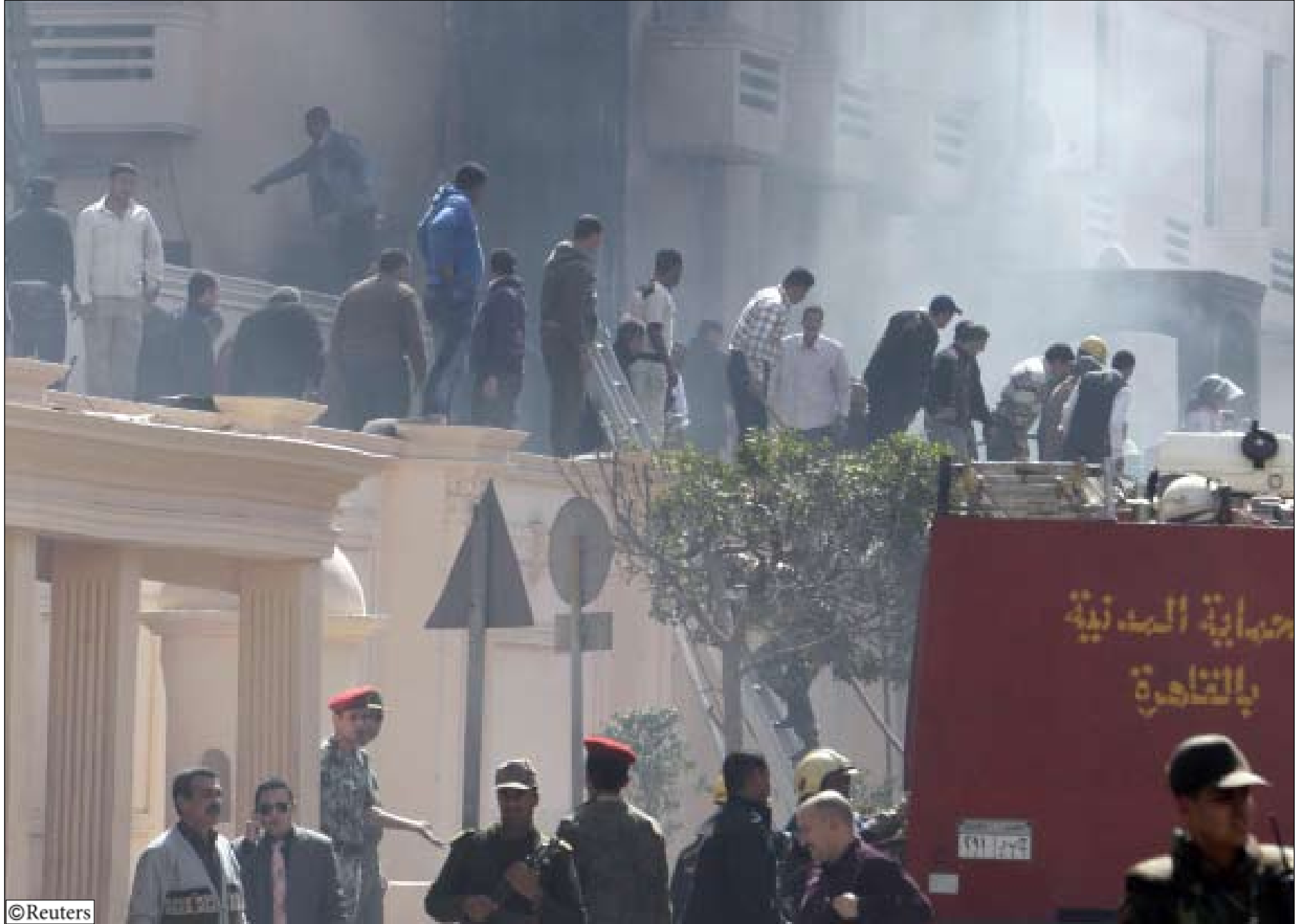
مديون ورجال شرطة أمام مبنى يحترق بجوار وزارة الداخلية المصرية في القاهرة أمس.

منذ نشر قوات الجيش في شوارع القاهرة في 28 يناير كانون الثاني. وقال شهود عيان للحريق ان ضباطا سابقين سكبوا الوقود على السيارات واشعلوا فيها النار. وهرعت أربع سيارات اطفاء وأربع سيارات اسعاف على الاقل الى مكان الحريق. ولم يتبين بعد ما اذا كان مشعلو الحريق قد فروا من المكان.