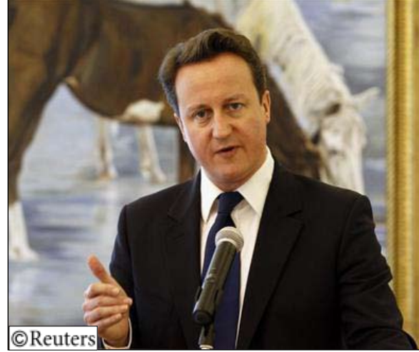
رئيس الوزراء البريطاني ديفيد كامبرون.

وقال كامبرون في مؤتمر صحفي في العاصمة القطرية الدوحة «أولويتنا الكبرى هي اخراج الرعايا البريطانيين». وفي يناير لم تحرز قوى العالم أي تقدم خلال يومين من المحادثات مع إيران في برنامجها النووي. وقال الاتحاد الاوروبي والولايات المتحدة ان المباحثات مخيبة للأمال ولم يتم الترتيب للمزيد من الاجتماعات. وقال كامبرون «ما زالت بريطانيا ملتزمة بالتحدث مع إيران.. لكننا سنستمر في ممارسة الضغط». وعرضت القوى العالمية الست -وهي الولايات المتحدة وفرنسا