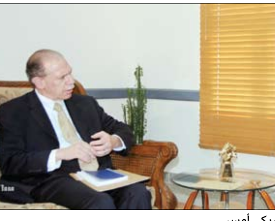
الأرجبي أثناء لقائه السفير الأمريكي أمس

صنعاء / سيا: التقى نائب رئيس الوزراء للشؤون الاقتصادية وزير التخطيط والتعاون الدولي عبدالكريم إسماعيل الأرجبي أمس السفير الأمريكي بصنعاء جيرالد فيرستين.