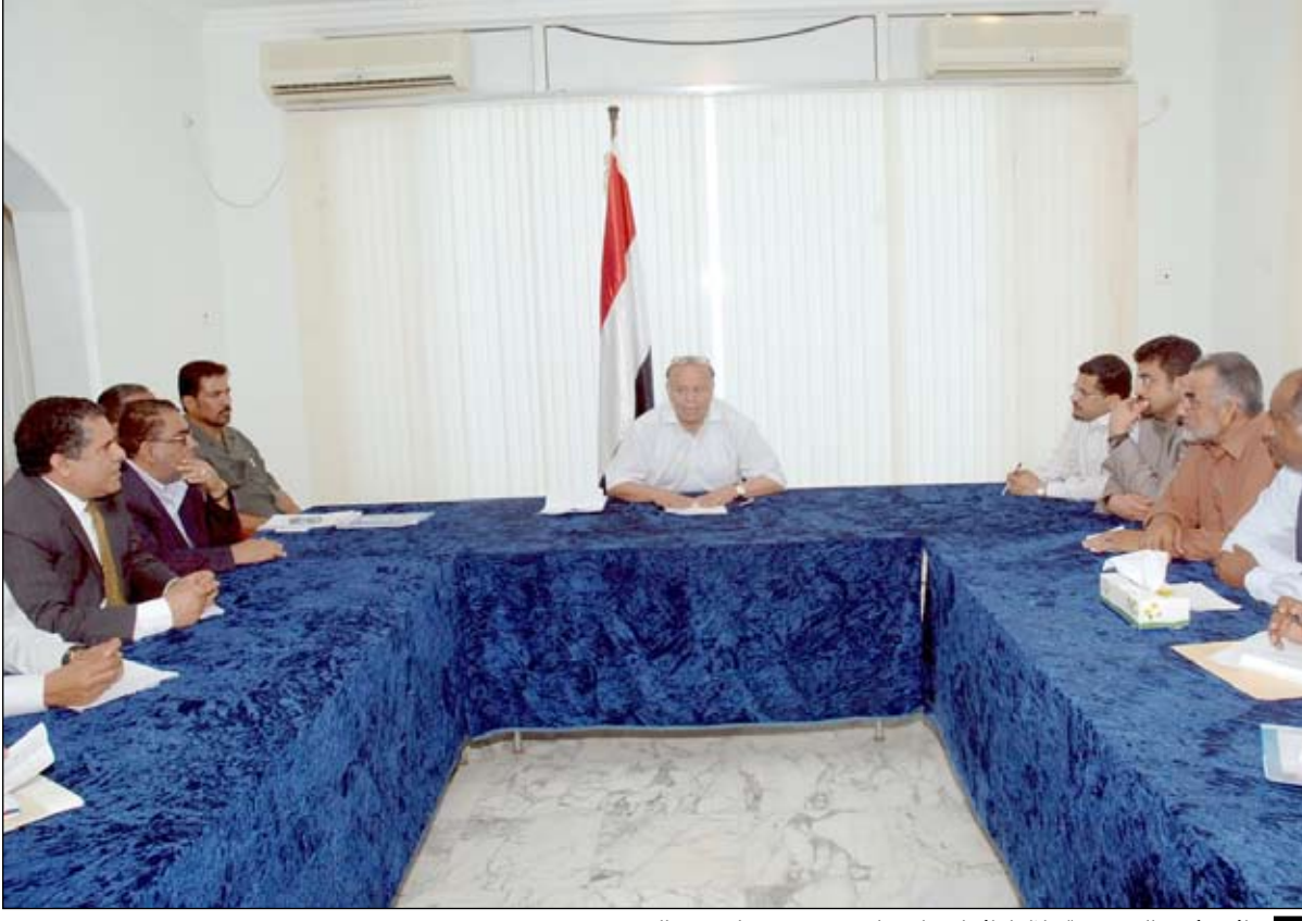
نائب رئيس الجمهورية خلال لقائه أعضاء مجلسي مديرتي دار سعد والمنصورة

وقال نائب رئيس الجمهورية «الجميع اليوم معنيون أكثر من أي وقت مضى بالحفاظ على عدن وبكل سماتها العظيمة والرائعة باعتبارها رمزا حضاريا ومعلما بارزا على المستوى الإقليمي وهي الاسم اللامع لليمن الكبير والموحد».