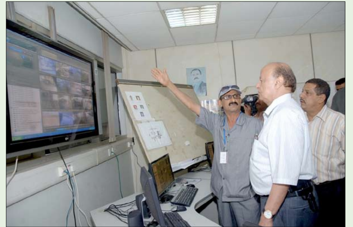
نائب الرئيس يتفقد مطار عدن الدولي والمنطقة الحرة