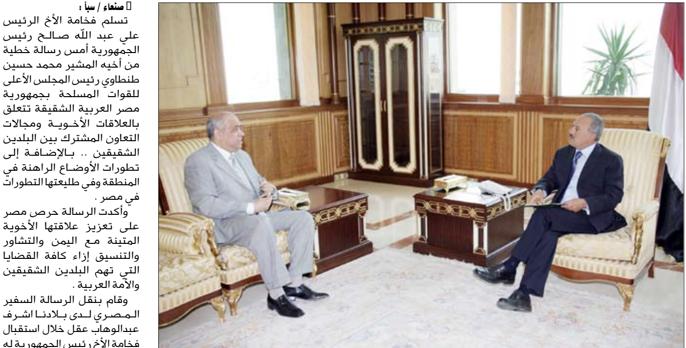
رئيس الجمهورية لدى استقباله السفير المصري أمس