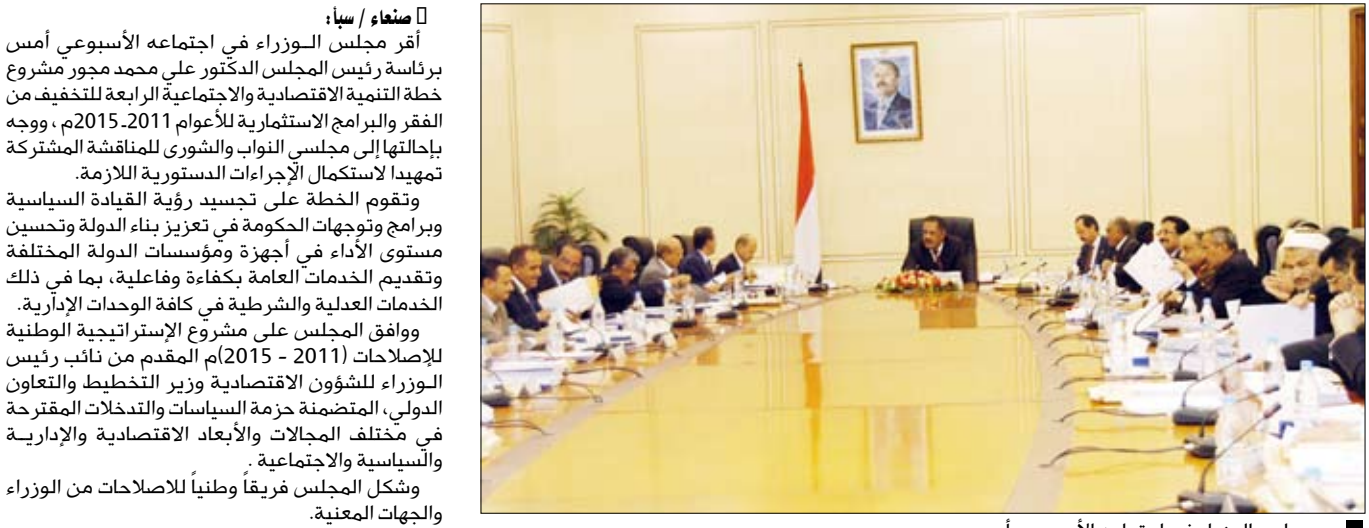
مجلس الوزراء في اجتماعه الأسبوعي أمس