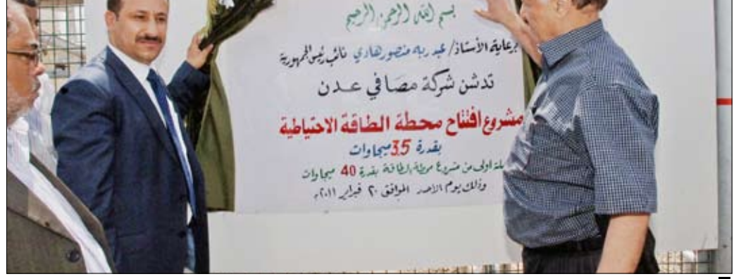
ويفتتح محطة الكهرباء الجديدة