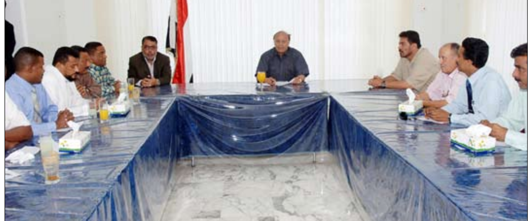
نائب رئيس الجمهورية لدى لقائه أعضاء المجلسين المحليين بمديرتي خور مكسر وصيرة أمس

صنعاء / سبأ : التقى الأخ عبدربه منصور هادي نائب رئيس الجمهورية أمس في إطار زيارته لمحافظه عدن بزيارة تفقدية لمصافي عدن، حيث أفتتح ووضع الحجر الأساس لمشروع جديدة. ووضع نائب رئيس الجمهورية لدى وصوله الحجر الأساس لمشروع مركز التدريب الإقليمي الذي سينتخصص في تنفيذ برامج التدريب المختلفة التي تشتمل على البرامج التدريبية الإلزامية لتطوير المهارات في الوظائف بحسب الخطة السنوية للمركز. كما تفقد الأخ نائب رئيس الجمهورية سير العمل الجاري في مشروع مبنى الإدارة العامة الرئيسية للمصافي حيث تجري أعمال التشييد بوتائر عالية وفقا للمخطط المرسوم. إلى ذلك دنش الأخ نائب رئيس الجمهورية العمل بمحطة الطاقة الكهربائية الجديدة والاحتياطية التي بدأت بإنتاج ثلاثة ونصف ميجاوات كمرحلة أولى تصل في نهاية إنجازها إلى أربعين ميجاوات مخصصة لخدمة تشغيل المصافي.