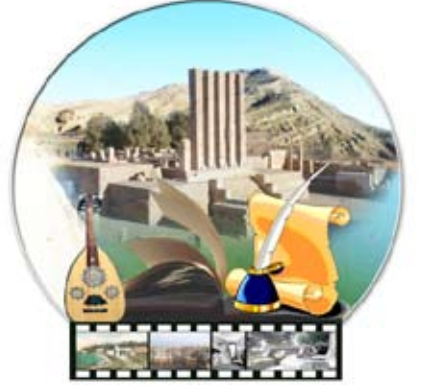
إشراف / فاطمة رشاد

تلقن متابعات، أعلنت الجائزة الأدبية الدولية لدول الكومنولث القائمة القصيرة للجائزة في مجالات: الرواية المفضلة والكتاب الأدبي الأول. وتضمنت القائمة القصيرة للجائزة في مجال أفضل رواية في جنوب آسيا وأوروبا، 5 روايات هي: (الشارع الغنائي) للكاتبة ليلا ابوليليا من بريطانيا، (الخيانة) لهان دانمور من بريطانيا، (الأف خريف ليجوكوب دي زويتا) للكاتبة ديفيد ميتشل من بريطانيا، (الأغنية الطويلة) لأندرا لوي من بريطانيا، (الجنسية وإسترافينسكي) لباربارا ترابينو من بريطانيا والأطلسي المتحد) لآدام هولست من بريطانيا. وفي مجال الكتاب الأدبي الأول تضمنت القائمة كلاً من: (الرجال الجادون) لمانو جوزيف من الهند، (حديقة ساراسواتي) لأنجالي جوزيف من الهند، (دار بالستائر