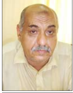
شعر: د. علوي عبدالله طاهر

الإهداء إلى اللجنة الرباعية للحوار الوطني التي دعاهم للانعقاد فخامة الأخ علي عبدالله صالح رئيس الجمهورية، لمناقشة مبادئه.