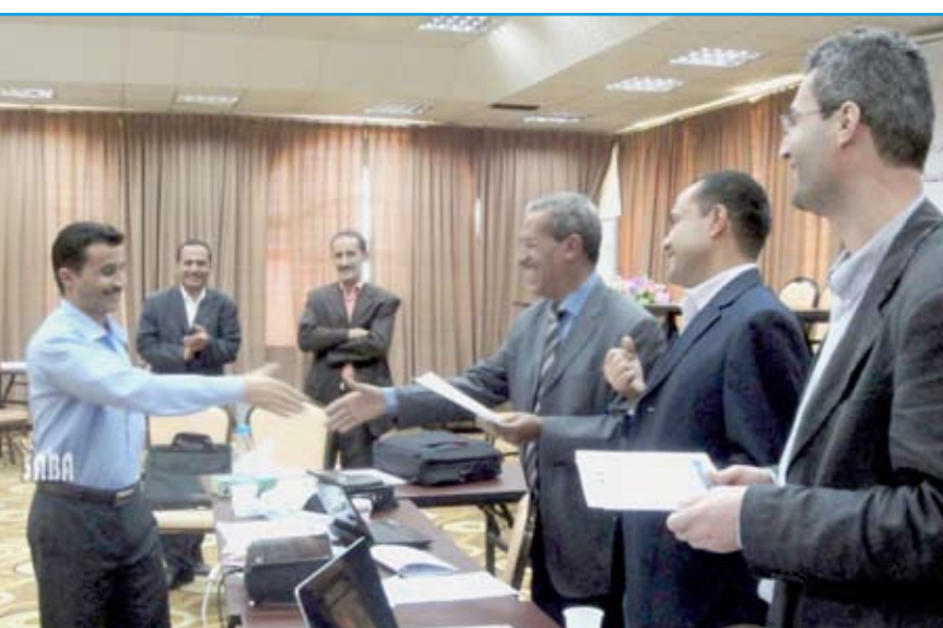
إلى صغاء/ 14 أكتوبر: