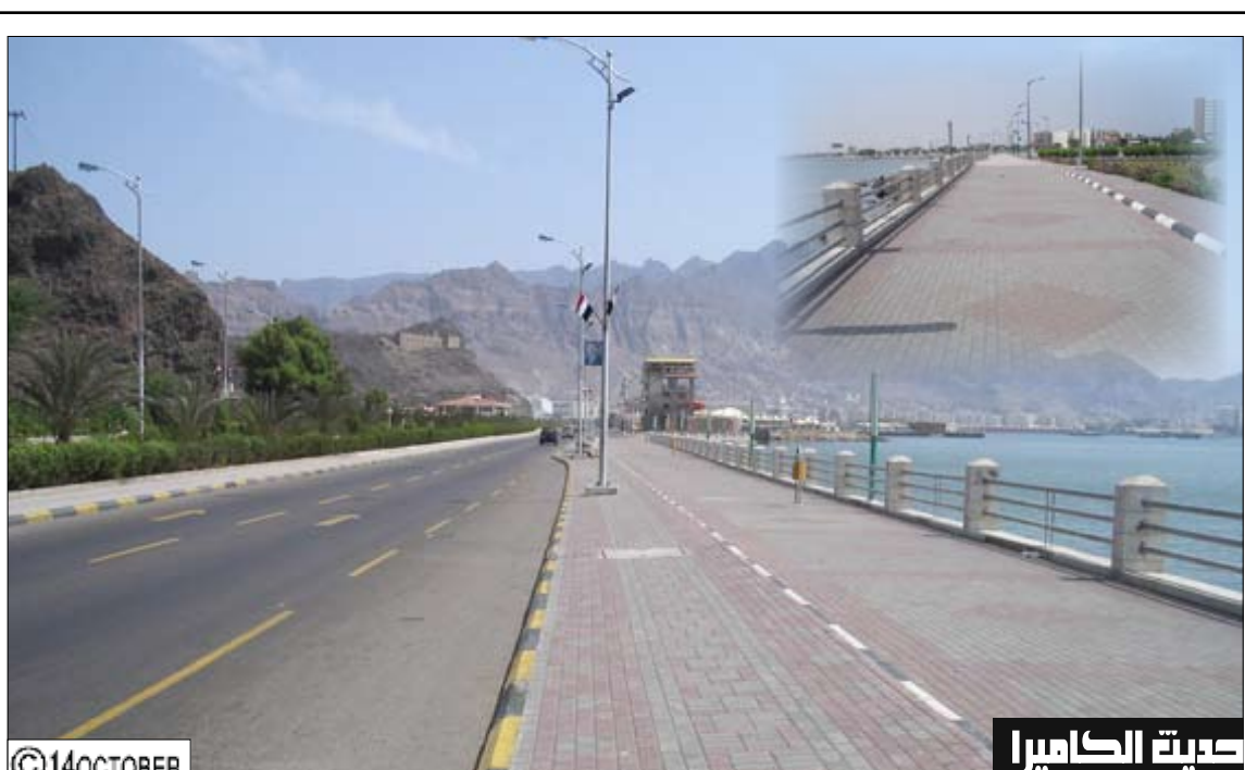
كعبة الكاميرا تصوير وتعليق / علي الدرب: تتمنى أن تقوم الجهات المختصة في محافظة عدن بعمل سياح يفصل كورنيش جبل حديد عن الطريق العام لحماية لمرتابه من مخاطر الخطر السريع الملاصق لهذا الموقع الذي يعتبر متنفساً مهماً عند السكان وزوار محافظة عدن.