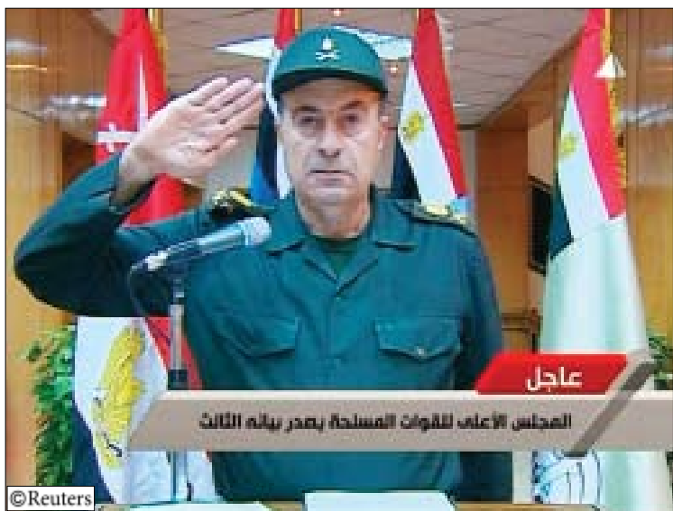
المتحدث باسم القوات المسلحة يلقي بياناً بعد التنحي