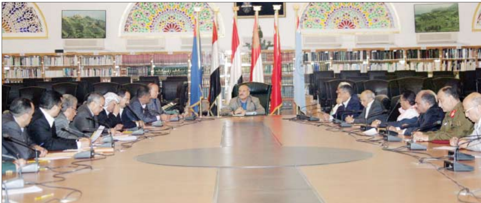
رئيس الجمهورية لدى ترؤسه اجتماع مجلس الدفاع الوطني والقيادات السياسية واللجنة الأمنية أمس

صنعا / سيا: ترأس فخامة الرئيس علي عبدالله صالح رئيس الجمهورية - القائد الأعلى للقوات المسلحة مساء أمس اجتماعاً موسعاً لمجلس الدفاع الوطني والقيادات السياسية واللجنة الأمنية العليا. وناقش الاجتماع العديد من القضايا المتعلقة بالجوانب الاقتصادية وجهود البناء والتحديث في قواتنا المسلحة والأمن بالإضافة إلى القضايا المتعلقة بتحسين الأجور لموظفي الجهاز الإداري للدولة ومنتسبي القوات المسلحة والأمن وترشيح الإنفاق وتنمية الإيرادات وزيادة الموارد. وأقر الاجتماع إطلاق العلاوات الخاصة بموظفي الجهاز الحكومي ومنتسبي القوات المسلحة والأمن، عقب تطبيق المرحلة الثالثة من إستراتيجية الأجور والمرتببات وبما يحسن الأوضاع المعيشية لموظفي الدولة في الجهاز المدني ومنتسبي القوات المسلحة والأمن. كما أقر الاجتماع اتخاذ كافة الإجراءات اللازمة لترشيح الإنفاق الحكومي وفي كافة المرافق ومنع شراء أي كماليات أو بناء أي مبان جديدة غير ضرورية، وإعطاء الأولوية لتشغيل المبانى والمرافق التي تم إنجازها سواء التابعة لوزارة التربية والتعليم أو التعليم العالي والبحث العلمي أو الصحة العامة