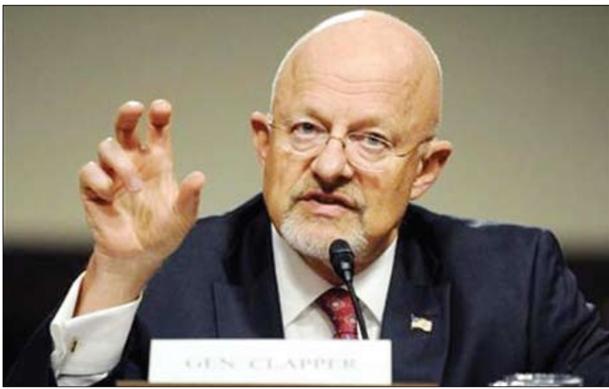
جيمس كلابر مدير المخابرات الوطنية الأمريكية في واشنطن

واشنطن / 14 أكتوبر / رويترز: قال أكبر مسؤول في المخابرات الأمريكية في الولايات المتحدة تواجه خفضاً في انفاق المخابرات رغم تهديدات تتراوح من القاعدة في اليمن والصومال