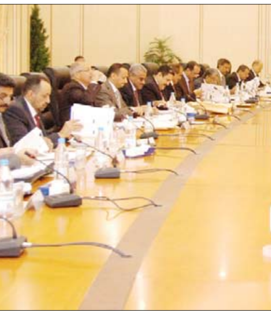
مجلس الوزراء في اجتماعه الأسبوعي أمس برئاسة د. علي محمد مجور

أقر مجلس الوزراء في اجتماعه الأسبوعي أمس برئاسة رئيس المجلس الدكتور علي محمد مجور جداول رواتب المرحلة الثالثة من الإستراتيجية الوطنية للأجور والمتراتب والزيادات العامة المترتبة على تطبيقها ابتداء من شهر فبراير الجاري. وأقر المجلس منح المتقاعدين في الهيئة العامة للتأمينات والمعاشات 50 بالمائة من الزيادات الممنوحة للموظفين على مستوى الدرجة المقابلة لدرجاتهم المسكنين عليها، وكذا منح المتقاعدين في صندوق تقاعد الدفاع والداخلية والأمن 50 بالمائة من الزيادات الممنوحة للموظفين على مستوى الرتبة. وأكد المجلس أن على كافة وحدات الخدمة العامة سرعة تنفيذ المهام المطلوبة منها بموجب تعميم وزارة الخدمة المدنية والتأمينات رقم 2 لسنة 2011م بشأن استكمال كافة المهام المتبقية من المرحلتين الأولى والثانية للإستراتيجية لضمان حصول موظفيها على الزيادات القانونية المستحقة عن الانتقال إلى جدول رواتب المرحلة الثالثة وعلى أن تتحمل وحدة الخدمة العامة المسؤولية القانونية لمسهح الاستحقاق لموظفيها وفقاً لأحكام هذا القرار وصحة وسلامة البيانات الوظيفية والمالية المعتمدة لتحديد الاستحقاق.