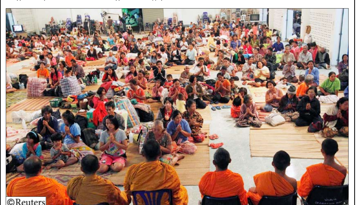
قرويون في أحد الملاجئ على الحدود الكمبودية التايلاندية

فيما يتحصن كل طرف في مواقع بعد أربعة أيام من الاشتباكات في المنطقة المتنازع عليها التي تبلغ مساحتها 4.6 كيلومتر مربع حول معبد برياه فيهيير. ويتبادل الجانبان الاتهام بالتسبب في الاشتباكات العنيفة التي أسفرت عن مقتل اثنين من التايلانديين على الأقل وثمانية كمبوديين أطلقت العنان للمشاعر القومية في بانكوك وأثارت حماس المحتجين (أصحاب القمصان الصفراء) المطالبين بتنحي الحكومة التايلاندية. من جانب آخر اتهمت الحكومة الكمبودية جنوداً من تايلاند بالتسبب في انهيار جزء من المعبد ولكن