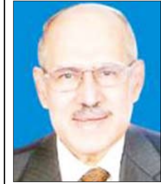
محمد جابر الأنصاري

شكّلت قضية «زواج المتعة» جدلاً عريضاً بين أهل السنة وإخواننا الشيعة، عبر التاريخ الإسلامي حتى اليوم، واحتلت حيزاً واسعاً في التفكير الإسلامي وعبر كتب الفقه والحديث والتفسير، وما من فقيه أو محدث أو مفسر إلا انشغل به -مؤيداً أو معارضاً- تبعاً لمذهبه الفقهي. وإذا كانت قضية «الإمامة» واستحقاقها، أكبر قضية خلافية بين السنة والشيعة من الناحية العقيدية والسياسية، فإن «زواج المتعة» أكبر قضية خلافية بينهما من الناحية الفقهية.