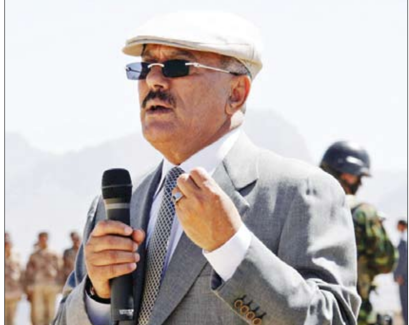
رئيس الجمهورية يلقي كلمته أثناء زيارته لمعسكري اللواء أول وثاني مشاة جبلي أمس