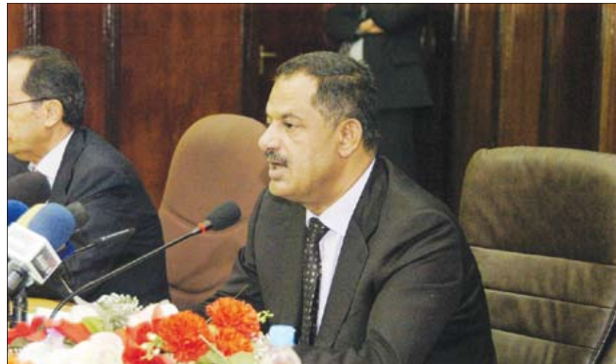
د. مجور يلقي كلمة في اللقاء التشاوري أمس

صنعا / سيا: أكد رئيس مجلس الوزراء الدكتور علي محمد مجور حرص الحكومة على إعداد خطة خمسية تمثل الإطار المنطقي الشامل لأهداف التنمية بأبعادها الاقتصادية والاجتماعية وتضمن بلوغ الأهداف والبرامج والمشروعات الاستثمارية اللازمة لزيادة الطاقات الإنتاجية وتوفير المرافق العامة والخدمات الاجتماعية المختلفة. وأشار الدكتور مجور في اللقاء التشاوري الذي نظمه بصنعا أمس وزارة التخطيط والتعاون الدولي بمشاركة المجالس المحلية للمحافظات والقطاع الخاص ومنظمات المجتمع المدني حول مشروع مسودة الخطة الخمسية للتنمية الاقتصادية والاجتماعية الرابعة للتخفيف من الفقر 2011 - 2015م، إلى "أن بلوغ الأهداف المرسومة في الخطة يقتضي الالتزام برؤية واضحة المعالم للأولويات التنموية وإطار متناسق للسياسات العامة يعمل على تخصيص الأمثل للاستثمارات وبصفة خاصة الاستثمارات الحكومية التي تتطلب ضرورة مراعاة بعدين أساسيين عند توزيعها الأول يعبر عن البعد القطاعي لتوزيع الاستثمارات الحكومية وضرورة إيلاء القطاعات ذات العلاقة بتحقيق أهداف التنمية الألفية النصيب الأوفر من الاستثمارات الحكومية كون هذه القطاعات على ارتباط وثيق بتحسين مستوى المعيشة للمواطن والتخفيف من حدة الفقر في المجتمع، فيما يعبر الثاني عن التوازن الإقليمي لتوزيع الاستثمارات على مختلف المحافظات والمديريات مع ضرورة أن تحظى المناطق المحرومة والمناطق الريفية بأولوية".