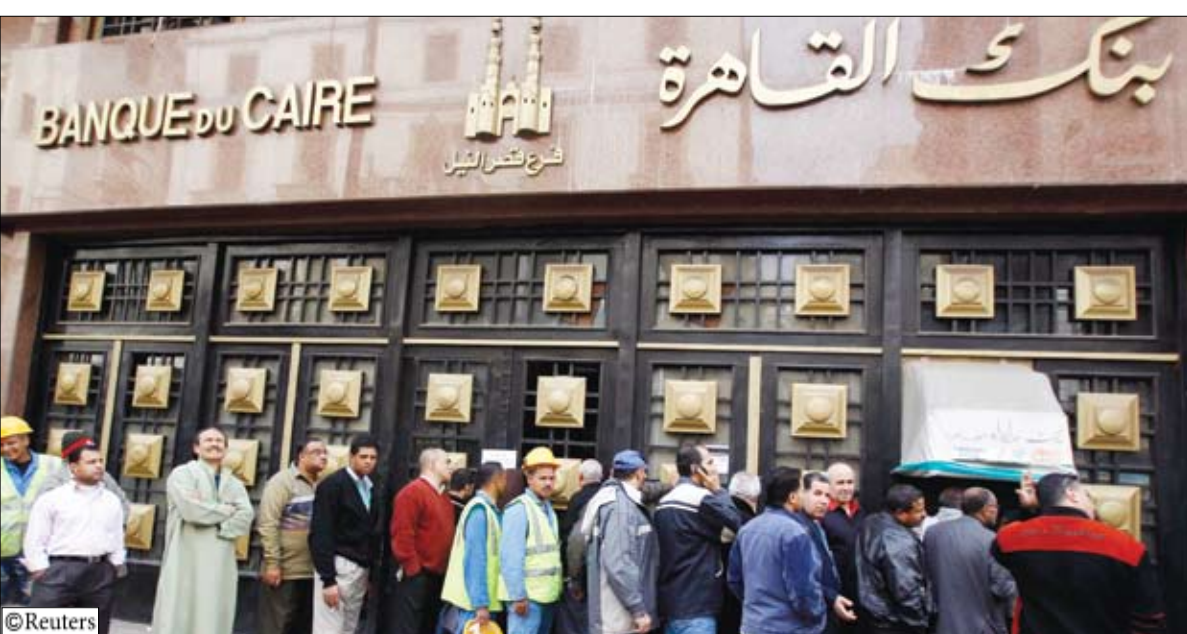
جانب من عودة الحياة في العاصمة المصرية