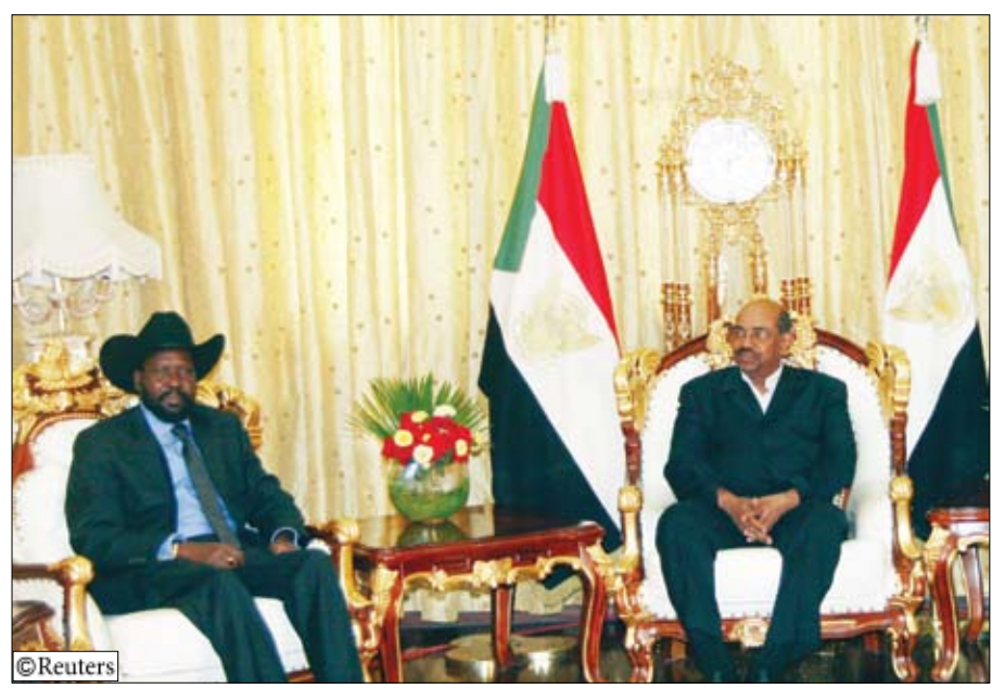
البشير في اجتماع مع جرانغ

الخرطوم/ 14 أكتوبر/ رويترز: أصدر الرئيس السوداني عمر حسن البشير مرسوماً يوم أمس الاثنين قبل فيه رسمياً نتيجة الاستفتاء الذي أجراه جنوب السودان على الانفصال. وكان البشير قال في وقت سابق إنه سيقبل بنتيجة الاستفتاء قبل ساعات من إعلان النتائج النهائية. وكان الاستفتاء الذي أجري في التاسع من يناير كانون الثاني توجها لمعاهدة سلام بين الشمال والجنوب وقعت عام 2005 لإنهاء الحرب الأهلية التي زعزت استقرار المنطقة عشرات السنين. ومن المتوقع أن تؤكد النتائج النهائية موافقة 99 في المئة من أهالي الجنوب على الانفصال عن الشمال. وقال البشير أمام أنصاره في الخرطوم «اليوم سنعلن أمام العالم كله قبولنا واحترامنا لخيار أهل الجنوب».