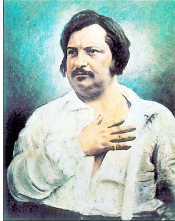
المسرح) إن هؤلاء النساء لا يدمرن إلا الأغنياء).

(بريدو) في أسرة مكونة من الأم (أغات) ومن فيليب وجوزيف فالام (أغات) كانت العقدة المهيمنة على حياتها عقدة فقدان المال والثروة رغم العاطفة البينية التي كانت تدعي أنها تدفعها إلى نقد الأشياء المخالفة للدين إذ كانت ترى أن نساء المسرح مثل جمرات جهنم فهي تكرههن لهذا السبب الديني إلا أن الحقيقة أنها تكرههن لسبب آخر خفي في لا شعورها العميق وهو أنها تعتقد أن هؤلاء النسوة يأكلن الذهب ويشربن اللؤلؤ ويدمرن أكبر الثروات (ص 63) وهي محرومة بالطبع من كل ذلك. وتظل المشكلة المادية هي المسيطرة على الأذهان، وهي سبب المأساة لدى الصغار والكبار. إذ أننا نلاحظ جوزيف يقول لأمه: (هل تعتقدن أن الحمق يبلغ من أحي حدا يعطي فيه نقداً) (راقصة