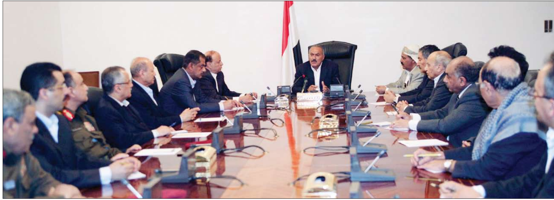
رئيس الجمهورية أثناء ترؤسه اجتماع مجلس الدفاع الوطني أمس

صنعاء / سياء: عقد مجلس الدفاع الوطني اجتماعاً له مساء أمس برئاسة فخامة الأخ علي عبدالله صالح رئيس الجمهورية - القائد الأعلى للقوات المسلحة . وبعد أن استعرض المجلس محضر اجتماعه السابق وصادق عليه، ناقش المواضيع المدرجة في جدول أعماله وفي مقدمتها المستجدات على الساحة الوطنية وعدد من التقارير الأمنية والعسكرية.