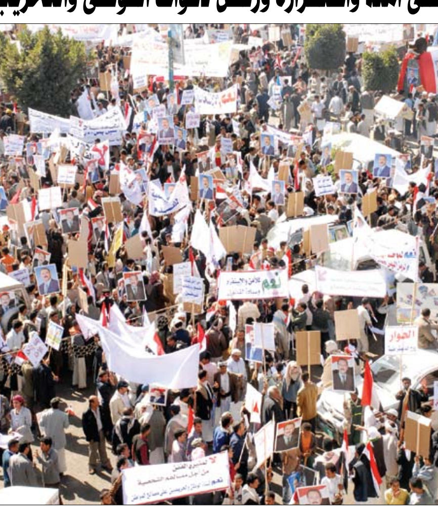
جانب من المسيرات الجماهيرية الحاشدة أمس

صنعاء / سياء: شهدت العاصمة صنعاء وبعض محافظات الجمهورية يوم أمس الخميس مسيرات جماهيرية حاشدة لحزب المؤتمر الشعبي العام وأحزاب التحالف الوطني "مؤيدة" وأخرى لأحزاب اللقاء المشترك "معارضة" شارك فيها مئات الآلاف من منظمات المجتمع المدني والنقابات والشخصيات الاجتماعية والمرأة، التي شاركت بفعالية في مسيرات عبرت فيها عن رأيها وموقفها.. وذلك في إطار الرأي والرأي الآخر والنهج الديمقراطي الذي تنتهجه اليمن.