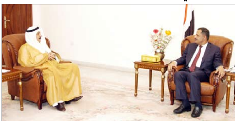
ولدى لقائه سفير المملكة العربية السعودية أمس