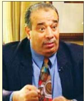
بمقام الشيخ الدكتور/ أحمد صبحي منصور