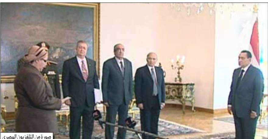
الحكومة المصرية الجديدة تؤدي اليمين الدستورية أمام مبارك أمس

ولوحظ غياب الوزراء من رجال الأعمال البارزين كوزراء التجارة والزراعة والإسكان والصحة والسياحة، إضافة إلى وزير المالية المقرب من صندوق النقد الدولي. وذكر التلفزيون المصري أنه سيتم لاحقاً تعيين وزير للتربية والتعليم ووزير للسياحة، وإضافة إلى رئيس الوزراء أحمد شفيق، انضم إلى الحكومة الجديدة 14 وزيراً جديداً هم: يحيى عبد المجيد مصطفى وزير دولة لشؤون مجلس الشورى، عبد الله الحسيني أحمد هلال وزيراً للأوقاف، زاهي حواس وزير دولة للأمار، محمود وجدي وزيراً للدخالية، سميرة سيد فوزي إبراهيم وزيرة للتجارة والصناعة، سمير رضوان وزيراً للمالية، إبراهيم أحمد مناع وزيراً للطيران المدني، جابر عصفور وزيراً للثقافة، أحمد سامح حسين فريد وزيراً للصحة، أيمن فريد أبو حديد وزيراً للزراعة واستصلاح الأراضي، محسن النعماني محمد حافظ وزير دولة للتنمية المحلية، عاصف مصطفى وزيراً للنقل، فتيحي عبد العزيز البرادعي وزير الإسكان والمرافق والتنمية العمرانية، حسين إحسان العلفي وزير الموارد المائية والري.