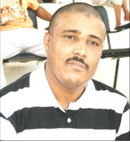
توفيق صالح سارية

الوطني لشباب الوحدة تأهيل مكتبة « القمندان » الوطنية العامة بمدينة الحوطة عاصمة محافظة لحج تأهلاً كاملاً بالأثاث وأجهزة الكمبيوتر والمعامل والكتب الثقافية الشاملة.