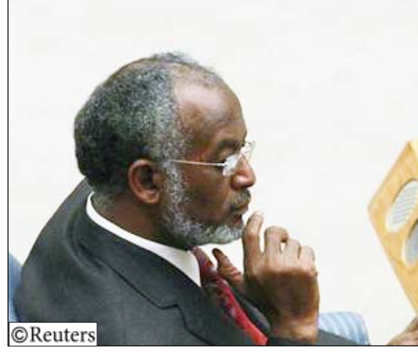
وزير الخارجية السوداني علي كرتي

دارفور حيث يندلع العنف. وقال وزير الخارجية السوداني علي كرتي لرويترز على هامش قمة للاتحاد الأفريقي في أثيوبيا أن الخرطوم وقت بما وعدت وهي تطالب الان برفع كل العقوبات. وطالب كرتي بعدم ربط دارفور بهذا الامر وقال ان الخرطوم تتعاون بشكل كامل لحل القضية. وعبر كرتي عن أمله في ان يوفر الاجراء السلمي للاستفتاء فرصا اقتصادية لبلاده التي تعرضت طويلا للعقوبات. وقال لرويترز ان السودان يريد استثمارات أكبر وتعزيز التجارة وتعزيز التعاون في كل المجالات.