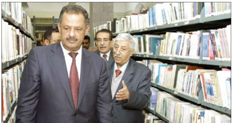
رئيس الوزراء لدى تفقده مركز الدراسات والبحوث اليمني بصنعاء