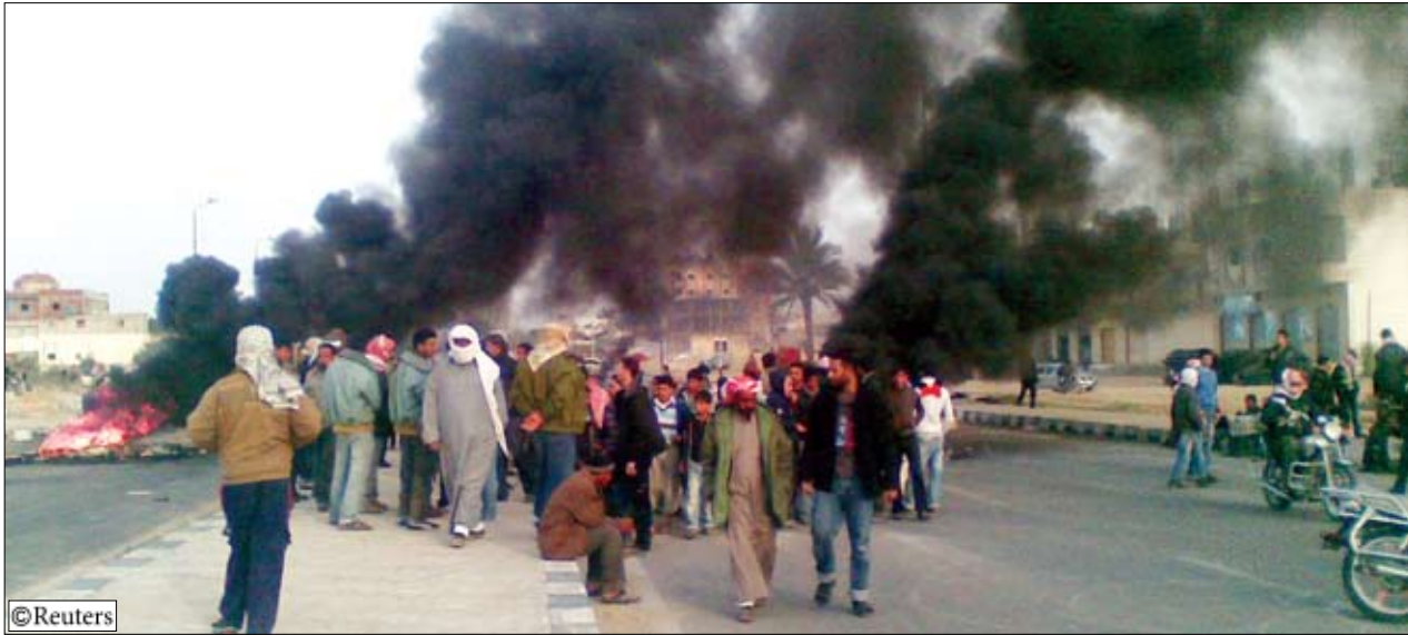
أعمال نهب وتخريب في مصر أمس