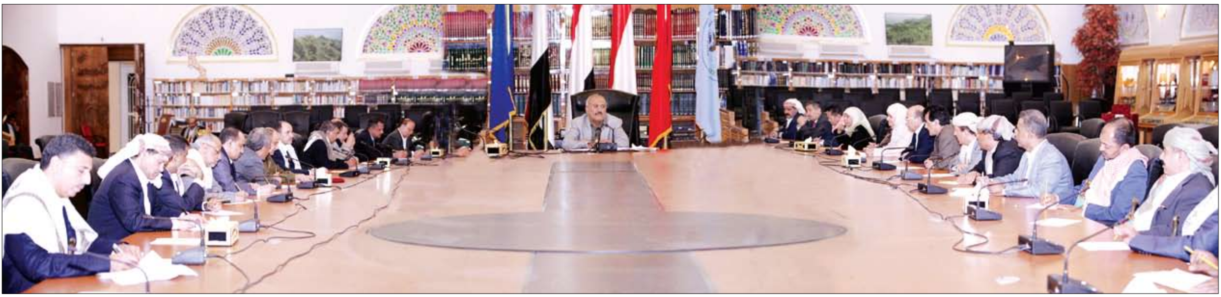
رئيس الجمهورية لدى ترؤسه اجتماع اللجنة العامة للمؤتمر الشعبي العام أمس

مدسوسة او متطرفة لانحراف بها نحو ما يضر بالوطن وأمنه واستقرار ومصالحه العليا. ووقفت اللجنة العامة أمام العديد من القضايا المتصلة بالحوار الاقتصادي والجهود المبذولة من الحكومة لمكافحة البطالة، وبخاصة في أوساط الشباب وخريجي الجامعات، وتوسيع شبكة الضمان الاجتماعي لتنفيذ الأجنحة الوطنية للإصلاحات. ووجهت الحكومة باتخاذ التدابير اللازمة بهذا الشأن وبما يخدم أهداف البناء والتنمية.