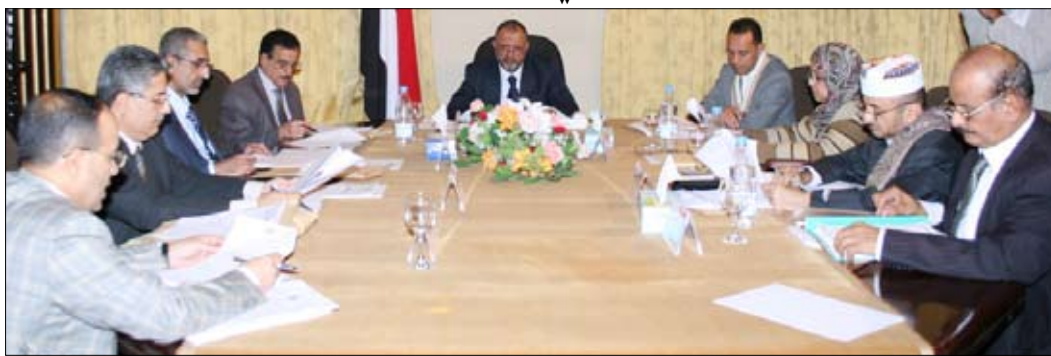
اللجنة العليا للانتخابات والاستفتاء في اجتماعها أمس

صنعاء / سيا: كلفت اللجنة العليا للانتخابات والاستفتاء في اجتماعها أمس برئاسة رئيس اللجنة القاضي محمد حسين الحكيمي القطاع الفني بإعداد تصور بالخيارات والبدائل المتاحة لتشكيل اللجان الانتخابية وذلك في إطار الصلاحيات الدستورية والقانونية المخولة للجنة في الإدارة والإشراف على عملية الانتخابات بما فيها تشكيل اللجان الانتخابية. وكانت اللجنة قد اطلعت على التقرير المقدم من رئيس قطاع شؤون الأحزاب ومنظمات المجتمع المدني بشأن نتائج مباحثات الأحزاب والتنظيمات السياسية