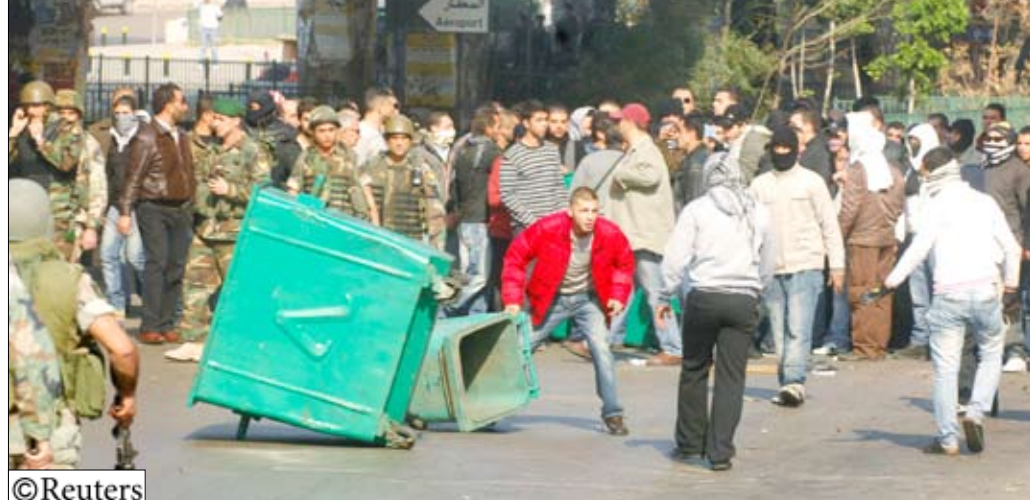
جانب من المظاهرات في لبنان أمس

وقال ميقاتي للصحافيين في القصر الرئاسي إنه سيسعى لتشكيل حكومة تحفظ وحدة اللبنانيين ووحدة بلدهم وسيادته وتحمي التعايش المشترك على حد قوله.