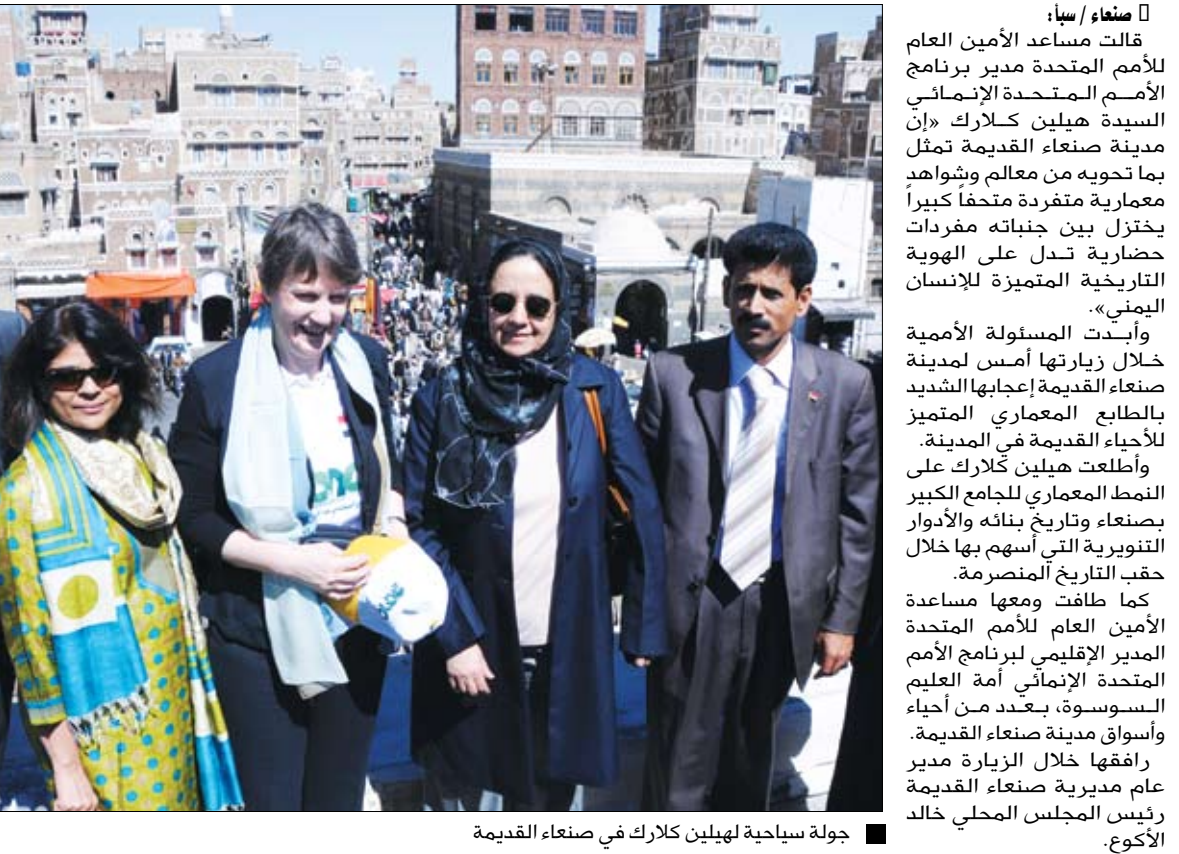
جولة سياحية لهيلين كلارك في صنعاء القديمة