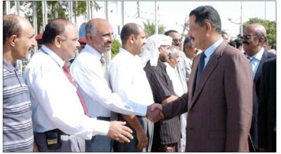
رئيس الوزراء لدى وصوله حضرموت