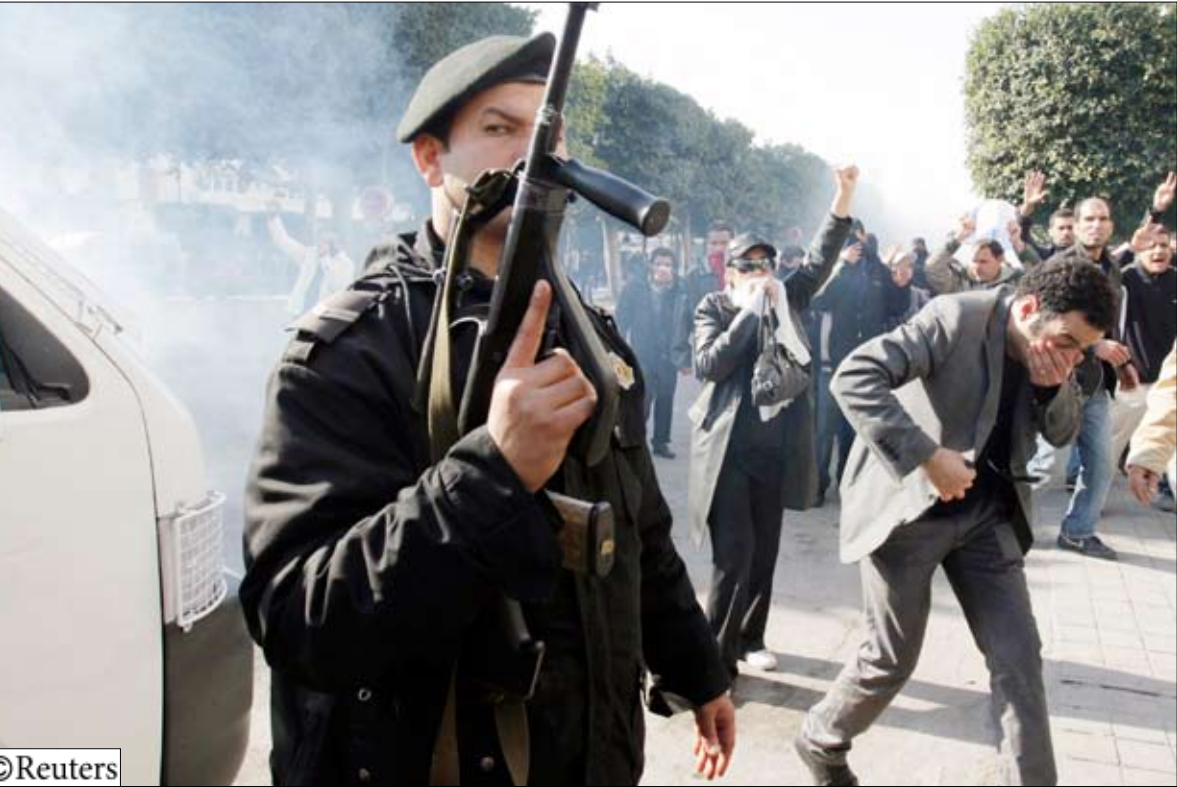
الجيش يفرق مظاهرة احتجاجية في تونس أمس