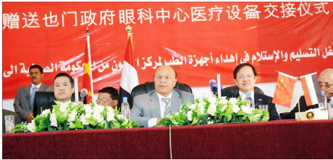
نائب الرئيس لدى حضوره حفل تدهيش وافتتاح المشاريع والأقسام والمراكز الصحية التخصصية الجديدة بالمستشفى الجمهوري

صنعاء/ سبأ: حضر الأخ عبديبه منصور هادي نائب رئيس الجمهورية أمس حفل تدهيش وافتتاح المشاريع والأقسام والمراكز الصحية التخصصية الجديدة بهيئة المستشفى الجمهوري التعليمي بصنعاء، والمتمثلة بمركز طب وجراحة العيون ومركز جراحة الأسنان ووحدة تفتيت حصوات الكلى بالموجات التصادمية ووحدة مناظير المسالك البولية والمختبر العام وقسم الطوارئ العامة والمركز الوطني لمكافحة الإيدز . وبلغت الكلفة الإجمالية لهذه المراكز مليارا ومائة مليون ريال بتمويل من البرنامج الاستثماري لأمانة العاصمة .