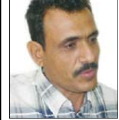
فضل علي مبارك

قرأت إعلاناً في إحدى الصحف اليومية الأهلية كان بالنسبة لي وكثيرين تواصلوا معي بمثابة كارثة. كارثة حقيقية ضربت بالقيم الإنسانية والكرامة البشرية والتشريف الذي خص به الله سبحانه وتعالى بني آدم عرض الحائط وألقت بظلال قاتمة على علاقة الإنسان بأخيه الإنسان. قال تعالى: "وجعلناكم شعوباً وقبائل لتعارفوا إن أكرمكم عند الله اتقاكم". ولم يقل المولى عز وجل إن "القبيلي" أو "السيد" في مرتبة أعلى وأن "العبد" و"الخزاز" في مرتبة أدنى. وقال الرسول صلى الله عليه وسلم: "لا فضل لعربي على أعجمي إلا بالتقوى". وجوهر القول، إن فدوى الإعلان جاءت على صيغة اعتذار مدفوع تقدمت به إحدى "الفئات" الإنسانية، تسكن إحدى مناطق يافع للاعتذار من فئة أخرى وتعتبر أحق الأخرى.