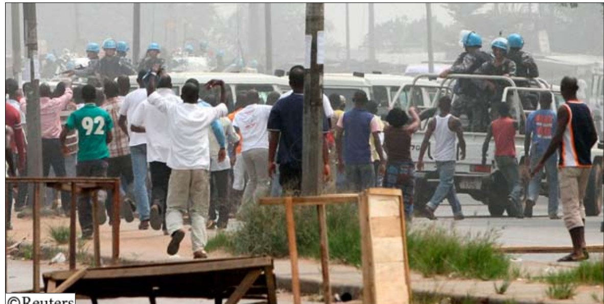
أنصار جبابجو يوقفون دورية الأمم المتحدة باستخدام متراس في الطريق في ضاحية ابوبو

□ الأمم المتحدة / أبيدجان / أكتوبر / رويترز : أكدت منظمة الأمم المتحدة أمس أن قوات جبابجو بدأت تهاجم وتحرق عربات تابعة للمنظمة الدولية في أبيدجان. وأوضح المتحدث مارتن نيسيركي في بيان أن الأمين العام (بان جي مون) يشعر بقلق بالغ لقيام قوات نظامية وغير نظامية مواتية للسيد (لوران) جبابجو بمهاجمة وإحراق عربات الأمم المتحدة. إلى ذلك أكدت قوات مواتية لزعيم ساحل العاج لوران جبابجو يوم أمس أنها حوالت مكثراً استنبتت فيه مع أنصار منافسه على الرئاسة الحسن واتارا في أبيدجان وإنها منعت قوات حفظ السلام التابعة للأمم المتحدة من دخولها.