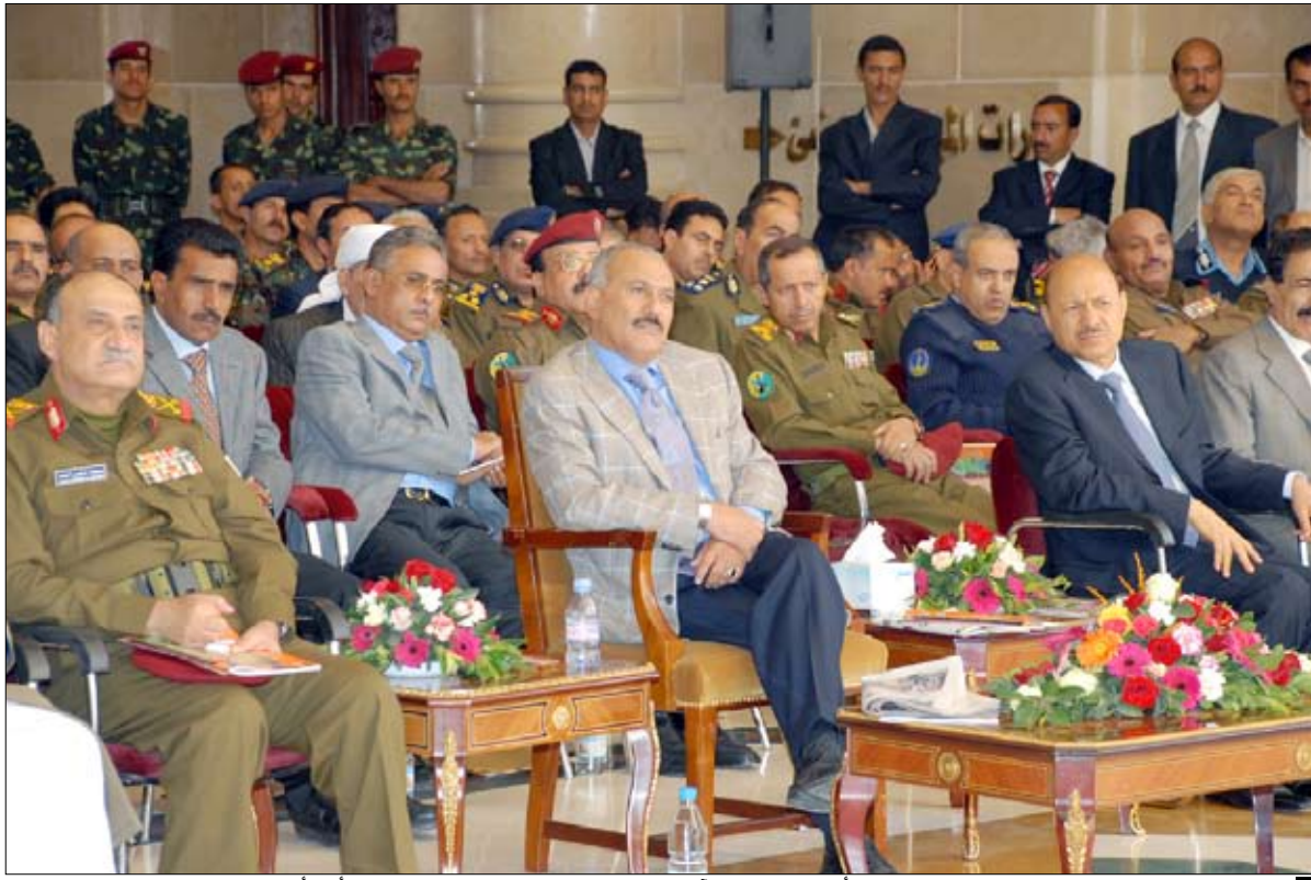
رئيس الجمهورية لدى حضوره حفل تخرج الدفعة الأولى لحفاظ القرآن الكريم من منتسبي القوات المسلحة والأمن أمس

□ صنعاء / متابعة : أمس أن المؤتمر حريص كل الحرص على التمسك بالاستحقاقات الدستورية، ويوجد الدعوة لكافة القوى الوطنية، ومن بينها أحزاب اللقاء المشترك للمشاركة في مناقشة مشروع التعديلات الدستورية وإبداء آرائها بشأنها، والانخراط في الخطوات والاستعدادات الجارية لإجراء الانتخابات العامة في أبريل القادم. وأوضحت مصادر في المؤتمر الشعبي لصحيفة ( 26 سبتمبر ) في عددها الصادر بالحوار الوطني قبل وبعد الانتخابات.