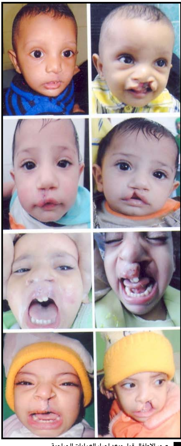
صور الاطفال قبل وبعد اجراء العمليات الجراحية