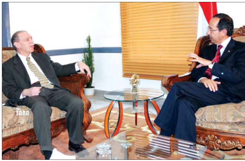
الأرحبي لدى لقائه السفير الأمريكي أمس

التقى نائب رئيس الوزراء للشؤون الاقتصادية وزير التخطيط والتعاون الدولي عبد الكريم إسماعيل الأرحبي أمس السفير الأمريكي بصنعاء جيرالد فيرستايين. وجرى في اللقاء استعراض أوجه التعاون القائم بين اليمن والولايات المتحدة وسبل تعزيزه وتطويره بما يخدم المصالح المشتركة . وتطرق الجانبان إلى جملة من القضايا محل الاهتمام المشترك وبخاصة ما يتعلق بتعزيز أطر التعاون القائم بين اليمن والولايات المتحدة في ظل توجهات البلدين لتوسيع مجالات التعاون والشراكة الثنائية . وأشاد نائب رئيس الوزراء للشؤون الاقتصادية بمستوى التعاون القائم بين اليمن والولايات المتحدة .. ثمنا مبادرة واشنطن مؤخرا برفع سقف الدعم التنموي المقدم لليمن. من جانبه أكد السفير الأمريكي حرص حكومة بلاده على مواصلة تقديم الدعم اللازم لتعزيز مسارات التنمية والاستقرار في اليمن..منوها بجهود الحكومة اليمنية المبذولة لمواجهة التحديات المالية والاقتصادية.