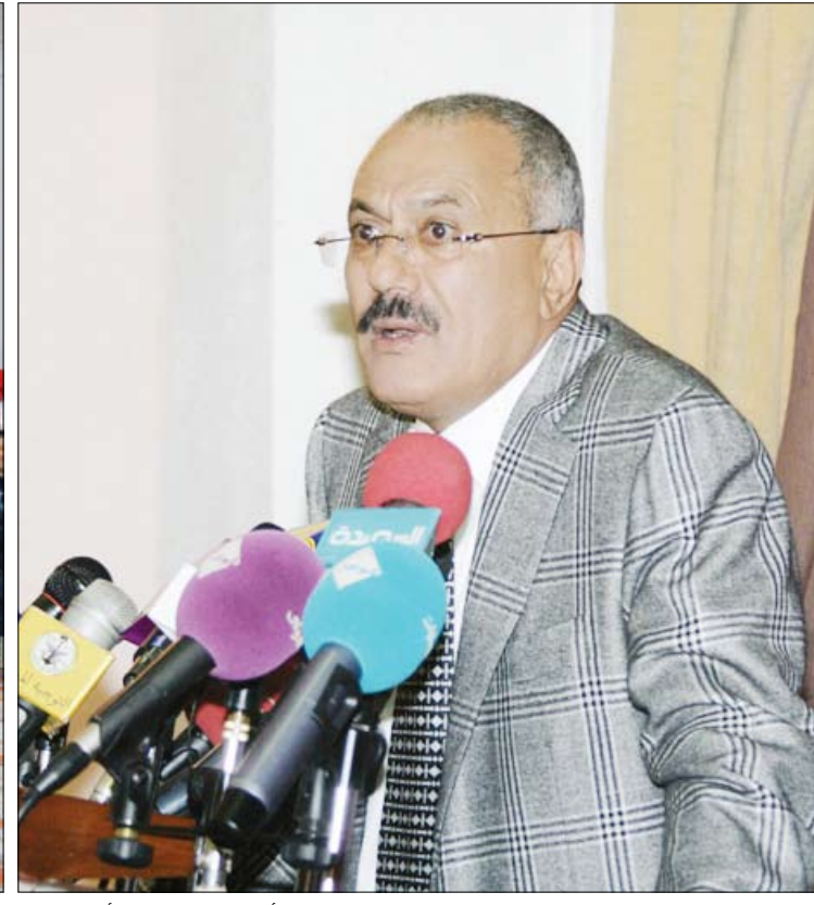
رئيس الجمهورية يلقى كلمته في المؤتمر الوطني الأول للجمعيات والأسر المنتجة أمس