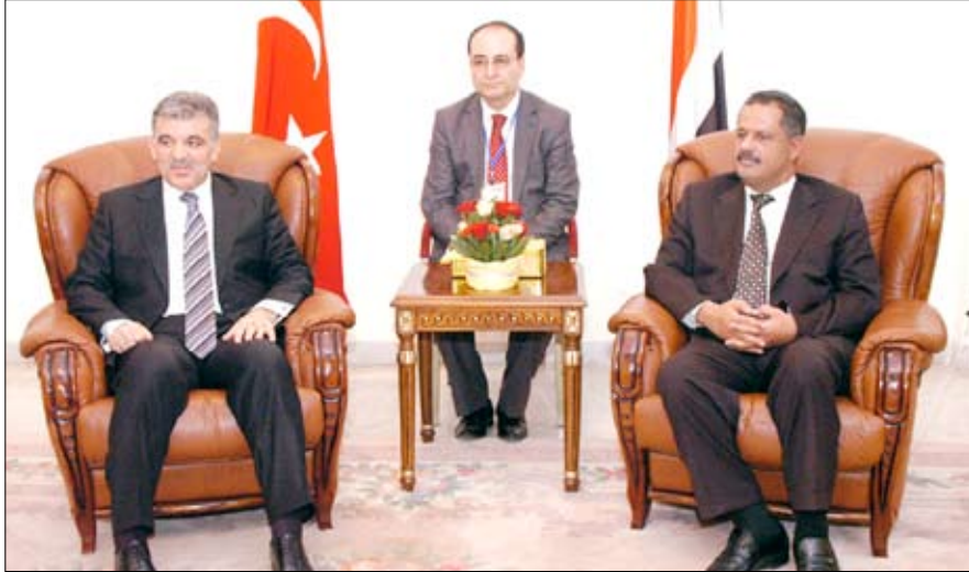
مجور خلال استقباله الرئيس التركي أمس

صنعا / سيا : استقبل رئيس مجلس الوزراء الدكتور علي محمد مجور أمس بمقر رئاسة الوزراء فخامة الرئيس عبد الله غل رئيس جمهورية تركيا الشقيقة الذي يزور اليمن حاليا. وجرى خلال المقابلة بحث علاقات التعاون الأخوية بين البلدين الشقيقين، وأفاقها المستقبلية في مختلف المجالات، خاصة الاقتصادية والتجارية والاستثمارية، والإمكانات المتاحة لتعزيزها وتطويرها بما يخدم المصالح المشتركة للشعبين والبلدين الشقيقين. كما جرى خلال المقابلة التأكيد على أهمية وضع البات عملية لتنفيذ الاتفاقيات الموقعة بين البلدين، في المجالات المختلفة. ورحب رئيس الوزراء بزيارة فخامة الرئيس التركي لبلده الثاني اليمن