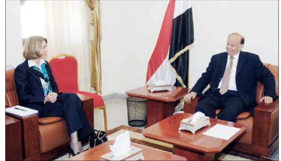
نائب الرئيس لدى استقباله باربارا بوبدين أمس

صنعا / سيا : استقبل الأخ عبدربه منصور هادي نائب رئيس الجمهورية أمس سفيراً أمريكياً السابقة في اليمن باربارا بوبدين. وجرى خلال اللقاء استعراض جملة من القضايا والموضوعات المتصلة بالوضع الاقتصادي والسياسي في اليمن والتحديات المختلفة التي تواجه اليمن وفي مقدمتها الأعمال الإرهابية لتنظيم القاعدة بالإضافة إلى ما ملته التمرد الحوثي من آثار وكذا الاختلالات الأمنية في بعض مناطق فريبات المحافظات الجنوبية إلى جانب أعمال القرصنة في الساحل الصومالي وخليج عدن. وأشار نائب رئيس الجمهورية إلى أهمية الممر البحري الدولي في هذه المنطقة والذي يمر منه ما يزيد على ثلاثة ملايين برميل من النفط يوميا