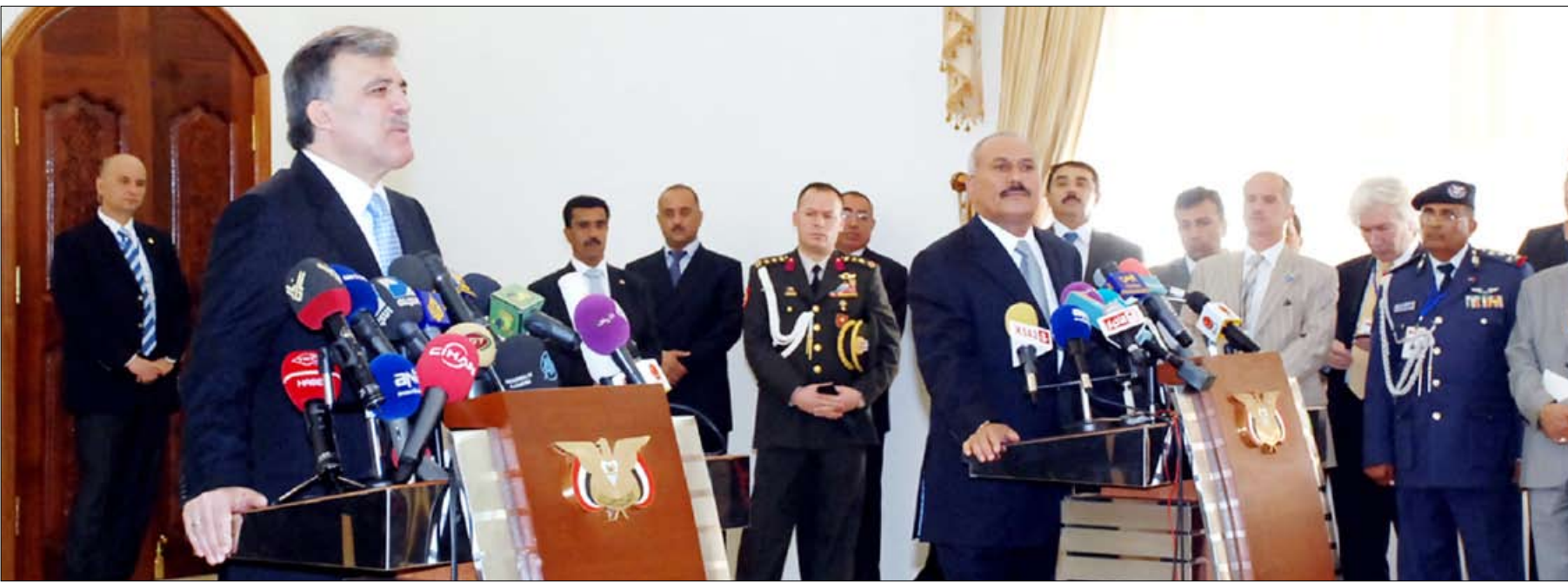
رئيس الجمهورية ونظيره التركي في المؤتمر الصحفي

صنعا / سيا : غادر صنعاء مساء أمس فخامة الرئيس عبدالله غل رئيس الجمهورية التركية بعد زيارة رسمية لليمن على رأس وفد رفيع المستوى من الوزراء والمسؤولين ورجال الأعمال والمستثمرين استغرقت يومين، أجرى خلالها مباحثات مع أخيه فخامة الرئيس علي عبدالله صالح رئيس الجمهورية، تناولت العلاقات الأخوية ومجالات التعاون المشترك بين البلدين الشقيقين وسبل تطويرها وتعزيزها في المجالات كافة في مقدمتها الاقتصادية والتجارية والاستثمارية والثقافية والاجتماعية. وقد عقدت أمس بصنعاء جلسة المباحثات الختامية بين الجمهورية اليمنية والجمهورية التركية وعقب المباحثات عقد الرئيسان مؤتمراً صحفياً، استعرضا فيه نتائج المباحثات والاتفاق المستقبلية لتطوير العلاقات الأخوية ومجالات التعاون المشترك بين البلدين والشعبين الشقيقين اليمني والتركي. وأكد فخامة الأخ الرئيس عمق ومتانة العلاقات اليمنية التركية. وقال: "العلاقات اليمنية التركية علاقات تاريخية وأزلية وقديمة وتربطنا بتركيا علاقات ممتازة وهناك تنسيق مشترك على الصعيد الثنائي وفي المحافل الدولية". ورحب فخامته باستثمارات رجال الأعمال الأتراك في اليمن وبشراكتهم مع القطاع الخاص اليمني في شتى المجالات. من جانبه وصف فخامة الرئيس التركي عبد الله غل زيارته لليمن بالزيارة التاريخية باعتبارها الأولى على مستوى رئيس الجمهورية التركية، مؤكدا حرص بلاده على تفعيل الاتفاقيات الموقعة بين البلدين. وجدد الرئيس غل التأكيد أن تركيا نولي أهمية كبيرة لوحدة وسيادة الأراضي اليمنية وكذا دعم جهود اليمن في مكافحة الإرهاب ومواصلة دعمها لليمن في مسيرتها التنموية والاقتصادية.