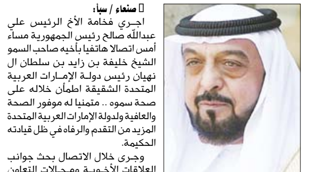
الشيخ خليفة بن زايد

صنعا / سيا : اجري فخامة الأخ الرئيس علي عبدالله صالح رئيس الجمهورية مساء أمس اتصالا هاتفيا بأخيه صاحب السمو الشيخ خليفة بن زايد بن سلطان آل نهيان رئيس دولة الإمارات العربية المتحدة الشقيقة أطمان خلاله على صحة سموه. - متمنيا له موفقير الصحة والعافية ولدولة الإمارات العربية المتحدة المزيد من التقدم والرفاه في ظل قيادته الحكيمة. وجرى خلال الاتصال بحث جوانب العلاقات الأخوية ومجالات التعاون المشترك بين البلدين الشقيقين وسبل تعزيزها. وقد عبر سمو الشيخ خليفة بن زايد عن شكره وتقديره لأخيه فخامة رئيس الجمهورية على مشاعره الأخوية الصادقة.. متمنيا لفخامته موفقير الصحة والسعادة ولبشعبنا اليمني دوام التقدم والازدهار.