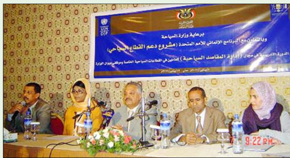
من أعمال افتتاح دورة إدارة المقاصد السياحية