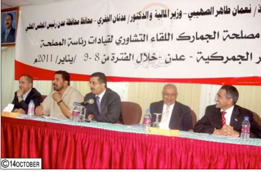
خلال اختتام اللقاء التشاوري