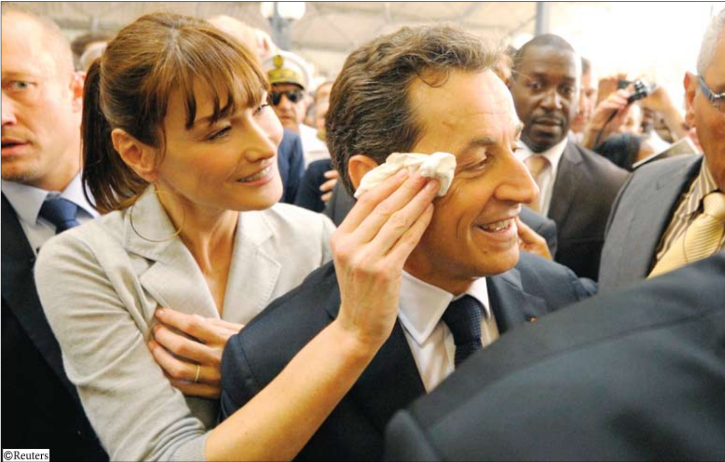
سيدة فرنسا الأولى كارلا برونو ساركوزي زوجة الرئيس الفرنسي تمسح بجهته أثناء زيارتهما لسوق في جزر المارتينيك أمس

الجمعة في نيامي عاصمة النيجر. وقال مسؤول لرويترز إن سلطات النيجر تبحث في أنحاء البلاد أمس السبت عن الرجلين اللذين خطفا في العاصمة اثنتين من الفرنسيين خطفا في وقت متأخر يوم أمس الأول