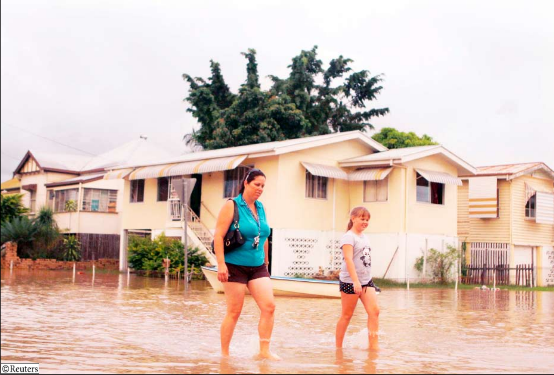
■ الفيضانات تغمر منازل المواطنين في استراليا