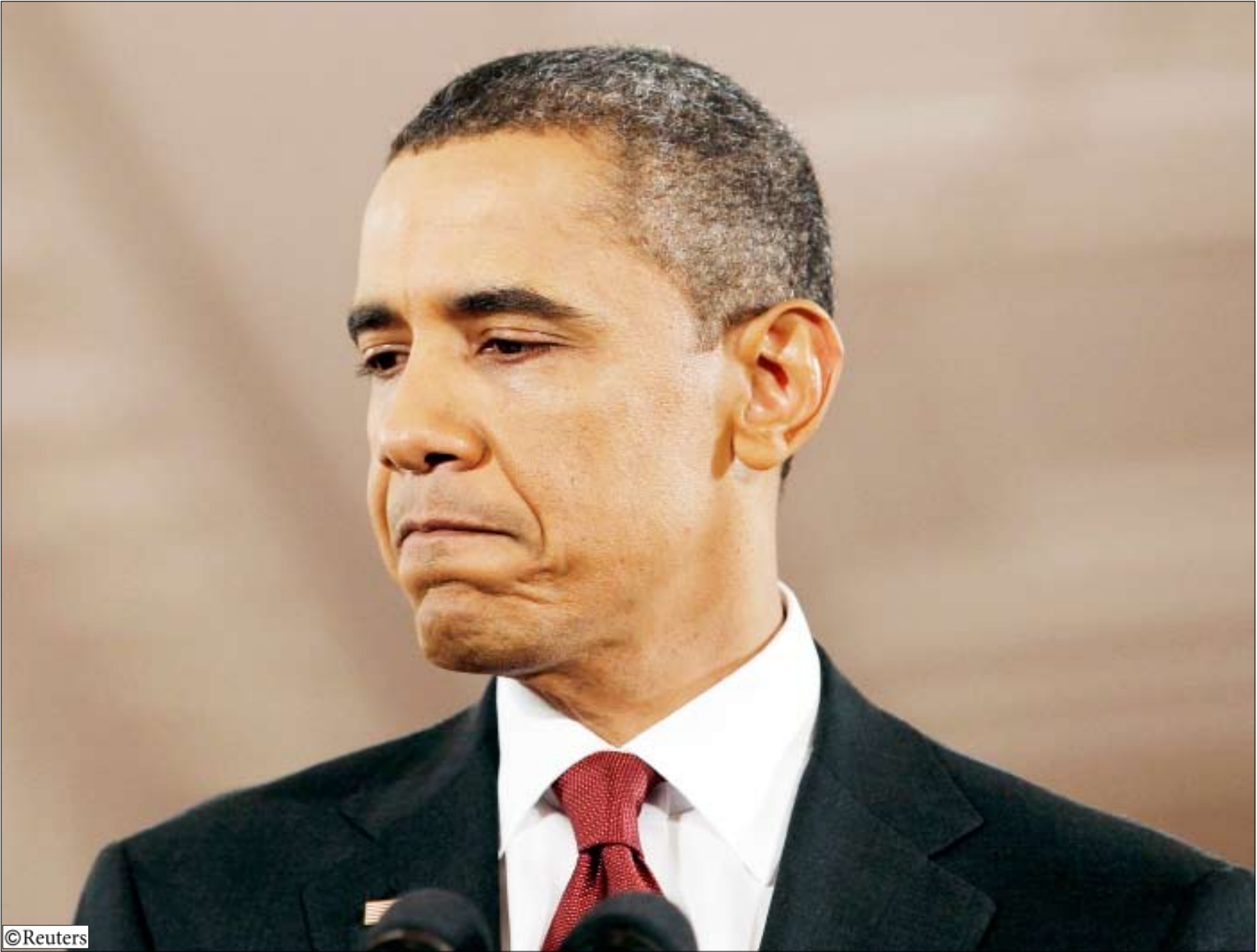
■ الرئيس الأمريكي باراك اوباما