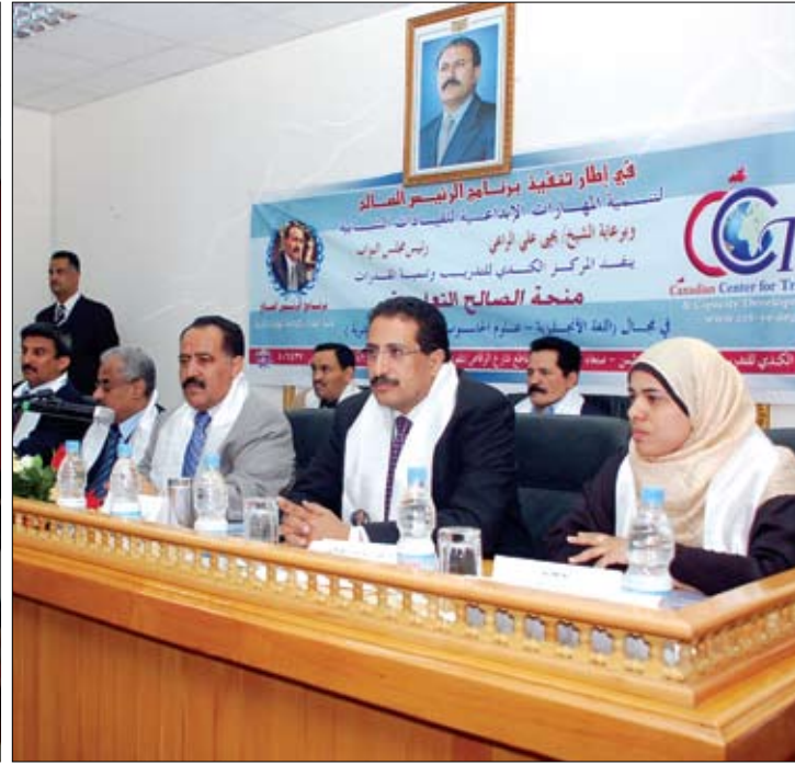
الراعي لدى تدشينه مشروع منحة الصالح التعليمية لتنمية المهارات أمس

أكد رئيس مجلس النواب يحيى علي الراعي الرعاية التي توليها الدولة لقطاع التربية والتعليم والتدريب العالي والبحث العلمي بالنظر إلى الأهمية التي يكتسبها هذا القطاع في رعد المجتمع بالكوادر المتعلمة والمؤهلة نظريا وعلميا بمختلف فنون العمل التربوي والتعليمي والبحث العلمي بما يخدم قضايا التنمية ومخرجاتها في مختلف مجالات الحياة الاقتصادية والاجتماعية والثقافية. وأشار رئيس مجلس النواب لدى تدشينه يوم أمس السبت مشروع منحة الصالح التعليمية لتنمية المهارات الإبداعية إلى المنجزات الوطنية التي تحققت في مجال التعليم العام والمتوسط والثانوي والفني والتالي. وأوضح الراعي أن نواب الشعب قد تحملوا مسئوليتهم الوطنية وقاموا باستكمال التصويت على مشروع قانون الانتخابات المعد وترشيح اللجنة العليا للانتخابات بما يمكن البلاد وجماهير الشعب قاطبة من ممارسة حقهم الدستوري في إجراء الانتخابات النيابية في موعدها المحدد في شهر ابريل من العام الجاري. وأضاف أن القيادة السياسية بزعامة فخامة الأخ الرئيس علي عبدالله صالح رئيس الجمهورية تولي الشباب المكانة الكبيرة في السياسات العامة للدولة وبرامجها التنموية المختلفة لما لذلك من أثر فعال في التغلب على كافة التحديات السياسية والتنموية والثقافية.