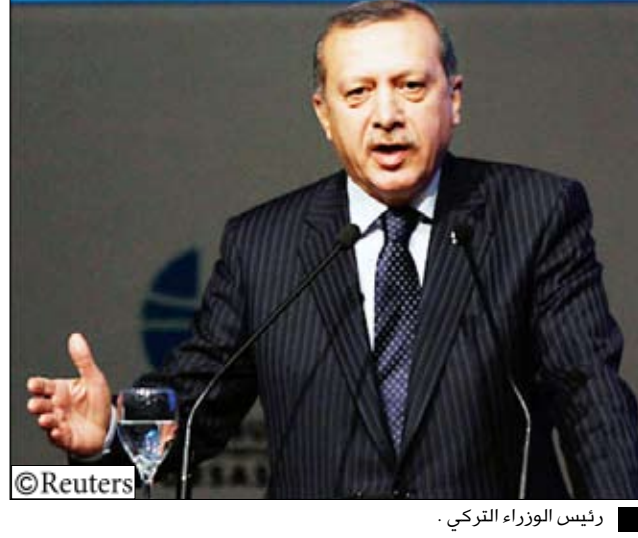
رئيس الوزراء التركي.

يشترى تركيا عن اهتمام بلاده بالعمل مع أنقرة بشأن موضوع الهجرة غير الشرعية، علما بأن أثينا أعلنت أنها تخطط لإقامة سياج على حدودها مع تركيا بعد أن شككت في الماضي من أن الأخيرة لا تبذل جهدا كافيا لوقف تدفق المهاجرين غير الشرعيين. وبدوره قلل أردوغان من أهمية بناء السياج الذي سيمتد نحو 12 كيلومترا فقط من الحدود بين البلدين التي يبلغ طولها أكثر من 200 كلم، لكنه قال إن تقديره للمشكلة تغير بعد أن أبلغه باباندريو بوجود مليون مهاجر غير شرعي في اليونان.