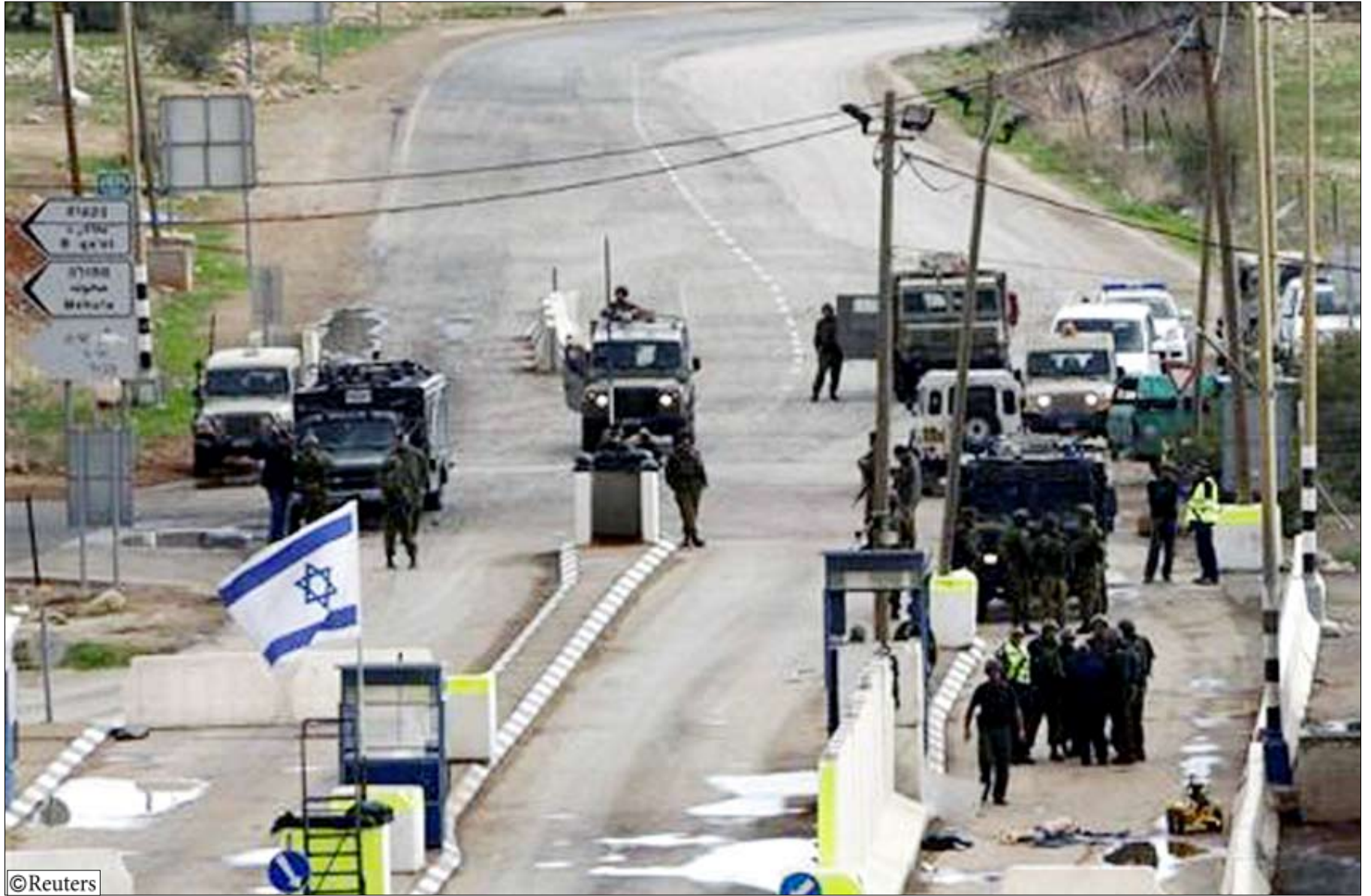
جنود إسرائيليون قرب جثمان فلسطيني عند نقطة تفتيش بالضفة الغربية يوم أمس السبت.

يشتبته في انتمائه لحركة المقاومة الإسلامية (حماس) ويعيش في المبنى نفسه واعترف الجيش الإسرائيلي بأن القتل وقع بطريق الخطأ. وقتل فلسطينية الجمعة الماضي بعد احتجاج على الجدار العازل الذي تبنه إسرائيل عبر الضفة الغربية. وقال أحد المسعفين ان الفلسطينية فارقت الحياة بعدما استنشقت الغاز المسيل للدموع.