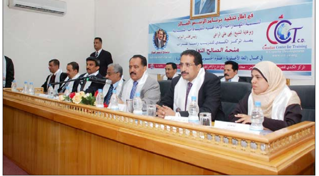
الراعي لدى تدشينه مشروع منحة الصالح التعليمية