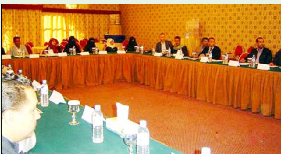
جانب من الحضور في الدورة