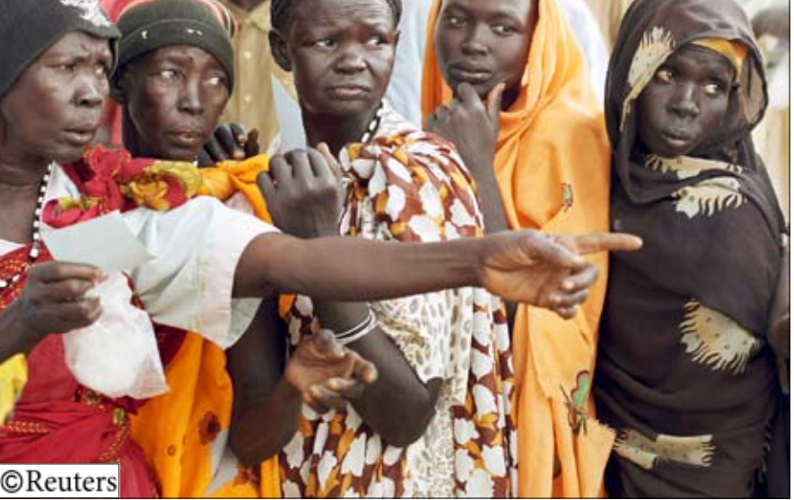
نساء من جنوب السودان في مرحلة التسجيل للاستفتاء