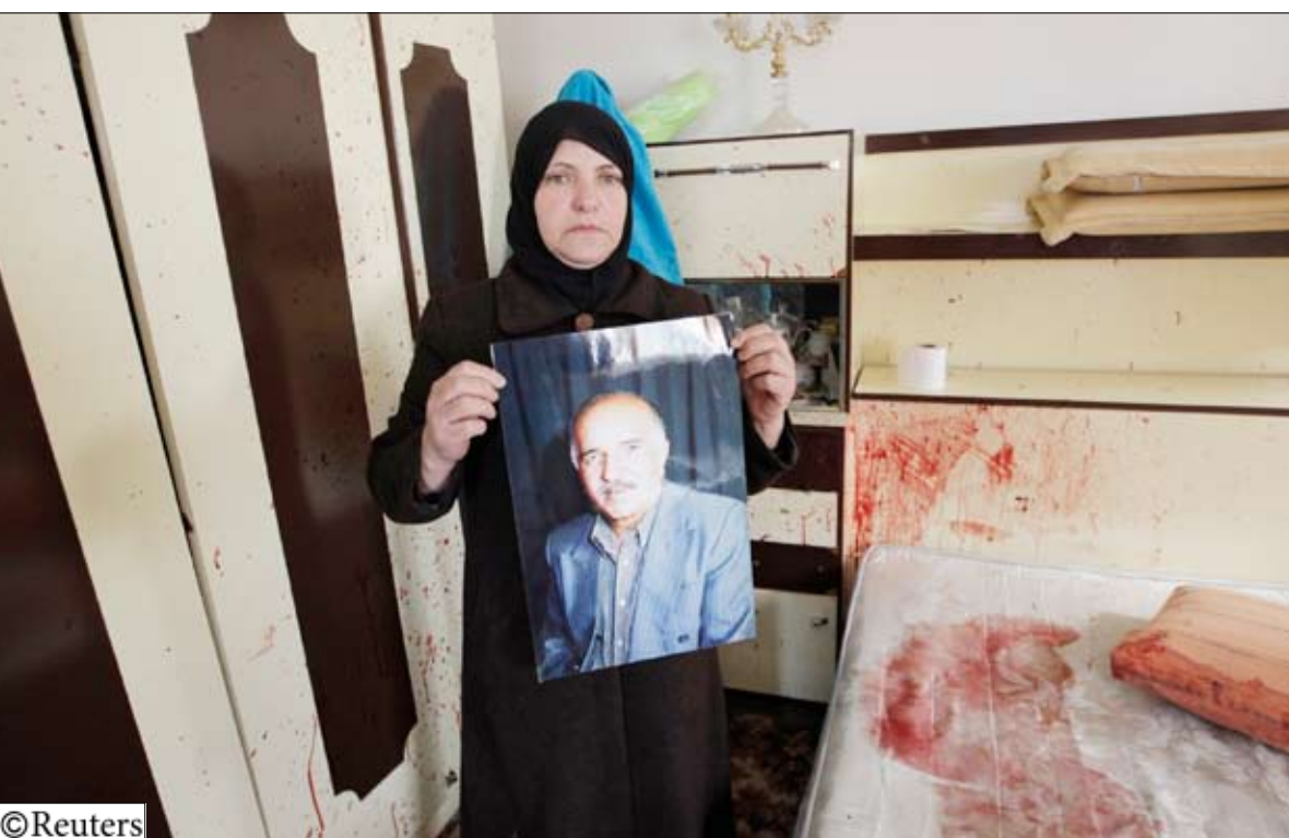
مسرح الجريمة في منزل الشهيد