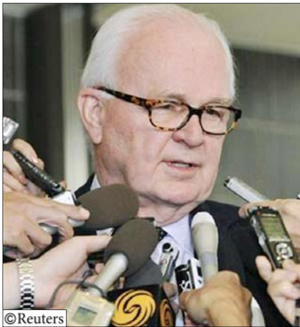
ستيفن بوسورث يتحدث للصحفيين في طوكيو يوم أمس الجمعة

سيجد بعض العراقيين صعوبة في التخلص من الاعتقاد بأن الصدر مرتبط بفرق الاعدام الشيعية في أوج الصراع الطائفي الذي عانى منه العراق وسيخشون من أن تعنى عودته ظهور جيش المهدي من جديد. وتراجعت أعمال العنف بشكل كبير على الرغم من أن التفجيرات وجرم القتل لا تزال شائعة. وتنسب معظم أعمال العنف المستمرة الى مقاتلين سنة معارضين للهيمنة السياسية للشيعة في العراق لكن جزءا منه ينسب الى جماعات شيعية متطرفة كانت متحالفة ذات يوم مع التيار الصدري لكنها انفست منذ ذلك الحين. وربما تزيد التوترات اذا سمحت عودة الصدر لبعض الانتصار بالاعتقاد أنه يريدهم ان يستعرضوا عضلاتهم مجددا. وسحقت القوات الامريكية والعراقية جيش المهدي في عام 2008 وقد ألقى السلاح. وربما يعود اذا خاب أمل أنصار الصدر في نتائج مشاركة حركتهم بالعمل السياسي.