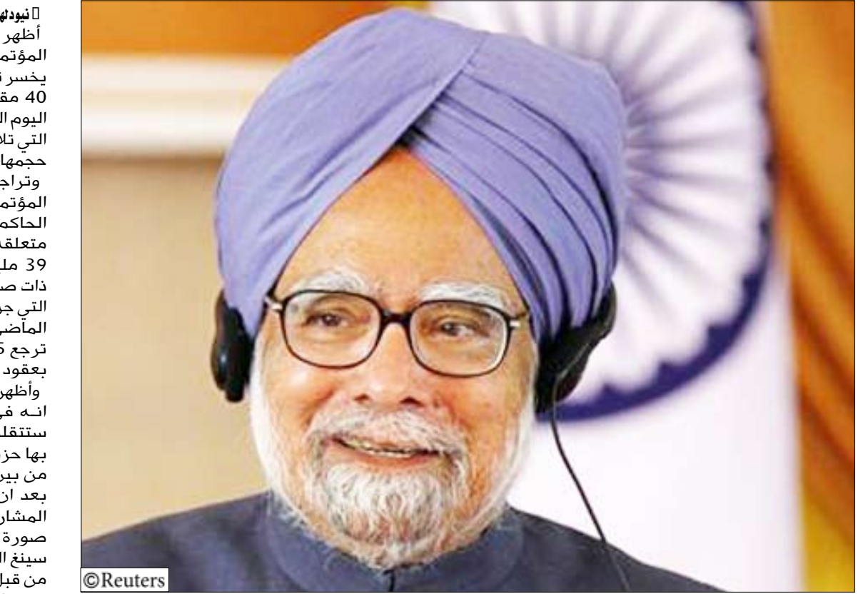
رئيس الوزراء الهندي مانموهان سينغ

وأظهر استطلاع ايه.سي نيلسون انه في حالة اجراء الانتخابات ستقلص الاغلبية التي يتمتع بها حزب المؤتمر بنحو 40 مقعدا من بين 206 مقاعد يتشكلها الاثنان بعد ان قال 44 في المئة من المشاركين في الاستطلاع ان صورة رئيس الوزراء مانموهان سينغ التي كانت لا يشوبها شائبة من قبل قد تأثرت بالفضائح. وشمل الاستطلاع وهو بعنوان «مزاج الامة» وأجرته ايه. سي نيلسون ومجلة اينديا توداي 12349 ناخبا في 19 ولاية بعد استطلاع آراء الناخبين وجها لوجه في الفترة من 4 الى 19 ديسمبر كانون الاول. وتسببت احتجاجات المعارضة على طريقة التحقيق في مزاعم الفساد في اصابة برلمان الهند بالشلل منذ نوفمبر تشرين الثاني واتهمت أحزاب المعارضة الحكومة بانها غير فعالة وقد يتطلب الخروج من الازمة الراهنة اجراء انتخابات مبكرة قبل موعد الانتخابات التي تجري كل خمس سنوات. وفاز حزب المؤتمر بفترة ثانية في انتخابات عام 2009. وأظهر الاستطلاع ان حزب بهاراتيا جاناتا حزب المعارضة الرئيسي الهندوسي القومي سيفوز بما يصل الى 20 مقعدا اضافيا اذا اجريت الانتخابات السبت. وتراجعت شعبية حزب المؤتمر ثلاثة في المئة بين الفقراء الذين يشكلون قطاعا مهما من الناخبين الذين يعطون أصواتهم للحزب. لكن 42 في المئة من المشاركين في الاستطلاع يعتقدون ان ائتلافا برئاسة حزب المؤتمر سيبقى في السلطة اذا اجريت الانتخابات عام 2014 .