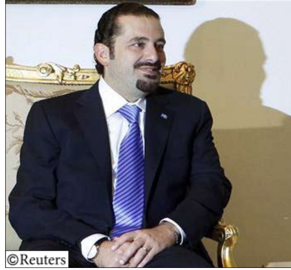
رئيس الوزراء اللبناني سعد الحريري

ونفى حزب الله أنه دور له في مقتل الحريري ورفض التحقيق المستمر منذ خمس سنوات في التفجير الذي يقول ان وراءه اهدافا سياسية وطالب رئيس الوزراء اللبناني بنسحب المحكمة التي تقود التحقيق بدعم من الامم المتحدة، وهو مطلب لم يجد استجابة حتى الان. وقال محللون انه اذا وجهت المحكمة اتهامات بالفعل لاجزاء في حزب الله فقد ينسحب من الحكومة هو وحلفاء له من الشيعة والمسيحيين بغرض اسقاطها. وقال «ليكن مفهوما بكل صراحة ان اي التزام من جانبي لن يوضع موضع التنفيذ قبل ان يقوم الطرف الاخر بتنفيذ ما التزم به، هذه هي القاعدة الاساس في الجهود السورية. ومن المتوقع ان يرسل مدعي المحكمة دانيال بيلمار مسودة لائحة الاتهام الى القاضي دانيال فرانسس قريبا، وقال المتحدث باسم المحكمة ان تفاصيل الاتهامات لن تنشر قبل ان يوافق عليها القاضي وهو ما قد يستغرق شهرين.