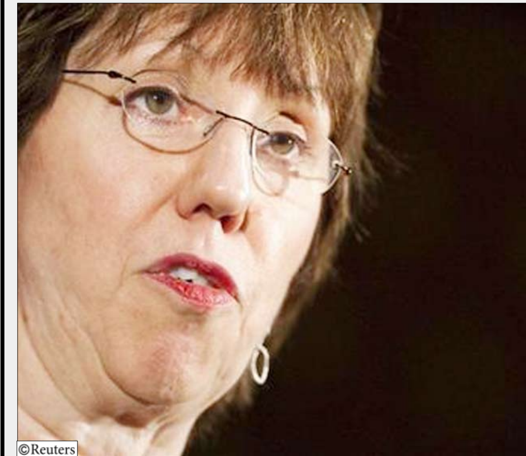
كاترين اشتون مسؤولة السياسة الخارجية في الاتحاد الأوروبي.