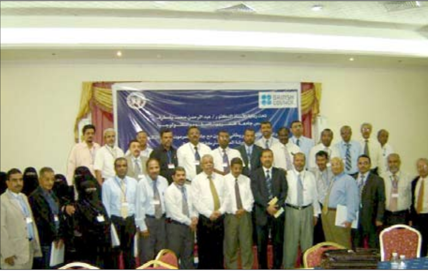
المشاركون في ورشة تقييم البرامج الأكاديمية

تحت إشراف مدير الجامعة الأستاذ الدكتور عبد الله بن يحيى، اختتمت في جامعة حضرموت ورشة تقييم البرامج الأكاديمية والتقييم الذاتي لجامعة حضرموت، والتي نظمتها وحدة التقييم والقياس الأكاديمي بالتعاون مع جامعة حضرموت للعلوم والتكنولوجيا. وهدفت الورشة التي قام بالتدريب فيها الخبير الدولي البروفيسور عبداللطيف الحكيمي المستشار التعليمي والأكاديمي في اليمن وعميد كلية التربية في جامعة الإمارات سابقاً إلى تعريف المشاركين فيها على البرامج الأكاديمية والتقييم الذاتي ومستويات التقييم ومبادئ التقييم السليم وخصائصه وتطبيق معايير الاعتماد الأكاديمي واعداد خطط تطويرية بحسب المعايير الأكاديمية. وفي حفل الاختتام أكد رئيس جامعة حضرموت للعلوم والتكنولوجيا الدكتور عبدالرحمن محمد بالمراف أن قيادة الجامعة تضع في سلم أولوياتها قضية ضمان الجودة في التعليم الجامعي بهدف الوصول إلى الاعتماد الأكاديمي، بما يساعد الجامعة على الاندماج في هذه النشاطات على مستوى الكليات والأقسام، معرباً عن اعتزاز جامعة حضرموت بالتعاون مع المجلس الثقافي البريطاني الأمر الذي يسعد بالرفع على العملية التعليمية بشكل عام. وتمن رئيس جامعة حضرموت للعلوم والتكنولوجيا، د عبد الرحمن محمد بالمراف جهود المجلس