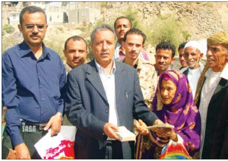
تسليم اجارات منازل للمتضررين

بالشفة الارنبية. وذكر أن هذا النشاط الذي يمارسه المركز يأتي بتبعية من قبل الدكتور عبدالعزيز صالح بن حبتور رئيس جامعة عدن- موصفاً أن رئيس مجلس الأمناء بجامعة عدن سيدعم هذا العمل الإنساني الخيري الكبير بالمساهمة في علاج حالتين في مستشفى جامعة روستوك بألمانيا بعد أن استعصى إجراء العمليات الجراحية لهما في عدن إحداهما تعاني من شق في الوجه (الأنف)، والأخرى من ورم ناتج عن التهابات في الغدد الليمفاوية في الوجه.