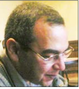
أحمد خالد توفيق