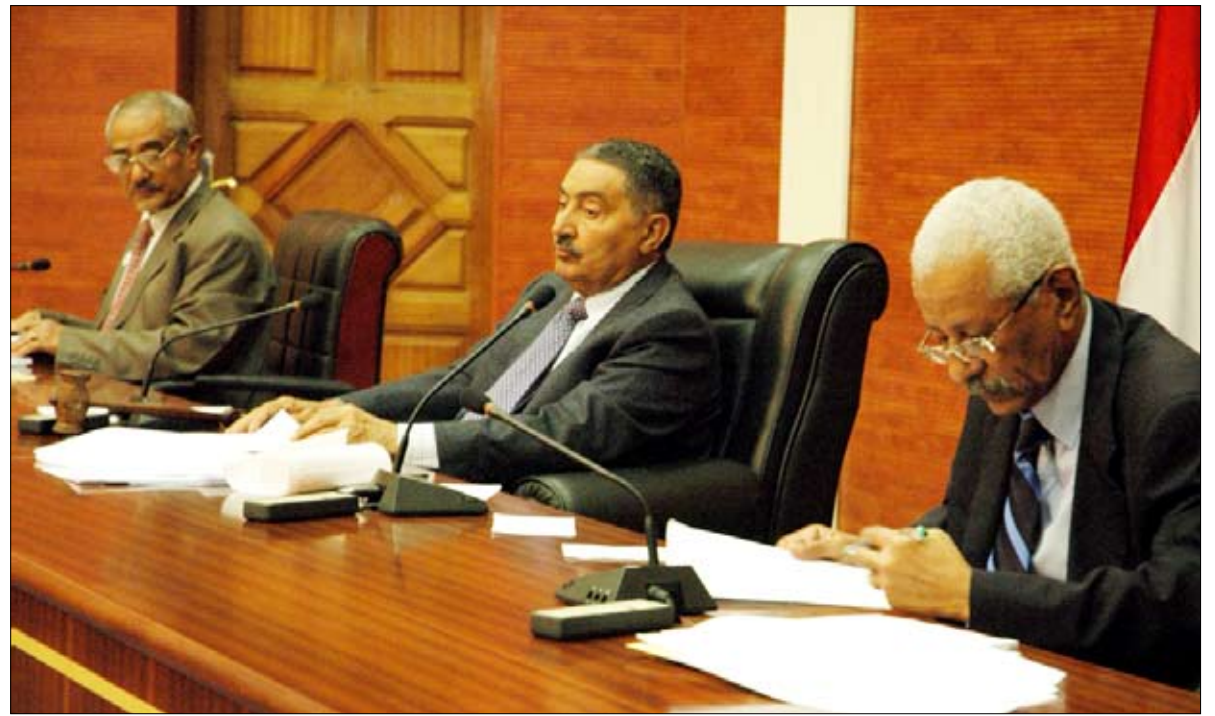
مجلس الشورى في اجتماعه أمس