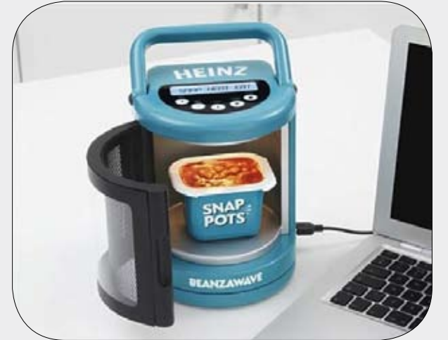
USB الميكروويف لتسخين الطعام أثناء استخدام الكمبيوتر