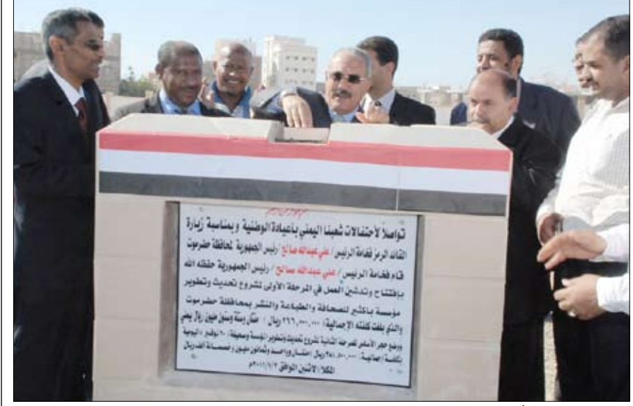
.. ويضع حجر الأساس لتحديث مؤسسة باكتير

♣ المكلا / سيا: قام فخامة الرئيس علي عبدالله صالح رئيس الجمهورية أمس في مدينة المكلا بوضع الحجر الأساس للمرحلة الأولى من مشروع مؤسسة باكتير للصحافة والطباعة والنشر بمحافظة حضرموت بكلفة إجمالية 266 مليون ريال. وتشمل المرحلة الأولى من تطوير مؤسسة باكتير للصحافة والطباعة والنشر توريد آلات طباعة