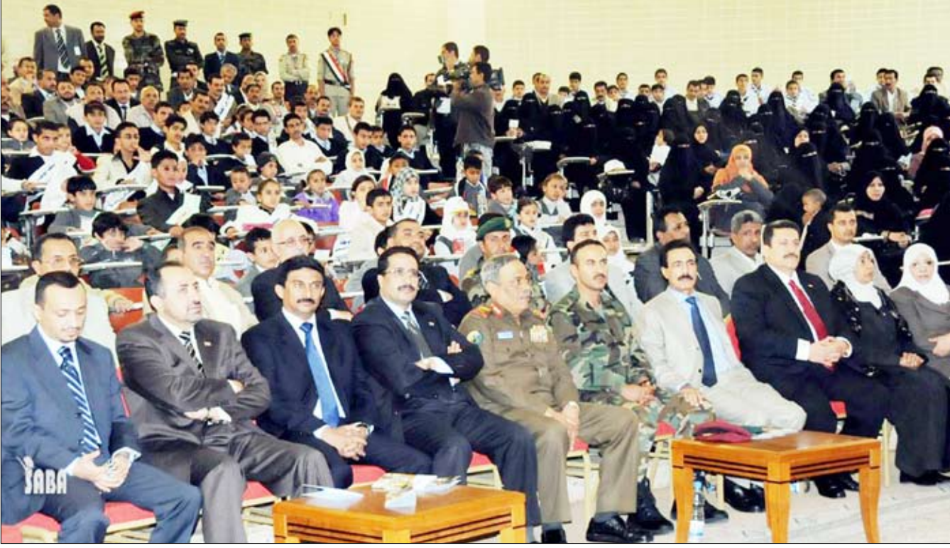
وزير الداخلية خلال حضوره الاحتفالية