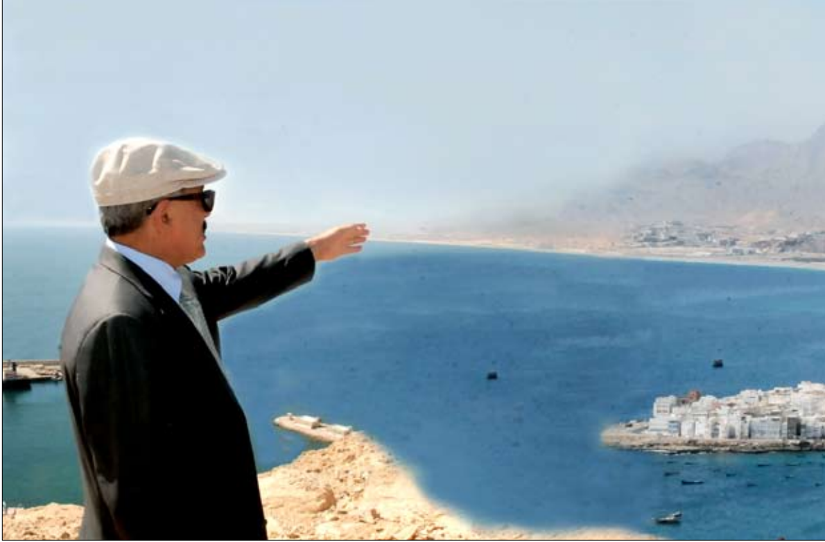
... ويزور مشروع تطوير مرتفعات المكلا الاستثماري