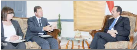
الأرجبي لدى لقائه نائب السفير الألماني

📌 منعاه / سبأ: بحث نائب رئيس الوزراء للشئون الاقتصادية وزير التخطيط والتعاون الدولي عبدالكريم الأرجبي أمس مع نائب السفير الألماني بصنعاء ميشيل ريس القضايا المتصلة بتعزيز التعاون بين اليمن وألمانيا الاتحادية وسبل تعزيزها بما يخدم المصالح المشتركة. وفي اللقاء أشاد نائب رئيس الوزراء للشئون الاقتصادية بالدعم الذي تقدمه الحكومة الألمانية لتعزيز مسيرة التنمية في اليمن والرقي بمستوى التعاون الثنائي بين البلدين.