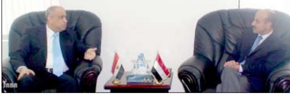
وزير الأشغال خلال لقائه السفير المصري

📌 منعاه / سبأ: بحث وزير الأشغال العامة والطرق المهندس عمر الكرشمي أمس مع السفير جمهورية مصر العربية بصنعاء اشرف عقل أوجه التعاون بين البلدين في مجال الأشغال العامة وسبل تعزيزها وتطويرها.