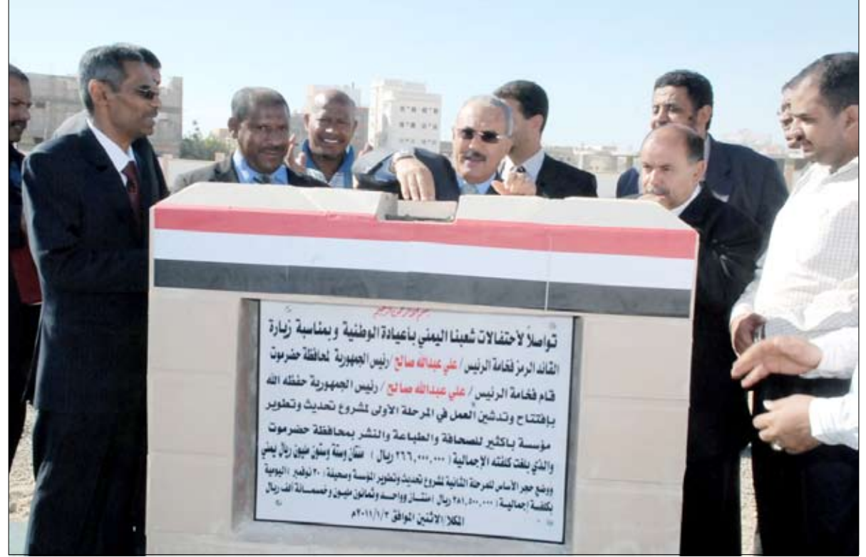
رئيس الجمهورية يضع الحجر الأساس لمشروع تحديث مؤسسة باكتير