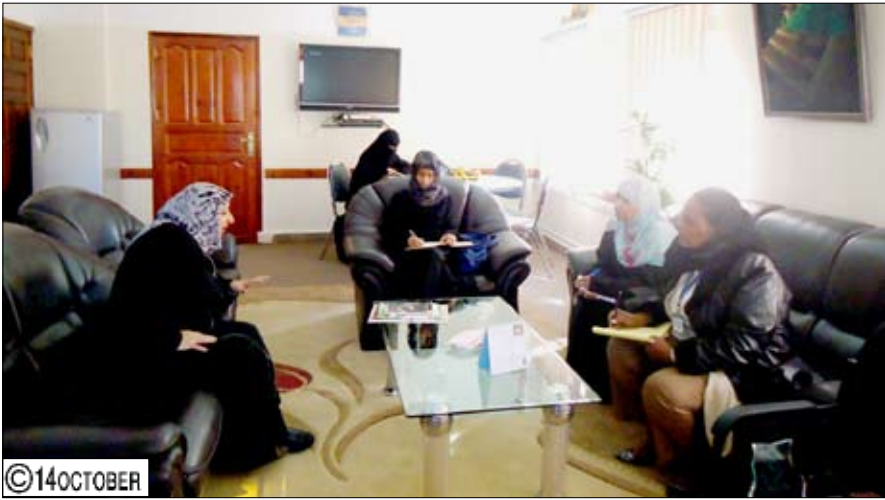
رسمية الإيرانية خلال لقاءها ممثلي مشروع الأمم المتحدة

وتحدثت عن الرؤى المستقبلية للاتحاد قائلة: «إلى جانب تدريب وتأهيل المرأة في مجال الأعمال اليدوية والحرفية يسعى الاتحاد إلى فتح أسواق لتلك المنتجات لأن الأسواق اليمانية لا تستوعب الأعمال الحرفية لعدة أسباب منها الاستيراد من أسواق شرق آسيا بالإضافة إلى الحرفية البالغة والأفغان في الصناعة.