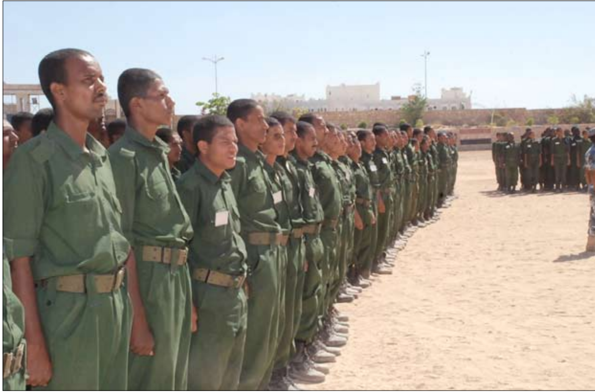
■ جانب من أفراد قوات النجدة في المكلا