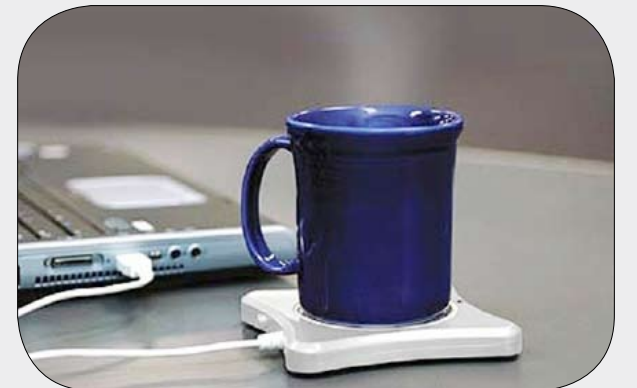
USB لتحضير القهوة