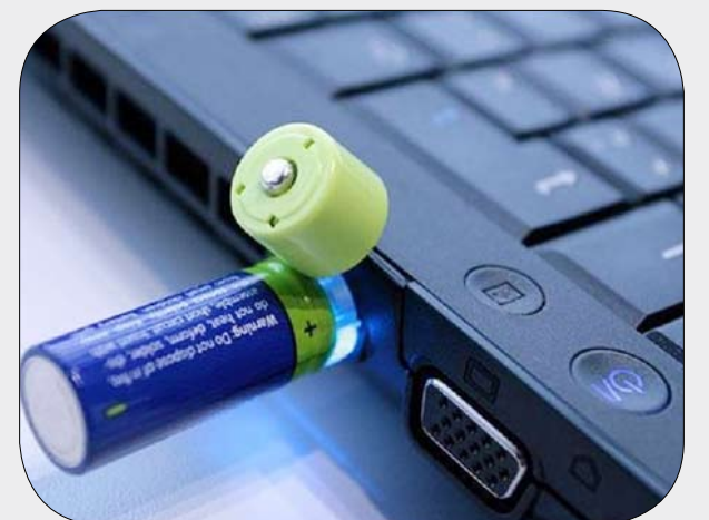
USB لإعادة شحن البطارية