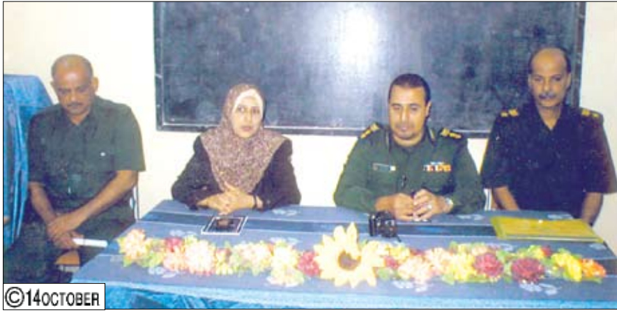
خلال افتتاح دورة الدفاع المدني