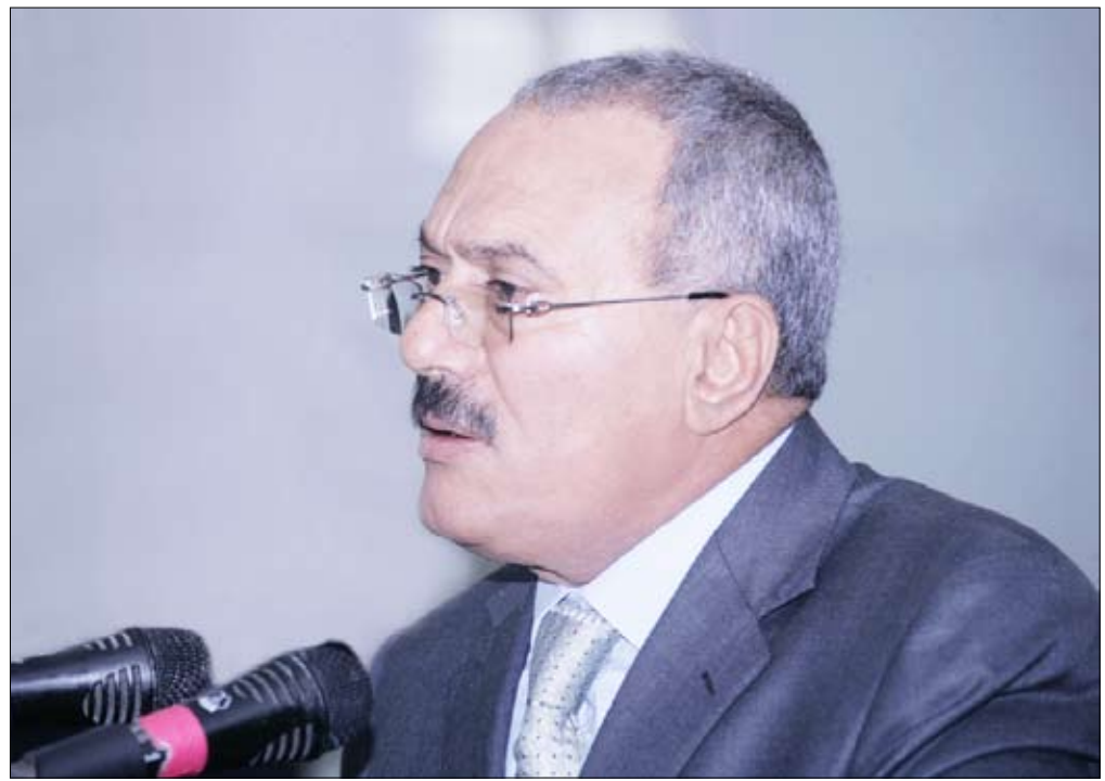
رئيس الجمهورية يلقي كلمته في المهرجان الخطابي والفني بجامعة حضرموت