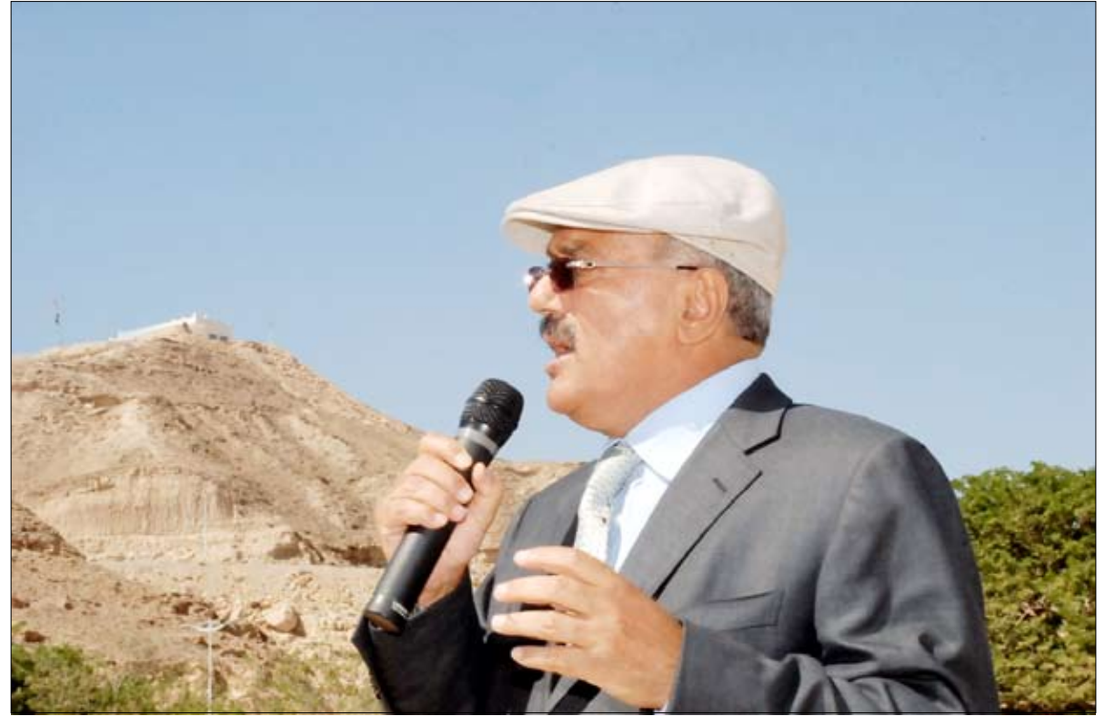
■ رئيس الجمهورية يلقي كلمة خلال تفقده معسكر قوات النجدة