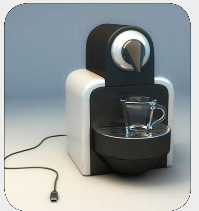
USB لجعل الكوب ساخناً