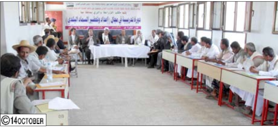
خلال افتتاح الدورة

الأرض وأنواع الأسمدة والعوامل التي تؤثر على نمو النباتات والاحتياجات الواجب توافرها عند تحضير السماد ووفوائد الأسمدة في تخصيب التربة.