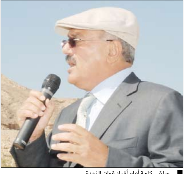
.. ويلقي كلمة أمام أفراد قوات النجدة