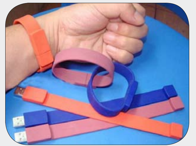
USB فلاش سوار اليد