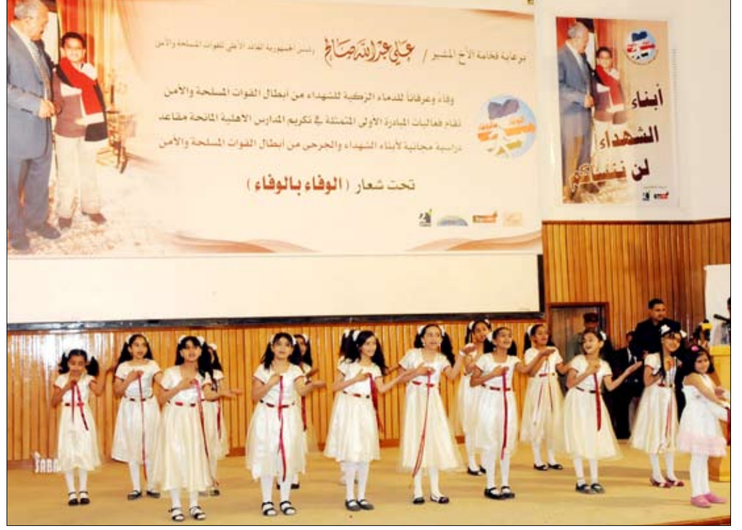
لقطة من الحفل الفني