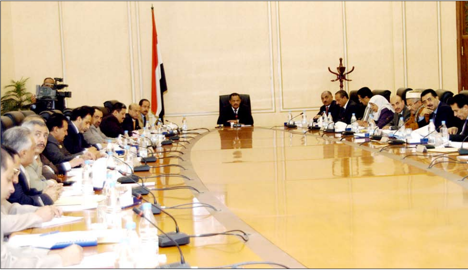
□ مجور يترأس اجتماع اللجنة العليا لإعداد خطة التنمية الاقتصادية والاجتماعية

للتنمية المحلية وتوجهاتها وكذلك خطط المحافظات.