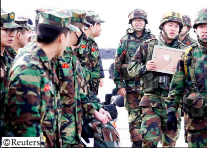
جنود كوريون جنوبيون في نوبة حراسة على جزيرة تعرضت لقصف من الشمال يوم 28 نوفمبر 2010.