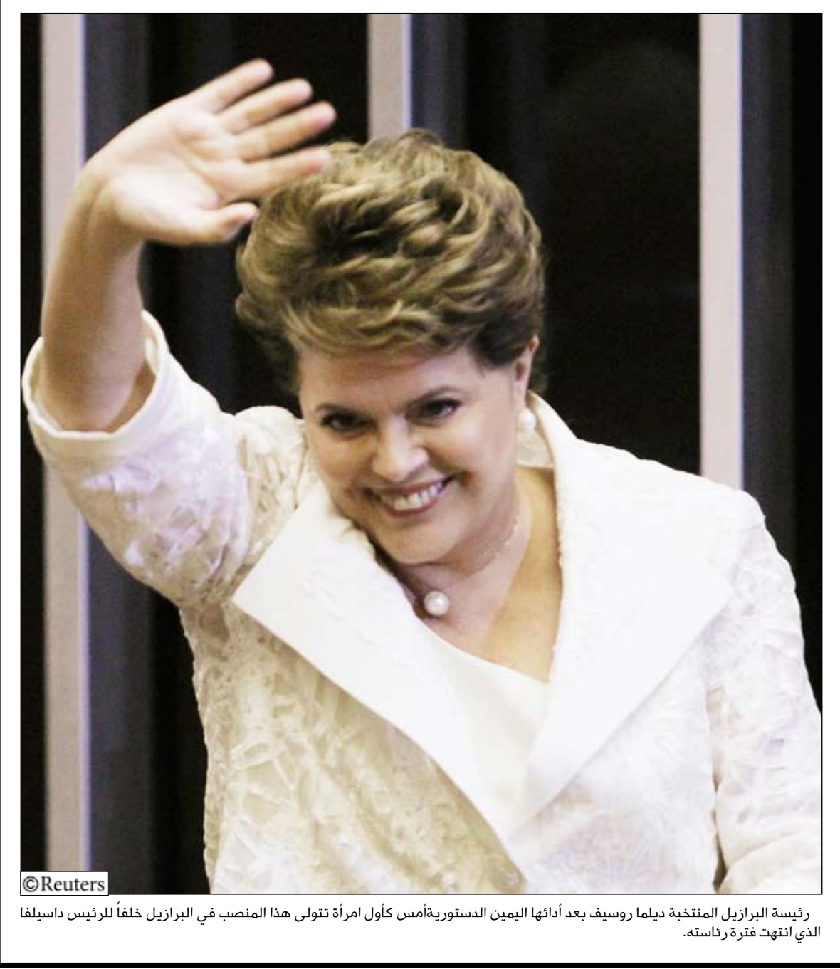
رئيسة البرازيل المنتخبة ديلما روسيف بعد أدائها اليمين الدستورية أمس كأول امرأة تتولى هذا المنصب في البرازيل خلفاً للرئيس داسيلفا الذي انتهت فترة رئاسته.

محافظات / عيدروس نورجي، هايوكس قمارة موديل 2010م يقودها شاب يبلغ من العمر (24) عاما محملة بمبيدات حشرية مهربية بعضها منتهية الصلاحية. وفي السياق ضبطت شرطة محافظة تعز بمديرية حبر الدماء بحالة تسهم ناجمة عن المبيد الحشري الذي وضع على شعرها للقضاء على القمل. وأدى حادث مماثل (استخدام المبيد الحشري) إلى وفاة طفلة بمدينة إب. وتمكنت أجهزة الشرطة في محافظة ندمار من ضبط سيارة لإحالتهم إلى المساءلة القانونية.