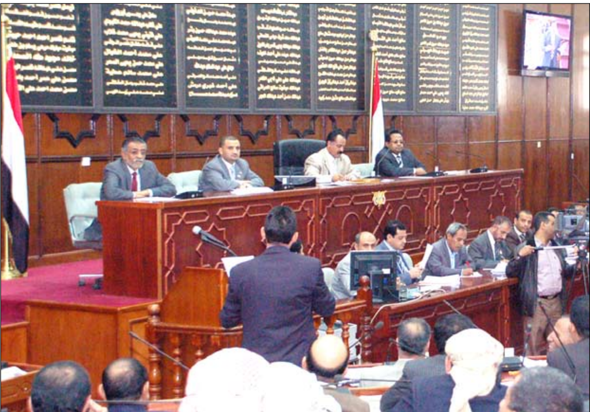
■ من جلسة مجلس النواب أمس

إصلاحاً دستورياً وتعزيزاً للتجربة الديمقراطية في بلادنا.