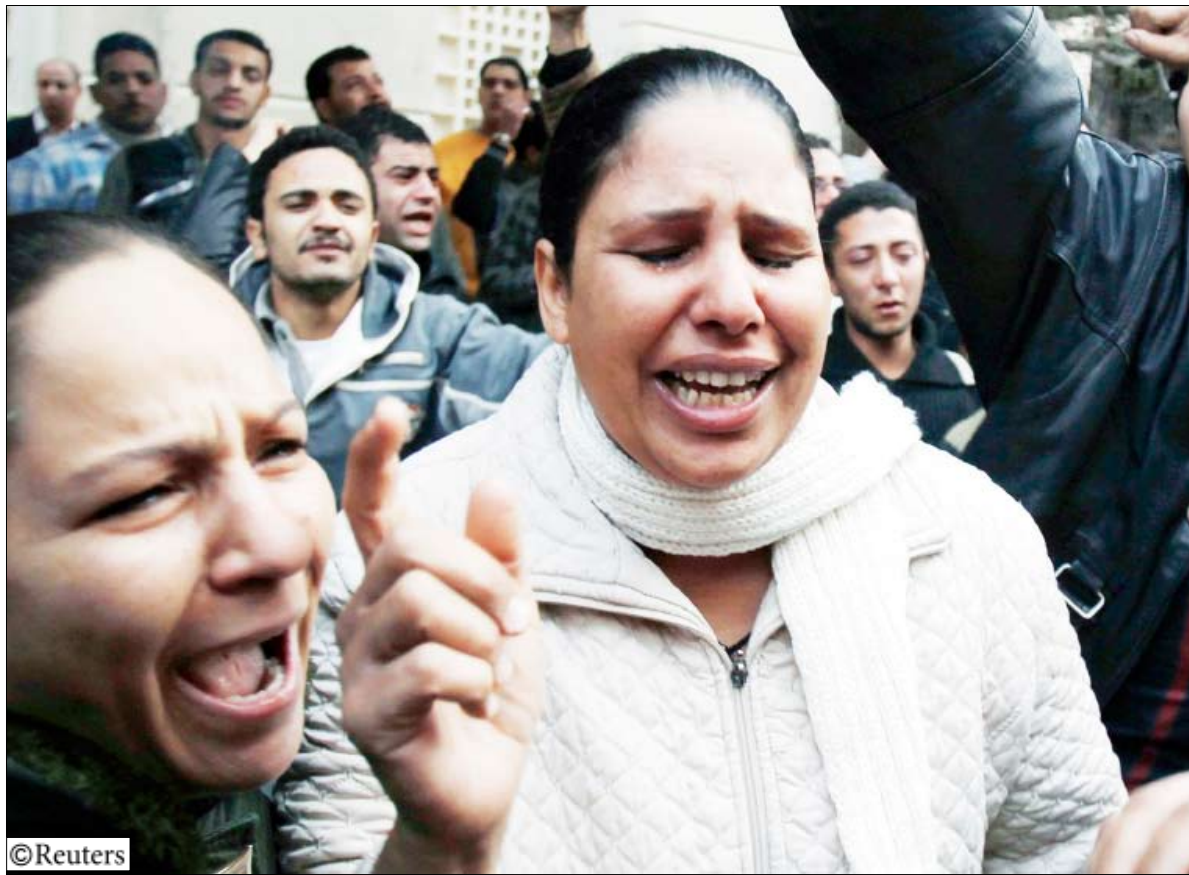
■ سكان بموقع انفجار أمام الكنيسة في الإسكندرية بشمال مصر يوم أمس السبت .