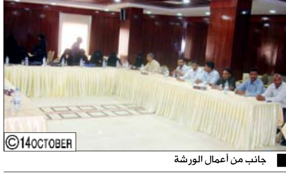
جانب من أعمال الورشة

صنعاء / سبأ: عقدت يوم أمس في فندق (صن شاين) الدورة التدريبية عن المحاسبة لغير المحاسبين في مجال المشاريع الصغيرة وورشة التحليل المالي للقروض التي ينفذها صندوق الرعاية الاجتماعية ويشترك فيها (25) مشاركا ومشاركة من "عدن وأبين والمكلا والمهرة وسبوتون وشبوة واليه صرف وتناول الدورة على مدى أربعة أيام عددا من الموضوعات منها الية صرف قروض صندوق الرعاية الاجتماعية عبر بنك التسليف التعاوني والزراعي والمحاسبة لغير المحاسبين للمشاريع الصغيرة والمتناهية الصغر وكذا التحليل المالي للقروض واعاد محفظة القروض والتصاميم والإرشادات المتعلقة بصرف القروض والسداد.