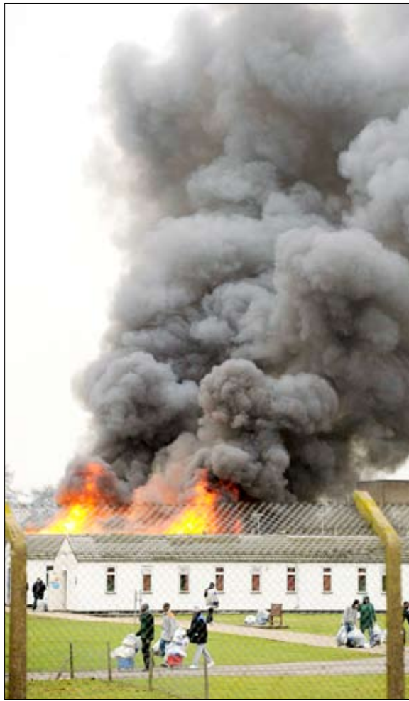
■ احريق في سجن بجنوب إنجلترا