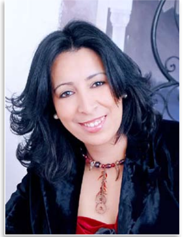
النقد هو الوجه الآخر للإبداع

مسابقة أمير الشعراء مشروع متميز وسبق ثقافي حققته أبوظبي في احتفائها بالشعر والشعراء، ويكفي أن الشعر أصبح يدخل بيوت كل الناس ويبتدئونه في شغف فيتحقق بذلك هذا التواصل المتميز بين القصيدة