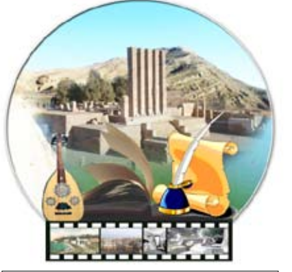
إشراف / فاطمة رشاد