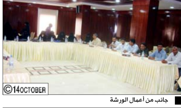
جانب من أعمال الورشة

عقدت يوم أمس في فندق (صن شاين) الدورة التدريبية عن المحاسبة لغير المحاسبين في مجال المشاريع الصغيرة وورشة التحليل المالي للقروض التي ينفذها صندوق الرعاية الاجتماعية ويشترك فيها (25) مشاركاً ومشاركة من عدن وأبين والمكلا والمهرة وسيلون وشبوة والوفا". وتتناول الدورة على مدى أربعة أيام عدداً من الموضوعات منها آلية صرف قروض صندوق الرعاية الاجتماعية عبر بنك التسليف التعاوني الزراعي والمحاسبة لغير المحاسبين للمشاريع الصغيرة والمتناهية الصغر وكذا التحليل المالي للقروض وأعداد محفظة القروض والتصاميم والإرشادات المتعلقة بصرف القروض والسداد.