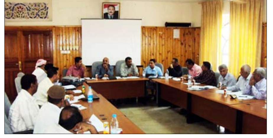
من اجتماع لجنة حوض الدلتا

الرهوي ضرورة تفعيل دور لجنة الحوض ومجلس الري في إطار الدلتا وضبط عملية الري عند تدفق السيول في وادي بناء وحسان ليستفيد منها أكبر عدد ممكن من المزارعين وري مساحات كبيرة من الأراضي والنهوض بالقطاع الزراعي في دلتا أبين. كما أكد الرهوي تنفيذ القرارات الصادرة عن لجنة الحوض في ما يتعلق بالحفر العشوائي للأبار أو التعدي على قنوات الري وبواباتها لتوزيع المياه، والحفاظ على وضع الأودية والحد من عمليات جرف الردميات