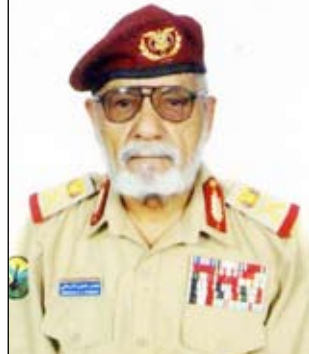
■ اللواء الركن منصر الذرحاني

نعت قيادة وزارة الدفاع، ورتاسة هيئة الأركان العامة المغفور له بإذن الله تعالى اللواء الركن منصر محسن الذرحاني، الذي وافته المنية يوم أمس الأول إثر مرض ألم به عن عمر ناهز 78 عاما قضى معظمه في خدمة الوطن في صفوف القوات المسلحة.