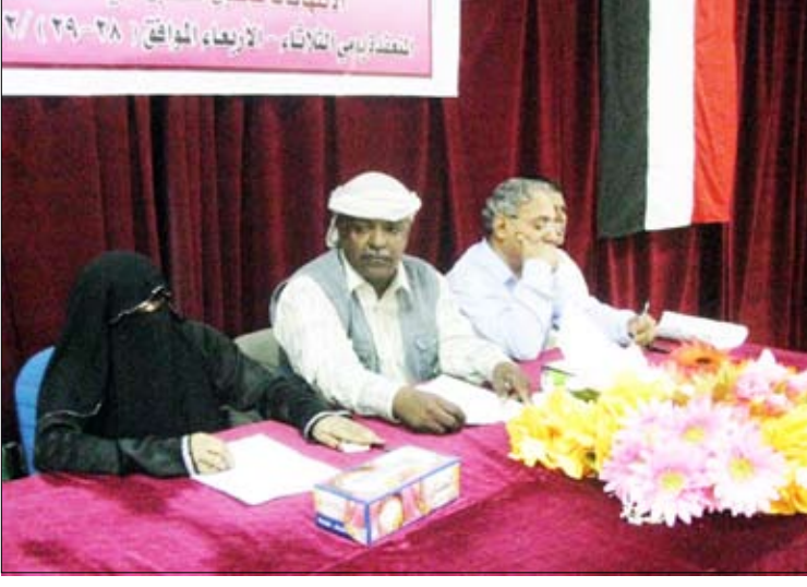
خلال افتتاح الدورة