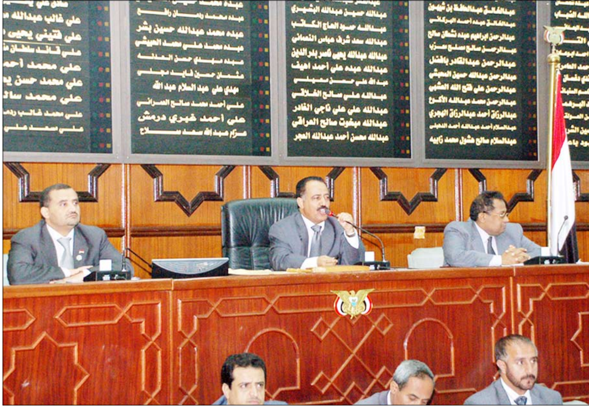
من أعمال جلسات النواب أمس