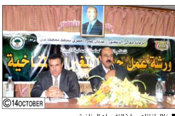
خلال افتتاح ورشة التغيرات المناخية