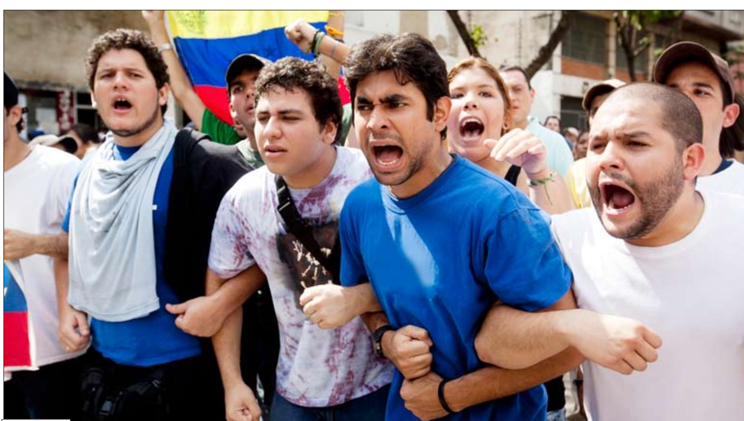
طلاب يحتجون على قانون جديد يشدد من سيطرة الحكومة على الجامعات

كراس / 14 أكتوبر / رويترز؛ استخدمت قوات الأمن الفنزويلية مدافعاً مائياً وأطلقت أعيرة مطاطية لتفريق مئات الطلاب الذين كانوا يحتجون على قانون جديد يشدد من سيطرة الحكومة على الجامعات. ومشروع القانون الذي أقر في الساعات الأولى من يوم أمس هو الأحدث في حزمة قوانين أقرها البرلمان على عجل لتحصين