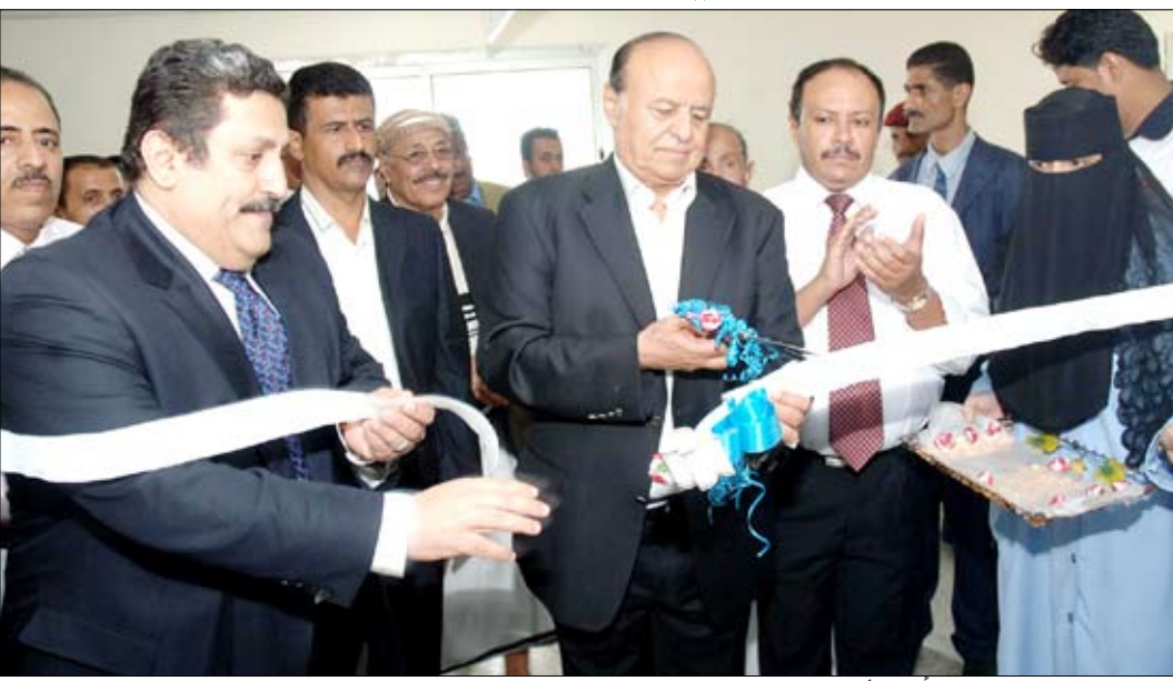
نائب الرئيس يفتتح عدداً من الأقسام بمستشفى الثورة في الحديدة

الحديدة / سا؛ زار الأخ عبدربه منصور هادي نائب رئيس الجمهورية أمس مستشفى الثورة بمدينة الحديدة، وأطلع على الأوضاع العامة للمستشفى ومستوى العمل والإنجاز وما يتعلق بتطور الأداء . وقام الأخ نائب رئيس الجمهورية بافتتاح قسم طوارئ الأطفال الجديد، وبعد أن قص الشريط إيداناً بالافتتاح، زار عناية القسم الذي يحتوي على عشرين سريراً، مطلعاً على طبيعة تجهيزاتها الحديثة . كما افتتح قسم الإنعاش ووحدة العناية بالقلب، وأطلع على التجهيزات الخاصة بهذا القسم . مستمعاً من المختصين إلى إيضاحات حول قدرة الخدمات الطبية والصحية التي تقدم في هذا القسم . وقد أعرب الأخ نائب رئيس الجمهورية عن تقديره لما لمس من مظهر حسن وحركة متطورة في الخدمات الصحية والطبية في هذا المستشفى . متمنياً في كلمة دونها في سجل الزيارات المزيد من العمل والتطور في كل ما يهيم الناس في هذا الجانب الصحي الملح . وزار الأخ عبد ربه منصور هادي نائب رئيس الجمهورية وحدة الأمل لعلاج الأمراض السرطانية، كما زار عناية المرضى . متمنياً لهم الشفاء العاجل . وقد وجه الأخ نائب رئيس الجمهورية بسرعة إقامة بناء مشروع مركز الأمل لمعالجة الأمراض السرطانية وذلك لأهمية هذا المشروع الطبي والصحي خصوصاً في محافظة الحديدة وكذلك لتقديم خدماته للمحافظات المجاورة .