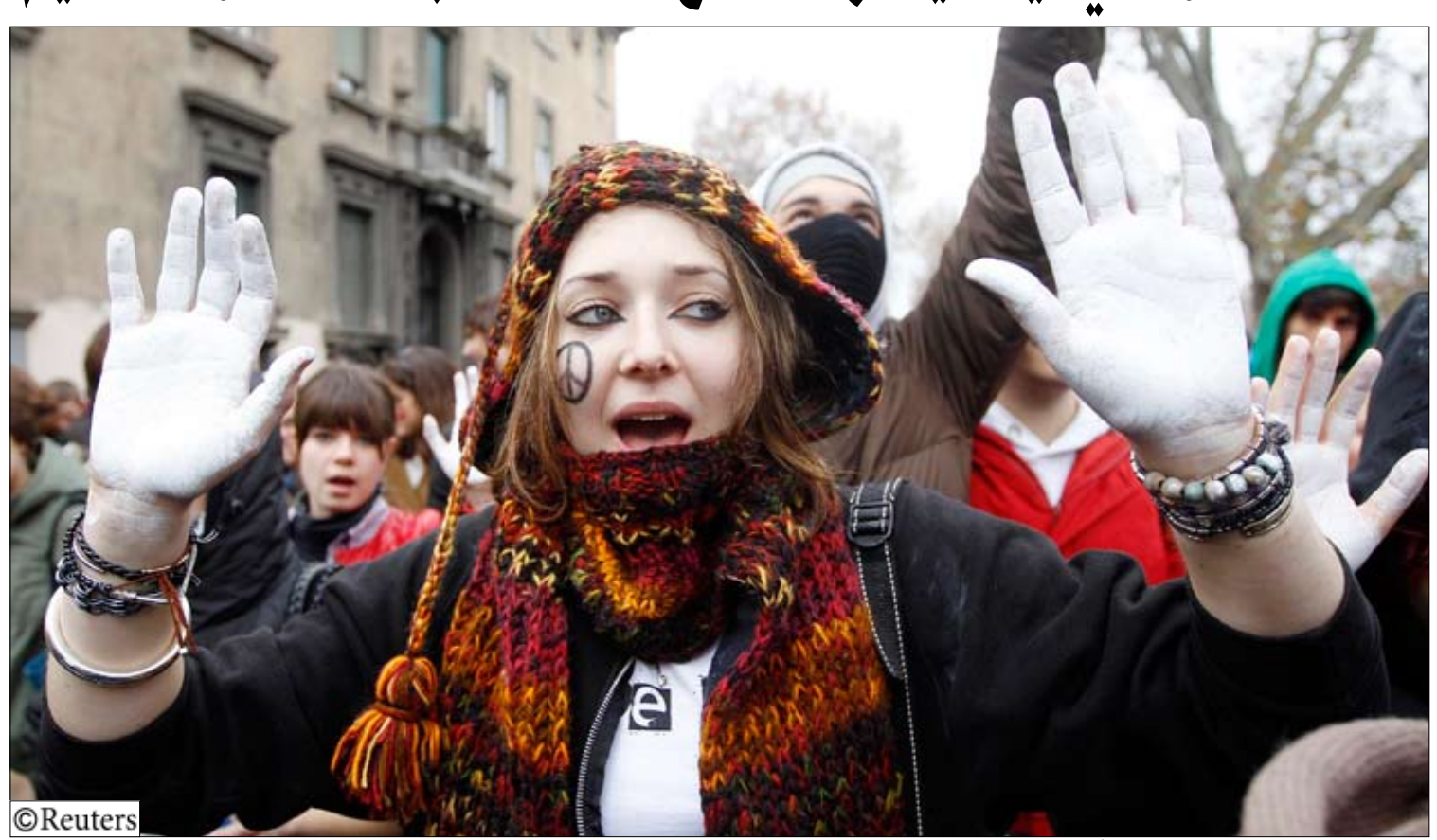
إيطالية تشارك في مسيرات في إيطاليا أمس الأربعاء احتجاجاً على مشروع قانون جديد لاصلاح الجامعات