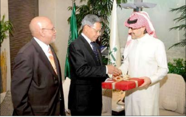
الأمير الوليد يستقبل وزير التجارة الدولية والصناعة

الرياض / فراس الباقعي : استقبل الأمير الوليد بن طلال بن عبد العزيز آل سعود، رئيس مجلس إدارة شركة المملكة القابضة في مكتبة بالرياض معالي داتوء سري مصطفى بن محمد وزير التجارة الدولية والصناعة الماليزية والوفد المرافق. وقد تضمنت الوفد المرافق معالي الوزير البروفيسور داتوء سيد عمر السقايف السفير الماليزي لدى المملكة العربية السعودية وداتوء نهار الدين نور الدين الرئيس التنفيذي والأستاذ أزمان محمود كبير مدراء هيئة تطوير الصناعة الماليزية والأستاذ فاسنتا كومار تارمالينجام المدير التنفيذي للشركة العقارية الماليزية الموحدة وممثلين من الوزارة. وحضر هبة فطاني المدير التنفيذي لإدارة العلاقات والإعلام.