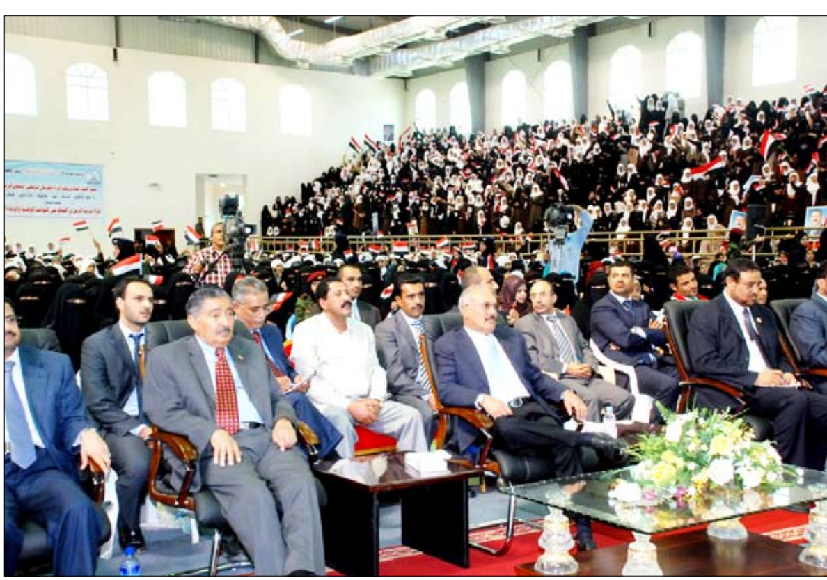
رئيس الجمهورية لدى حضوره المهرجان الرياضي النسوي بعدن أمس

■ عدن / سبأ: استقبل فخامة الأخ الرئيس علي عبدالله صالح رئيس الجمهورية من أخيه محمود أحمدى نجاد رئيس الجمهورية الإسلامية الإيرانية في مقر الرئاسة بمدينة عدن، وذلك خلال اللقاء الذي حضره عدد من المسؤولين من الجانبين، وذلك في إطار العلاقات الأخوية ومجالات التعاون المشترك وسبل تعزيزها بين البلدين والشعبين الشقيقين. وعبرت الرسالة عن حرص إيران وعزمها على تطوير العلاقات بالدفع بمجالات التعاون على مختلف الأصعدة السياسية والثقافية والاقتصادية وغيرها، بالإضافة إلى التشاور إزاء مختلف المستجدات التي تهم البلدين الشقيقين والأمة الإسلامية وخدمة الأمن والاستقرار في المنطقة. وذكر خلال اللقاء بحث جوانب العلاقات والتعاون بين البلدين في مختلف المجالات. وقد حمل فخامة الأخ رئيس الجمهورية، نائب رئيس الجمهورية