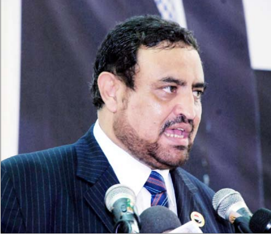
وزير الشباب والرياضة يلقي كلمة الرئيس