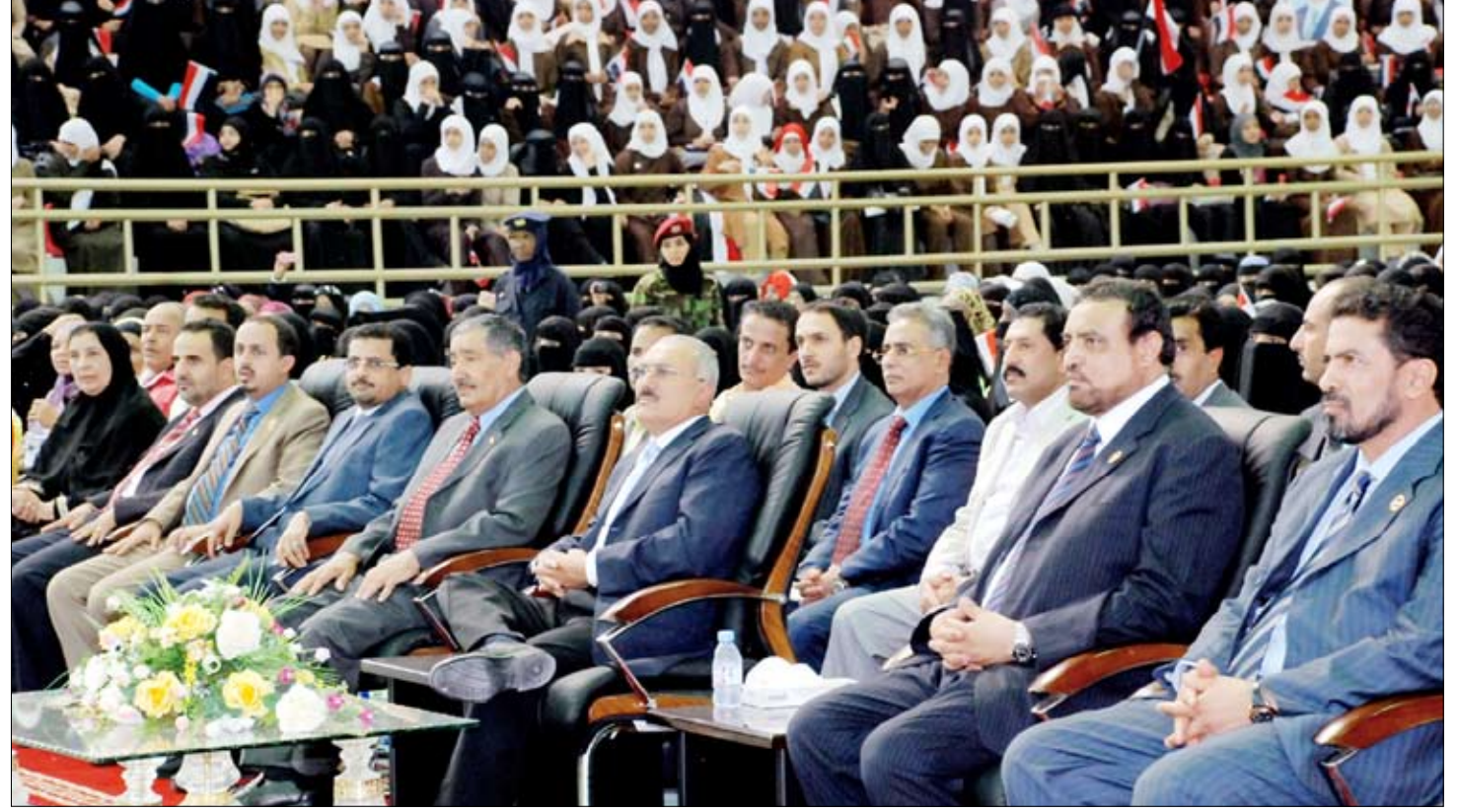
رئيس الجمهورية لدى حضوره المهرجان الرياضي النسوي بعدن أمس