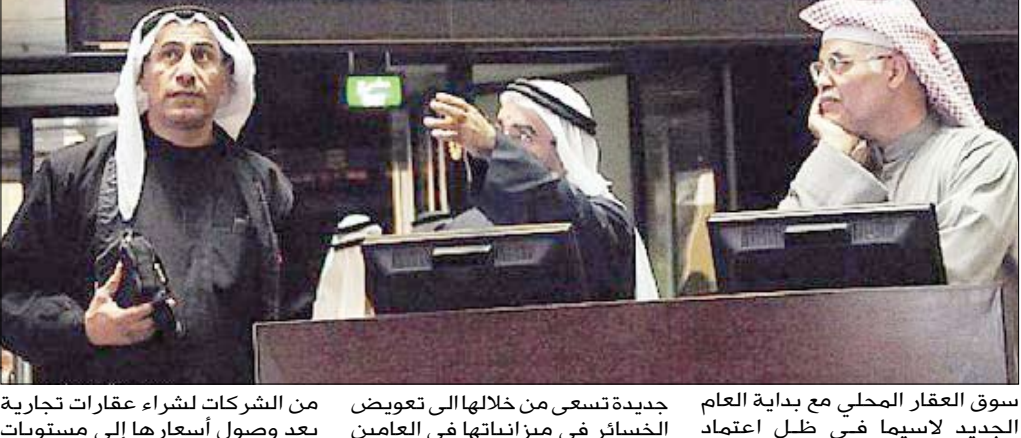
سوق العقار المحلي مع بداية العام الجديد لاسيما في ظل اعتماد الشركات العقارية على استراتيجيات

الكويت / متابعيات : اظهر تقرير متخصص أن حجم التداول العقاري خلال شهر نوفمبر الماضي بلغ 161.4 مليون دينار كويتي متراجعا بنسبة 23 في المئة عن شهر أكتوبر الذي سبقه.