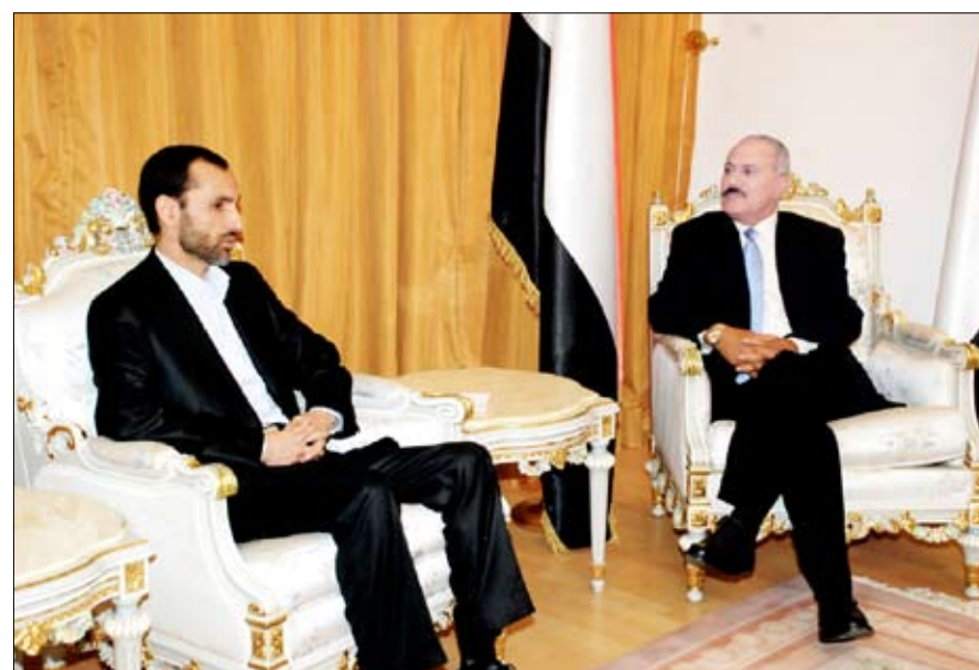
رئيس الجمهورية لدى استقباله المهندس حميد بقائي أمس

■ عدن / سبأ: استقبل فخامة الأخ الرئيس علي عبدالله صالح رئيس الجمهورية من أخيه محمود أحمدى نجاد رئيس الجمهورية الإسلامية الإيرانية في مقر الرئاسة بمدينة عدن، وذلك خلال اللقاء الذي حضره عدد من المسؤولين من الجانبين، وذلك في إطار العلاقات الأخوية ومجالات التعاون المشترك وسبل تعزيزها بين البلدين والشعبين الشقيقين. وعبرت الرسالة عن حرص إيران وعزمها على تطوير العلاقات بالدفع بمجالات التعاون على مختلف الأصعدة السياسية والثقافية والاقتصادية وغيرها، بالإضافة إلى التشاور إزاء مختلف المستجدات التي تهم البلدين الشقيقين والأمة الإسلامية وخدمة الأمن والاستقرار في المنطقة. وذكر خلال اللقاء بحث جوانب العلاقات والتعاون بين البلدين في مختلف المجالات. وقد حمل فخامة الأخ رئيس الجمهورية، نائب رئيس الجمهورية