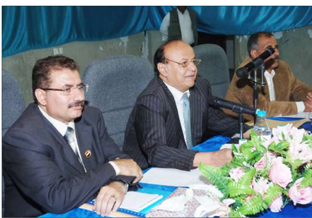
نائب الرئيس لدى حضوره اللقاء الموسع لقيادات المؤتمر الشعبي العام وقيادات أحزاب التحالف الوطني أمس

■ بريمة / سبأ: حضر الأخ عبدي بن منصور هادي نائب رئيس الجمهورية النائب الأول لرئيس المؤتمر الشعبي العام الأمين العام خلال زيارته لمحافظة ريمة أمس اللقاء الموسع لقيادات المؤتمر الشعبي العام وقيادات أحزاب التحالف الوطني. وفي اللقاء الموسع لقيادات المؤتمر الشعبي العام وقيادات التحالف الوطني الديمقراطي تحدث نائب رئيس الجمهورية بكلمة أكد فيها أنه في أبريل القادم سوف تشهد اليمن حدثاً ديمقراطياً كبيراً يتمثل في الانتخابات البرلمانية، وأن الجميع يذكر أن هذه الانتخابات قد تأجلت دستوريا بناء على طلب الإخوة في المشترك الذين قدموا بأنفسهم صيغة اتفاق فبراير 2009م، ثم انقلبوا عليه بوثيقة الإنقاذ الوطني. وأردف نائب رئيس الجمهورية " لقد رفضت أحزاب المشترك كل المقترحات وراحت تروج للإشاعات والأكاذيب وكان الوقت يمر سريعاً ولم يتبق من موعد الانتخابات إلا القليل من الوقت وهو ما دفع بالمؤتمر الشعبي العام وحلفائه من أحزاب التحالف الوطني الديمقراطي إلى تحمل المسؤولية ودعوة الكتلة البرلمانية للتحالف لمناقشة التعديلات على قانون الانتخابات التي كان المشترك قد وافق عليها مادة مادة ضماناً لإجراء الانتخابات في موعدها". وتابع " الآن وقد أقر القانون وتم إعادة تشكيل اللجنة العليا للانتخابات من القضاة وهو مقترح المعارضة الذي تضمنه اتفاق المبادئ في 2006م وبعد صدور قرار تشكيلها ندعو قادة المشترك إلى تغليب صوت العقل ومصاحبة الوطن على كل المصالح الأخرى". (التفاصيل ص 2)