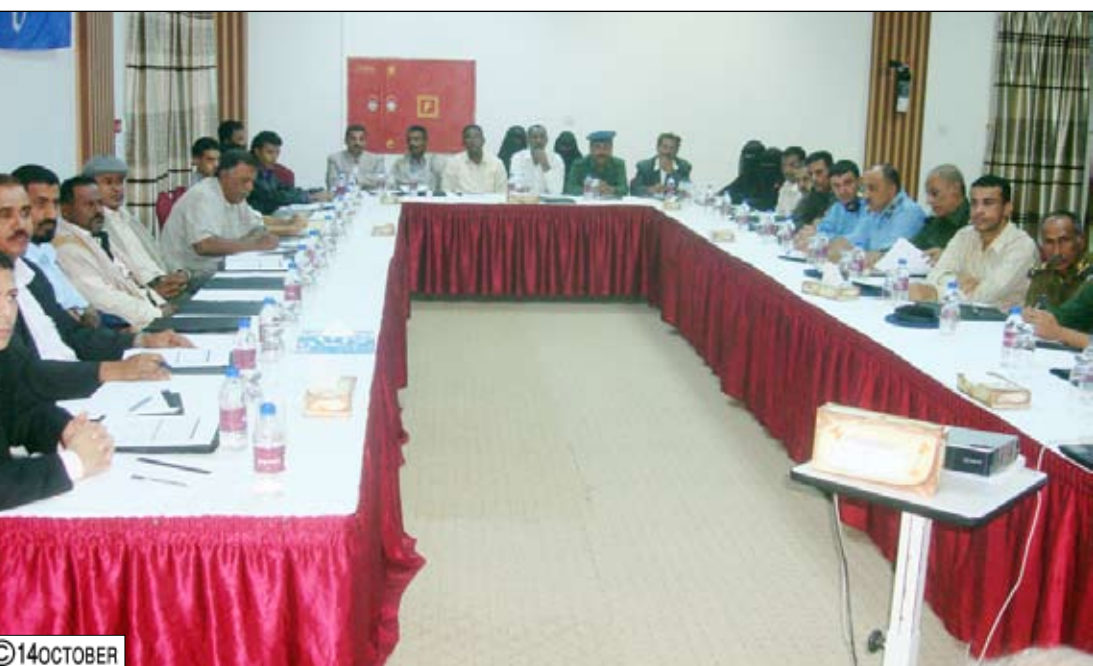
جانب من الحضور في الدورة

ورشة عمل في ابريل الماضي بصنعاء حول الحماية وتقديم المساعدة المباشرة لضحايا التهريب والاتجار، شارك فيها مختلف الشركاء اليمنية والمجتمع المدني لمكافحة ومنظمات المجتمع المدني والمنظمات المهجرة الدولية.