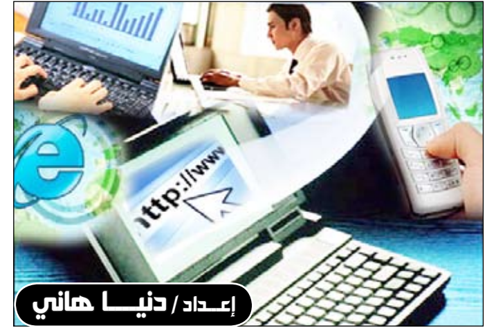
إعداد / دنيا هاني

إي إن إن/متابعات، بالاستناد إلى مشاركات من تويتر أسست مجموعة من مطوري البرامج الإلكترونية موقعاً يحمل عنوان (twistor) وهو عبارة عن جمع ونشر مشاركات تويتر والتي تركز على ست كلمات أساسية. أما الكلمات الست فهي: أحب، أكره، أعتقد، أفكر، أشعر، أتمنى. وتظهر هذه الكلمات على الجانب الأيسر من الصفحة السوداء لموقع (twistor) وباللون مختلف تميزها عن بعضها البعض. والمشاركات التي تحتوي على إحدى هذه الكلمات تظهر على الصفحة من الأسفل إلى الأعلى، وتتغير كل ثانية، ويبقى تحركها بهذا الشكل إلى ما لا نهاية. ووفقاً لما ذكره موقع (سي إن إن) فعند الضغط على كلمة (أحب) تظهر جميع مشاركات تويتر التي تحتوي على هذه