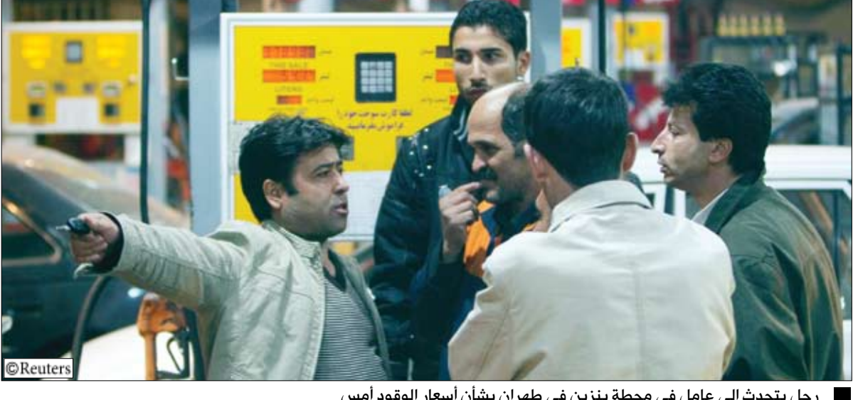
رجل يتحدث إلى عامل في محطة بنزين في طهران بشأن أسعار الوقود أمس

طهران / 14 أكتوبر / رويترز: ارتفع سعر البنزين في إيران إلى أربعة أمثاله أمس الأحد في ظل انتشار أممي مكثف للحيولة دون تكرار أعمال الشغب التي اندلعت في المرة السابقة حينما قننت الحكومة توزيع البنزين المدعم بشكل كبير. وأصبح أصحاب السيارات زيادة سعر البنزين في الأشهر الثلاثة الأخيرة في إطار سياسة الرئيس الإيراني محمود أحمدني نجاد لخفض الدعم تدريجيا على مواد أساسية مثل الطاقة والأغذية والمياه ولذا فإن الزيادة التي بدأ سريانها في منتصف ليل أمس استقبلها الإيرانيون بأجواء من التسليم بأمر واقع بغض. وقال أحد العاملين في محطة وقود في طهران رافعا حاجبه بطريقة ساخرة «هل الناس سعداء.. بالطبع يرحب الإيرانيون دائما بارتفاع الأسعار». ورأى شهود من رويترز حضورا مكثفا لعناصر الشرطة وقود عديدة ليلة الأحد مع إعلان أحمدني نجاد في برنامج