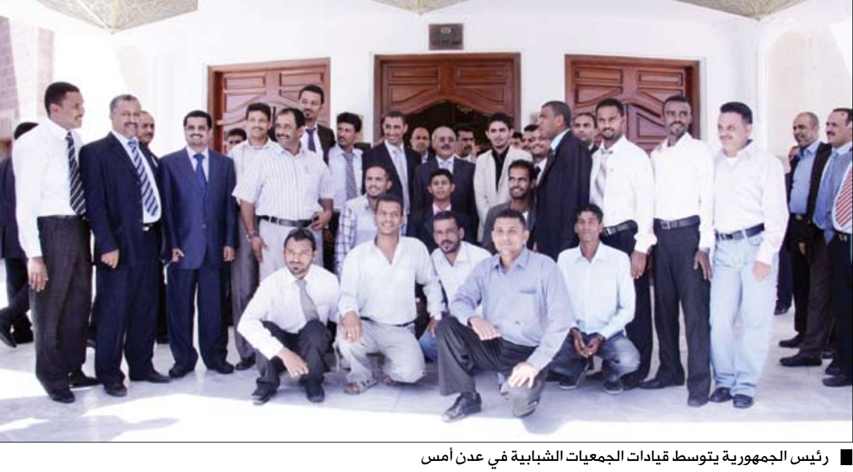
رئيس الجمهورية يتوسط قيادات الجمعيات الشبابية في عدن أمس

قال فخامة الأخ الرئيس علي عبدالله صالح رئيس الجمهورية: «إن الشباب هم قوة الحاضر وعماد المستقبل والروح المتوثبة للعطاء من أجل الوطن». جاء ذلك لدى لقائه أمس قيادات الجمعيات الشبابية بالعاصمة الاقتصادية والتجارية عدن واطلاعه على نشاطات الجمعيات الشبابية ودورها في تبني القضايا الوطنية وخدمة المجتمع في إطار الدور الذي تقوم به منظمات المجتمع المدني في عدن. وأشاد فخامته بالدور الذي لعبه الشباب في الوطن وفي محافظات عدن وأبين ولحج على وجه الخصوص في إنجاح فعاليات خليجي 20 وتقديم صورة رائعة وزاهية عن الشباب اليمني وعن اليمن عموما.. مؤكدا الاهتمام بالشباب ورعايتهم وتشجيعهم على استغلال طاقاتهم ومواهبهم في كل ما يخدم الوطن ويحقق له نهضته. ودعت قيادات الجمعيات الشبابية بـ«عدن المجمع إلى الانخراط في صف البناء والتنمية بما يخدم مصالح جميع أبناء الوطن الواحد وطن الـ 22 من مايو العظيم.. مؤكدا دعم الشباب للاستحقاق الدستوري الديمقراطي المتمثل في الانتخابات النيابية القادمة وأنهم سيظلون أوفياء لمبادئ وأهداف الثورة والوحدة وللقيادة السياسية ونهجها الوطني الحريص على مصالح الوطن».