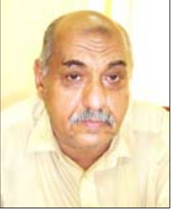
الشيخ الدكتور/ علوي عبدالله طاهر

إن ديننا الإسلامي الحنيف لايمائله دين في الاهتمام بالنظافة، ولا يقارنه تشريع في العناية بالطهارة، فهو دين يدعو للتجمل والتطيب وحسن المظهر في الجسم والثوب والمكان والوجدان، وهو دين يدعو إلى النظافة في المأكول والمشرب وفي كل شيء. إن الماء مثلاً وهو الوسيلة الأساسية والفعالة في احتل التطهر والتنظيف قد احتل مكانته المهمة في القرآن الكريم في كثير من الآيات القرآنية، منها قوله تعالى: (وأزلفنا من السماء ماء طهوراً) « الفرقان 48 » وقوله تعالى: (ويُنزَل من السماء ماء ليطهركم به، ويذهب عنكم رجز الشيطان، وليربط على قلوبكم ويثبت به الأقدام) « الأنفال، 11 ». وقد تكرر ذكر الماء في القرآن الكريم أكثر من ستين مرة، ما يدل على أهميته في حياتنا، ولكن كثيراً منا - للأسف - لم يقدر نعمة الماء، ولم يشكر الله عليها، ولم يدرك أهميته إلا عند غيابه، انظروا إلى أماكن الوضوء في المساجد، وشاهدوا كيف يعيث الناس بالماء، من غير أن ينظفوا أنفسهم، يفتح الواحد منهم الحنفية ثم يتركها مفتوحة دون فائدة وإذا ما توضأ فإنه لا يسبغ الوضوء، وإذا ما اغتسل فإنه ربما يكون غسل جسمه، لكنه لم يغسل قلبه من الأحقاد والكراهية، وقد جاء في الأثر: (عجبت ممن يغسل جسمه مرات في اليوم ثم لا يغسل قلبه مرة واحدة في السنة).