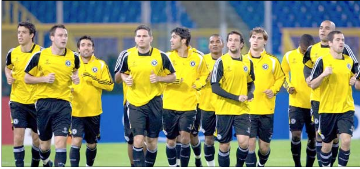
■ فريق تشيلسي