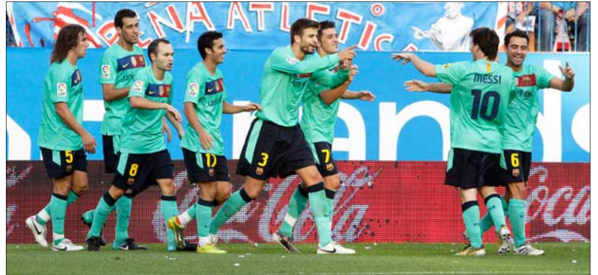
■ فريق برشلونة